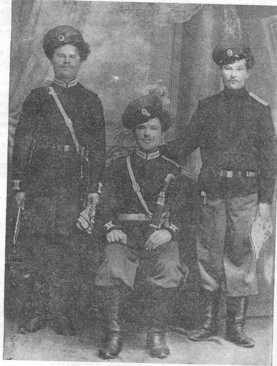
Эти донские казаки сфотографировались перед отправкой на действительную службу в канун первой мировой войны.