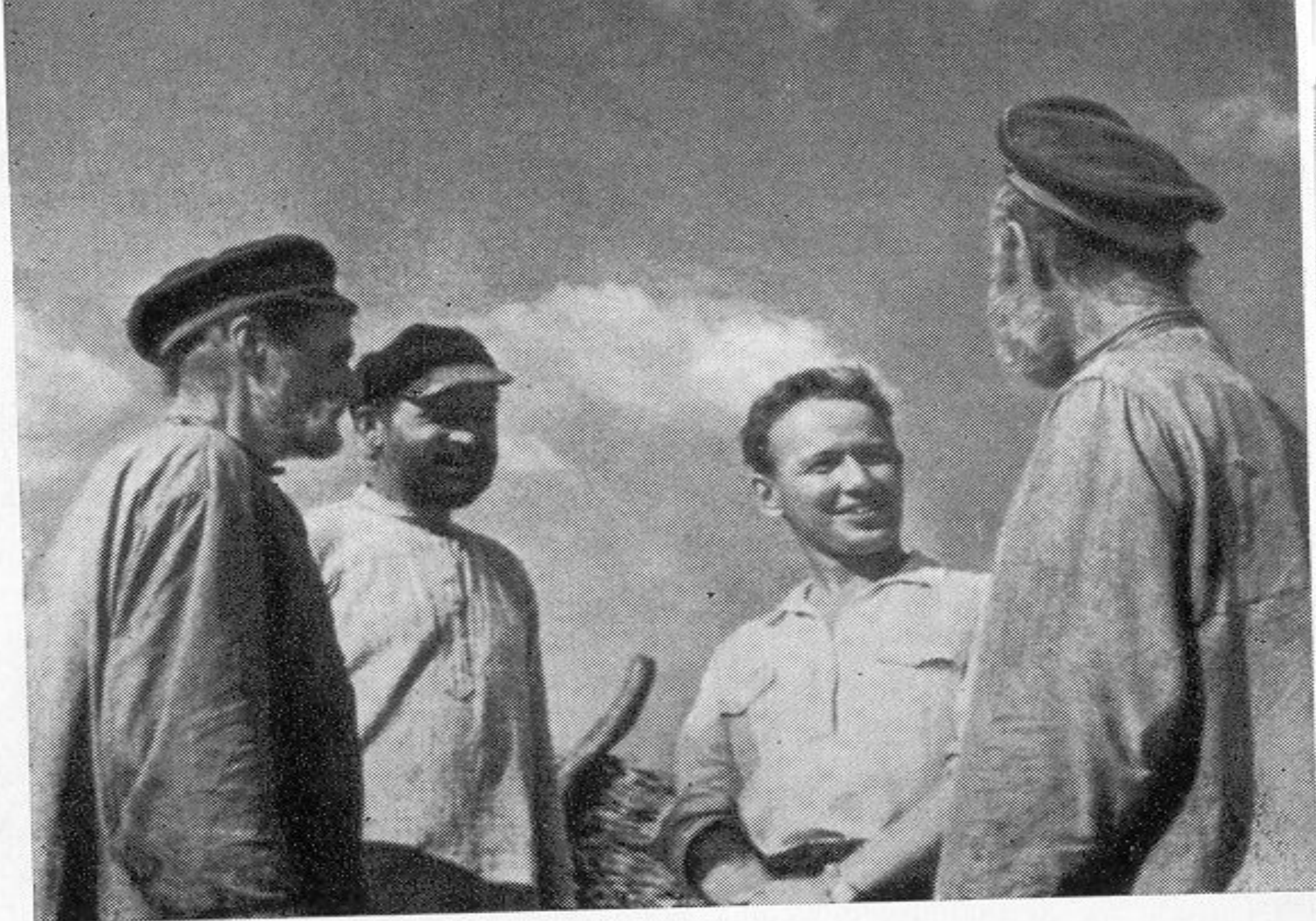
Сыны Тихого Дона.