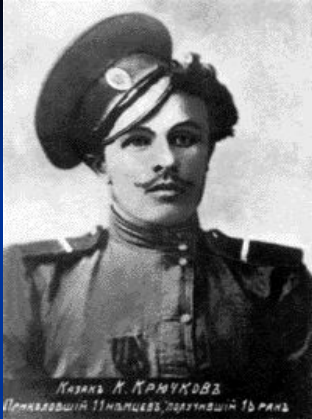
Казакъ К. КРЮЧКОВЪ Полковникъ 11-го пехотнаго полка, поручикъ 16-го пехотнаго полка

Прототип главного героя Герой Первой мировой войны, казак К. Крючков