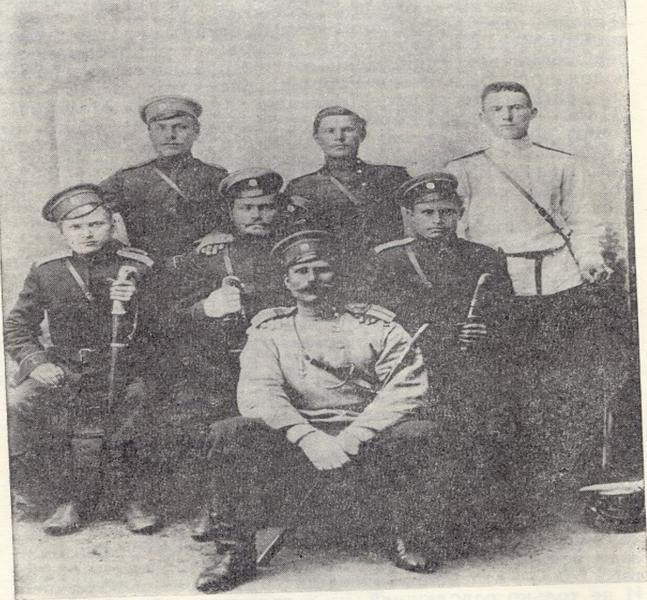
Так выглядели донские казаки, о которых писал Михаил Александрович Шолохов в первой и второй книгах «Тихого Дона».