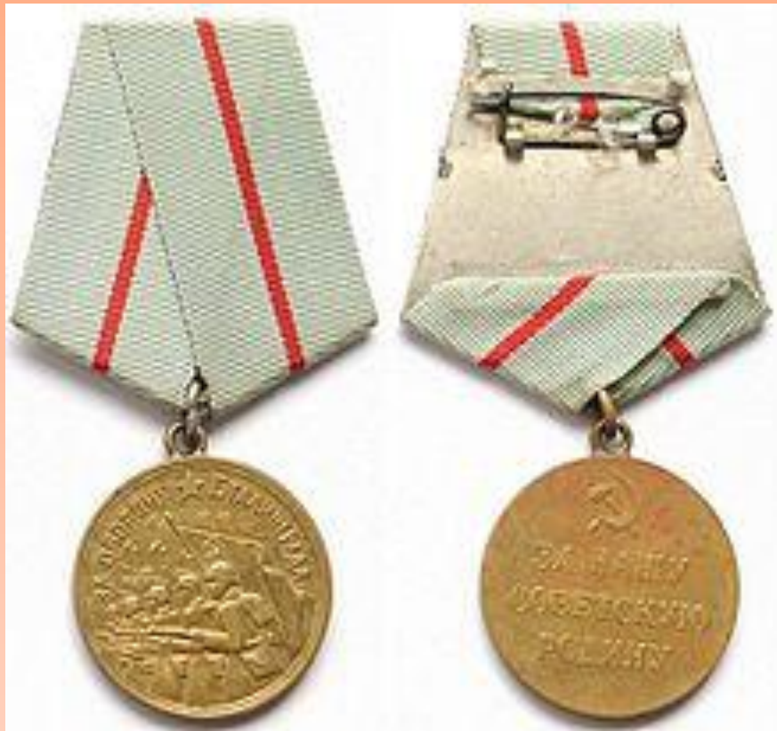
Медаль «За оборону Сталинграда»