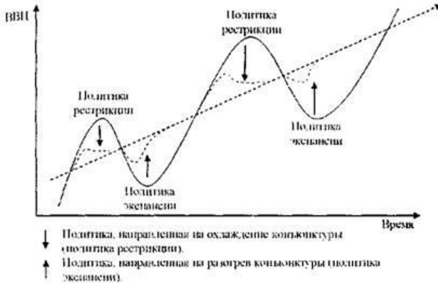
Рис. 13.1. Направления антициклического государственного регулирования экономики