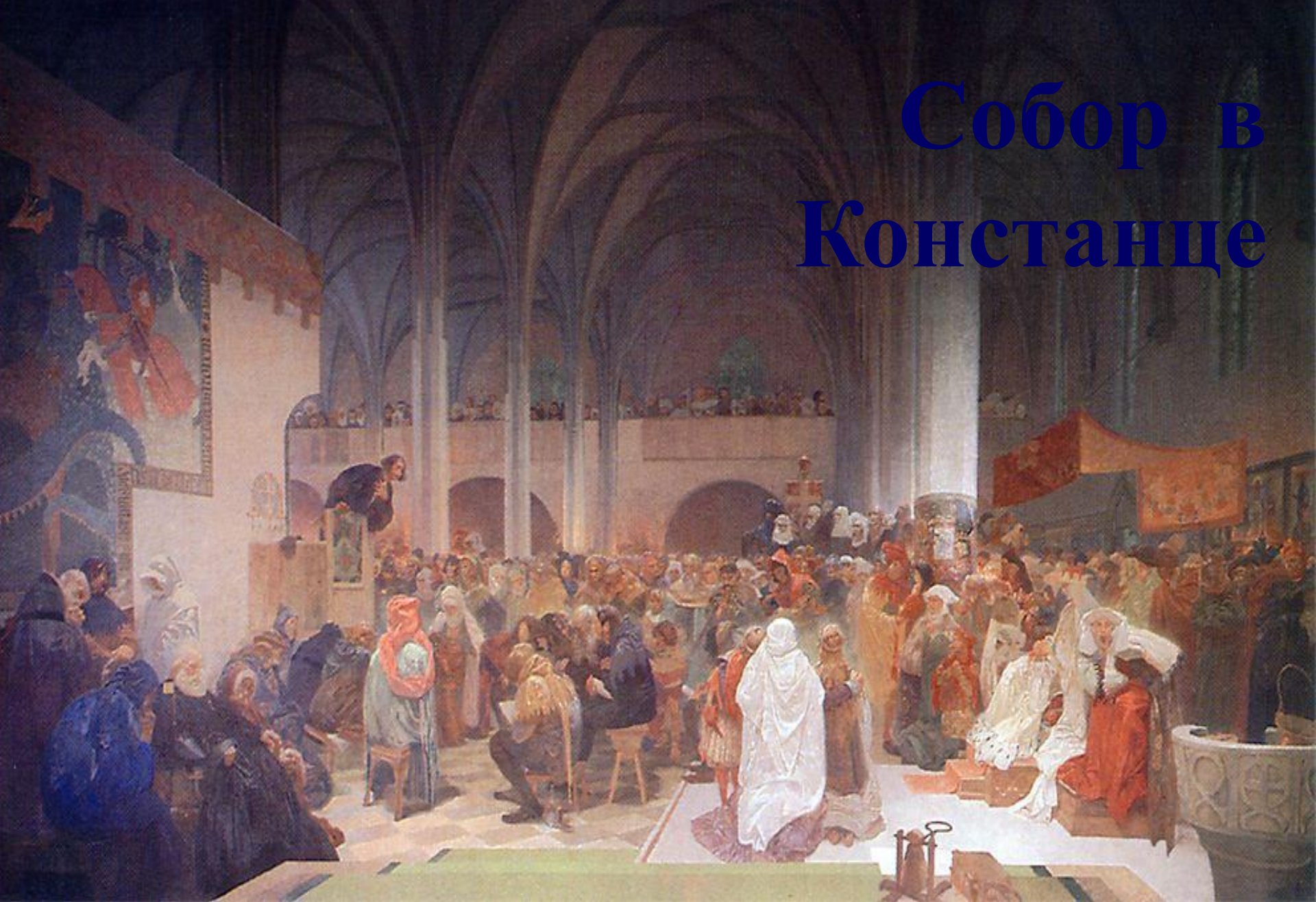
Гус понимал, что ему грозит гибель, но решил поехать на собор, чтобы отстоять свои взгляды