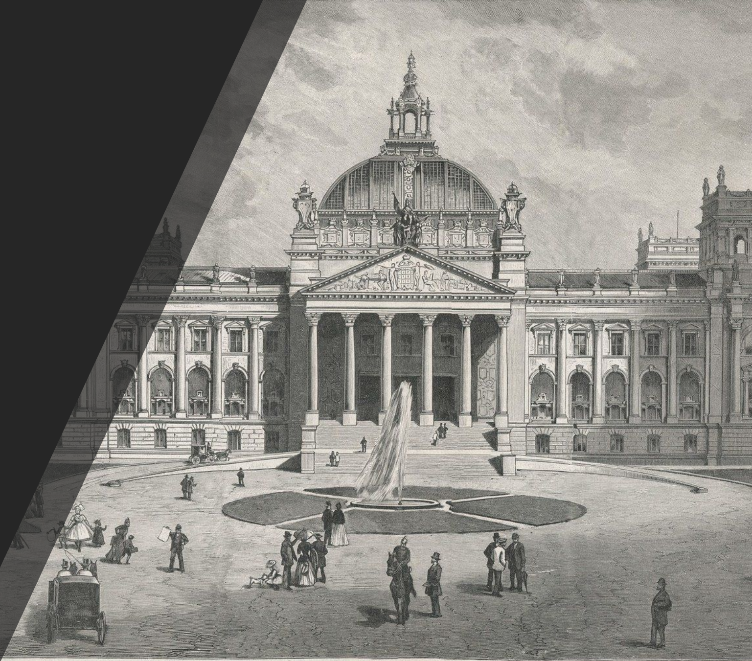
Die Hauptfassade des neuen Reichstagsgebäudes in Berlin. Nach einer Photographie von W. Fechner in Berlin. 1873. Die Gartenlaube. - Die Gartenlaube. Illustrirt von Ernst Keil 1873.

■ Рейхстаг выступал не столько как орган сословного представительства, сколько как орган представительства отдельных политических единиц: курфюсты представляли интересы своих государств, князья – княжеств, бургомистры – имперских городов представляли по должности