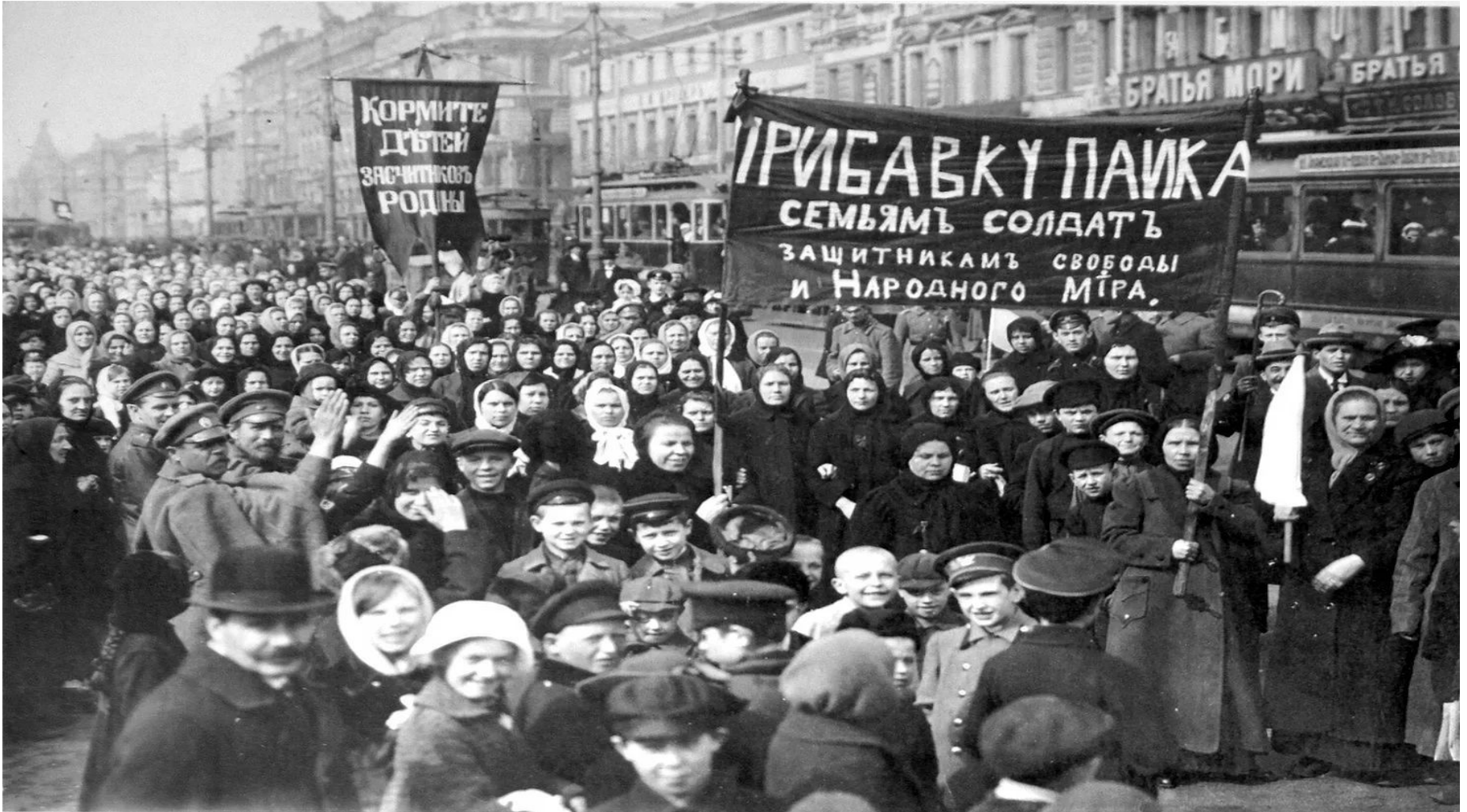
Демонстрации женщин с требованиями хлеба и возвращения мужчин с фронта.