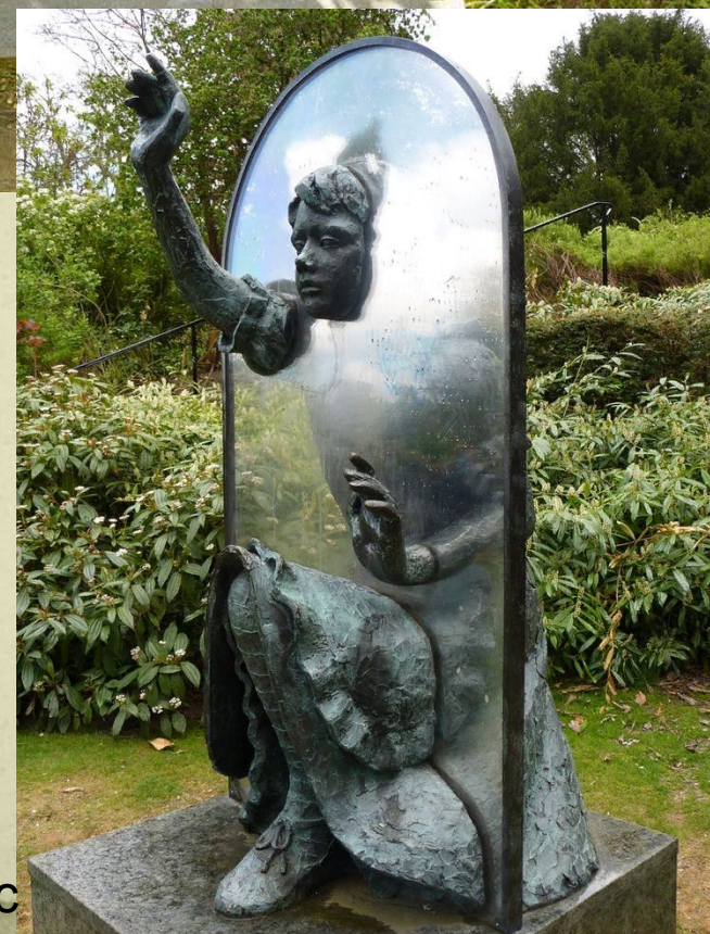
Памятники Алиса в стране чудес