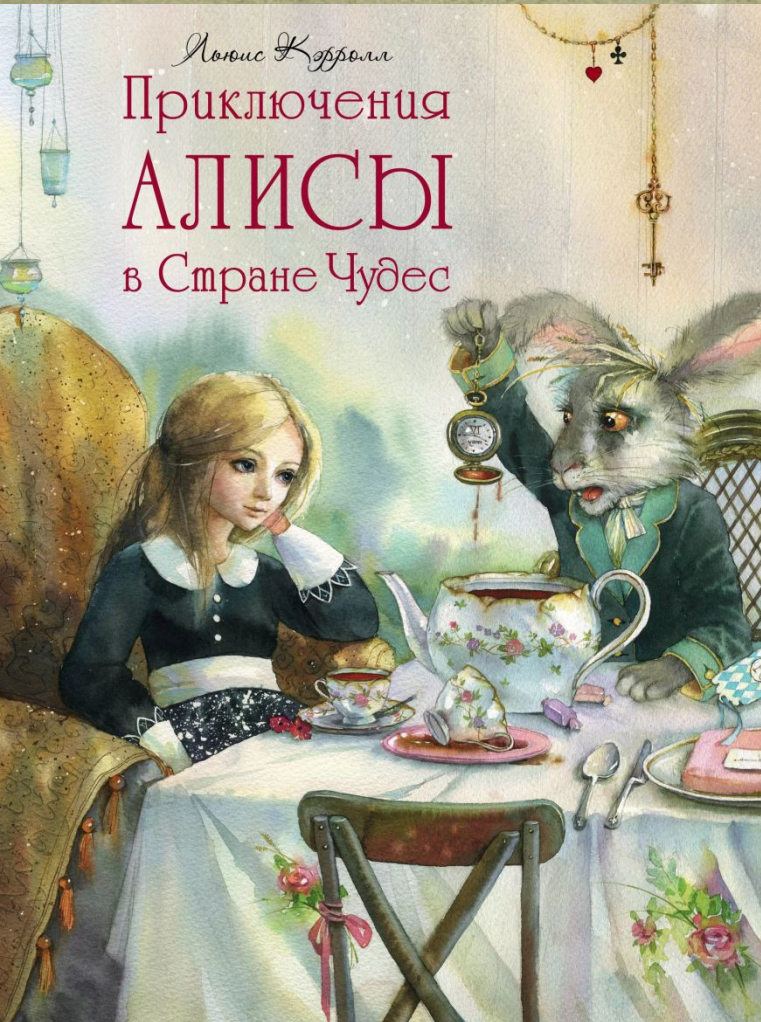
Фото книги Алиса в стране чудес