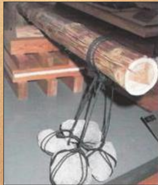
Сушка под прессом