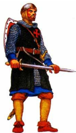
Брат - сержант (XIII век). В отличие от братьев - рыцарей сержанты были низкого происхождения. Каждый из них имел право на одну лошадь. Цвет накидки - черный.