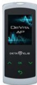
DeVita AP Mini

Регулирует работу органов и систем организма. Излучает физиологические регуляционные частоты, подобные естественным частотам здорового организма. Настраивает органы и системы на здоровую частоту колебания по принципу камертона.