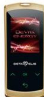
DeVita Energy Mini

Очищает организм от всех известных групп возбудителей заболеваний – вирусов, бактерий, простейших, грибов, гельминтов. Излучает специфические деструктивные частоты, уничтожающие паразитов, не причиняя вреда организму.