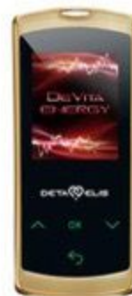
DeVita Energy Mini

Очищает организм от всех известных групп возбудителей заболеваний – вирусов, бактерий, простейших, грибов, гельминтов. Излучает специфические деструктивные частоты, уничтожающие паразитов, не причиняя вреда организму.