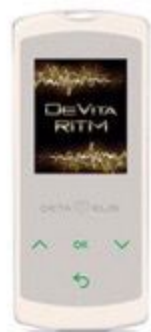
DeVita Ritm Mini

Регулирует работу органов и систем организма. Излучает физиологические регуляционные частоты, подобные естественным частотам здорового организма. Настраивает органы и системы на здоровую частоту колебания по принципу камертона.