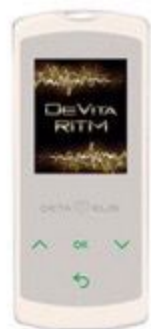
DeVita Ritm Mini

Регулирует работу органов и систем организма. Излучает физиологические регуляционные частоты, подобные естественным частотам здорового организма. Настраивает органы и системы на здоровую частоту колебания по принципу камертона.