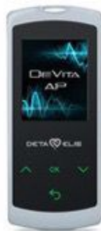
DeVita AP Mini

Регулирует работу органов и систем организма. Излучает физиологические регуляционные частоты, подобные естественным частотам здорового организма. Настраивает органы и системы на здоровую частоту колебания по принципу камертона.