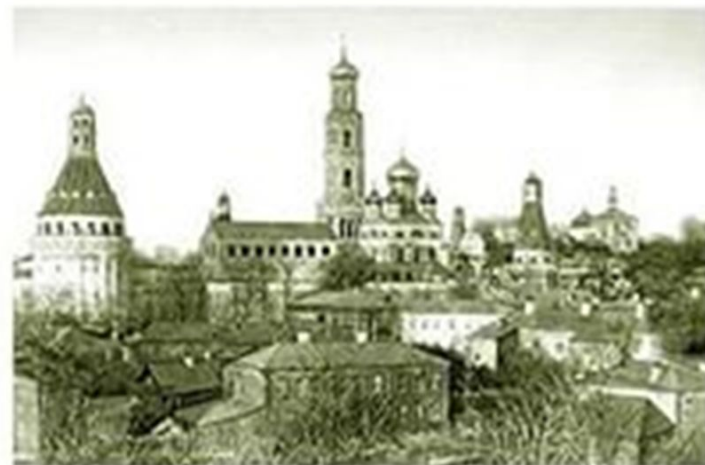
Александр Алябьев был похоронен в 1852 г. в Симоновом монастыре