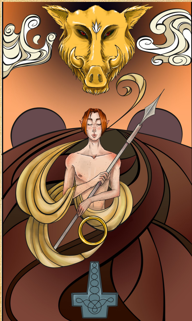
Иллюстрация к мифу о волосах Сиф