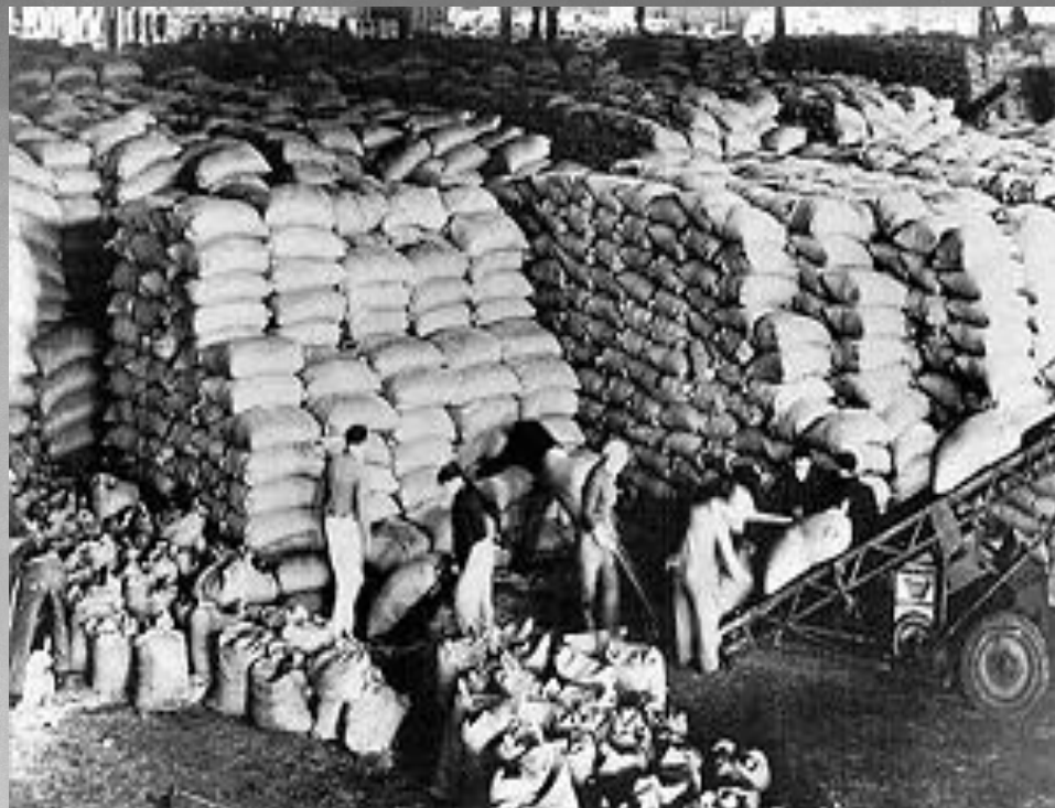
Заготовление зерна на экспорт

Был достигнут довоенный уровень промышленного производства в сельском хозяйстве – в 1950 г.