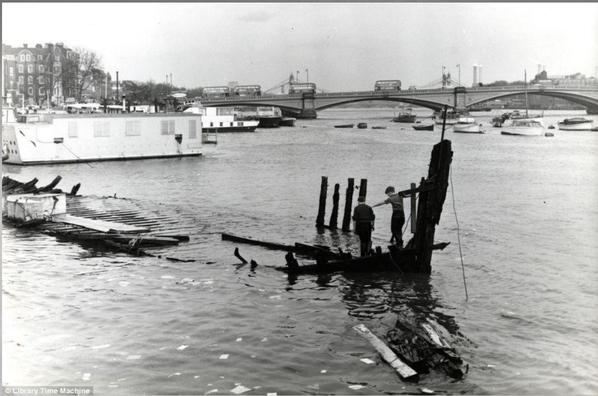
Берег Темзы 1950 год.

В Великобритании 1950-е – 1960-е гг. характеризуются периодом своеобразного застоя в экономике и политической жизни. Из-за разрушения колониальной системы промышленность Великобритании долгое время не могла приспособиться к новым условиям. Бывшие «свои» рынки стали теперь «чужими» и свободными. Ко всему прочему, Великобритания отгораживалась от создаваемого Европейского Экономического Союза, считая, что такая свободная торговая зона нанесёт ещё больший вред её экономике.