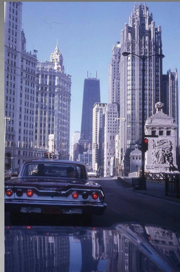
Чикаго. США. 1969г.

Наиболее важное, что стоит сказать об американском образе жизни, это появление различного количества символов независимости. Личный дом в пригороде, машина и не одна, стабильная, пристойная работа, технические новации, доступ почти ко всем группам товаров — всё то, что у было у средней американской семьи. Это и считалось переломным моментом в истории США XX столетия. Это очень серьезная веха в истории человечества. Человек более не ограничен собственной деревней либо районом города, пред ним стоит вся страна, ему известны все события, происходящие через 5 тысяч миль.