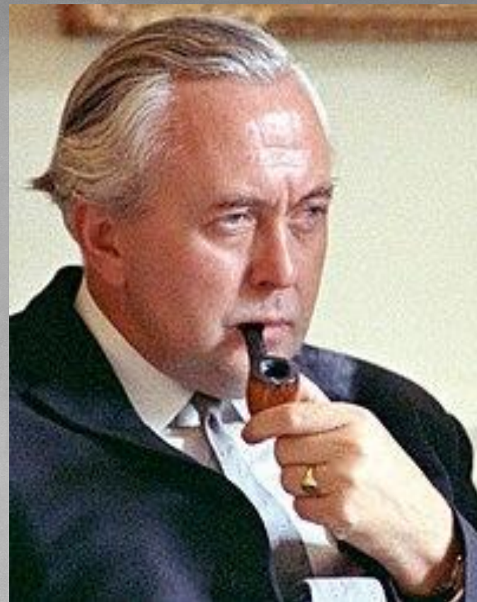
Джеймс Гарольд Уилсон

При лейбористском правительстве Г. Вильсона (1964 - 1970 гг.) продолжается политика программирования (национальный план на 1964 - 1970 гг.), национализируется черная металлургия (1967 г.). Были повышены пенсии , установлен контроль за квартплатой . Создано Национальное управление по ценам и доходам. После выборов 1966 г. в парламент внесен антипрофсоюзный законопроект . С 1966 г. вводятся запреты на повышение зарплаты . Такова практика "государства благосостояния".