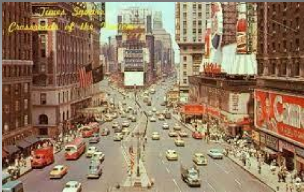
Нью-Йорк 1949 год.

В экономике наблюдался подъём. Уровень жизни простого американца рос. Наступила т.н. «эпоха потребления». Промышленность США практически мгновенно перестроилась с военных рельс на гражданскую продукцию, чем обеспечила изобилие товаров на прилавках магазинов. Новые автомагистрали облегчали дорогу на окраины к крупным торговым центрам. Постановлением конгресса от 1956 года на сооружение автострад выделялось 26 млрд. долл. — самая крупная в американской истории цифра расходов на государственные подряды