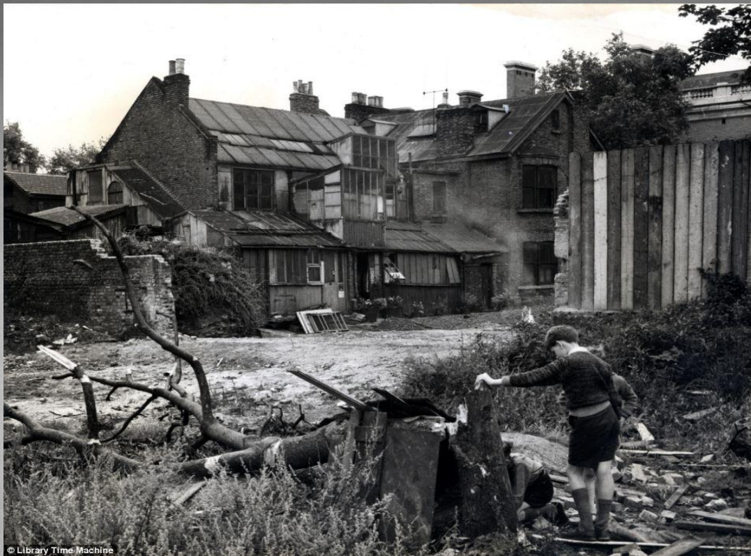
Районы Лондона - Кенсингтон и Чесли, 50х и 60х годах.

В 1950-1960-х годах среднегодовой прирост промышленной продукции Великобритании составлял лишь 3% , тогда как в США - 4, ФРГ и Италии - по 7,4.