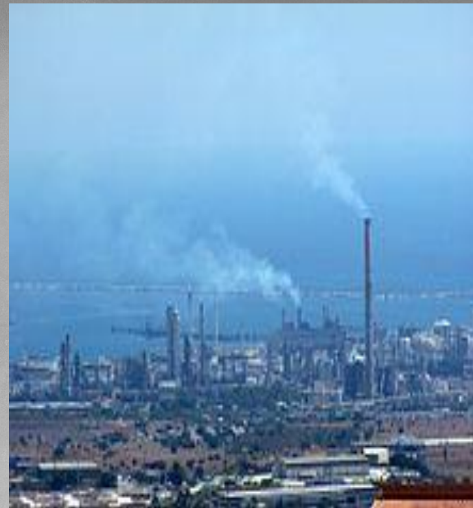
Нефтеперерабатывающий завод в Сиракузах, Сицилия

С открытием в Италии запасов нефти была учреждена государственная компания «ЭНИ» , целиком взявшая в свои руки новую отрасль промышленности — нефтехимическую. Государственные капиталовложения составили в 1952—1953 гг. 41 % всех инвестиций , а в 1959 году только на долю Института промышленной реконструкции и «ЭНИ» приходилось 30 % их общей массы .