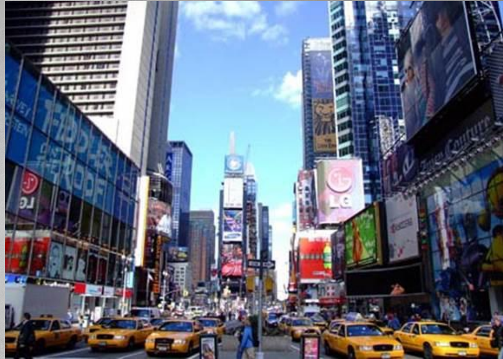
«Эпоха потребления». Нью-Йорк 1952 год.

США. В отличие от стран Европы, которые после Второй мировой войны лежали в руинах, США стали проводить политику резкого скачка. Война, вывела экономику штатов из кризиса. Оборонные поставки странам-союзникам predeterminedелили рабочие места и занятость населения.