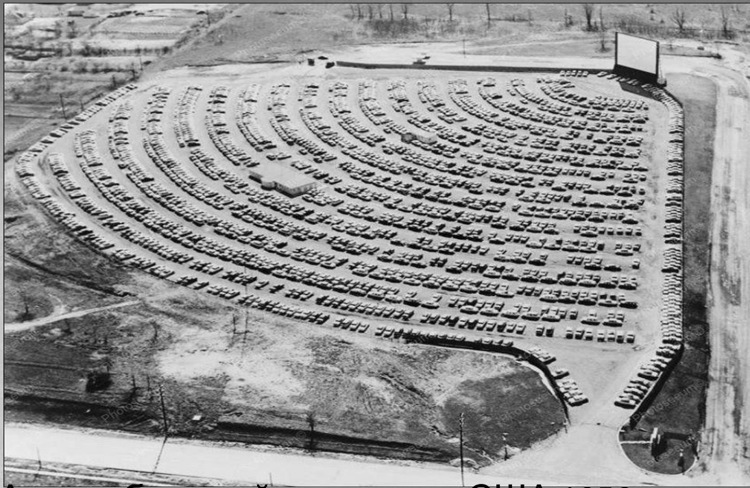
Автомобильный кинотеатр, США 1950-е годы.

Рост рынка продажи автомобилей в 1945–1955 годы также увеличился в 4 раза, также поднялось число приобретаемых холодильников, стиральных и посудомоечных машин, электропечей и в особенности телевизоров.