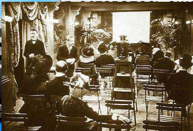
Первый показ Синематографа.

Кино в Россию привезли французы. Первый показ состоялся 4 мая 1896 года в Санкт – Петербурге. Но и многие русские фотографы быстро научились снимать документальные сюжеты. Однако до появления русских игровых лент