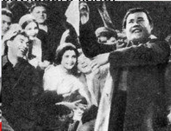
Первый звуковой фильм в России «Путевка в жизнь»

«Чапаев» — советский художественный фильм 1934 года. На I Московском кинофестивале 1935 года создатели «Чапаева»