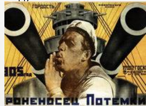
Знаменитый на весь мир фильм Сергея Эйзенштейна «Броненосец Потемкин».

Немой исторический художественный фильм, снятый на киностудии «Мосфильм» в 1925 году.