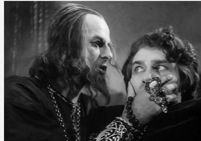
«Иван Грозный» - 1945 г – историческая кинокартина о царе Иване Грозном.