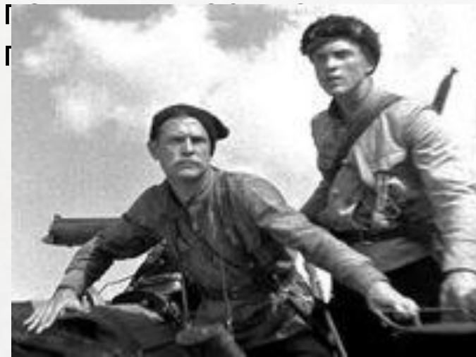
Кадр из фильма «Чапаев»

«Чапаев» — советский художественный фильм 1934 года. На I Московском кинофестивале 1935 года создатели «Чапаева»