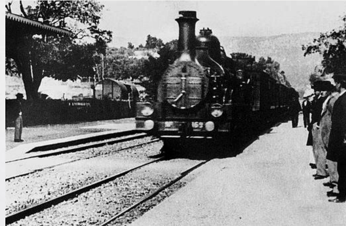
Кадр из фильма «Прибытие поезда на вокзал Ла - Съота»

В 1894 г французы братья Люмьер – Огюст и Луи услышали о кинетоскопе. Этот прибор представляющий собой ящик с движущимися фото, создал Томас Эдисон. Зритель глядя, в кинетоскоп видел движение различных предметов. Братья построили свой собственный прибор – «кинематограф», который проецировал изображение на экран. В 1895 году братья Люмьер показали первый фильм «Прибытие поезда», который длился менее 1 минуты.