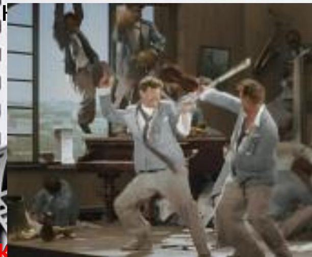
Кадр из музыкальной комедии «Веселые ребята»

«Веселые ребята» - первая музыкальная кинокомедия, снятая в 1934 году в СССР. Фильм считается классикой советской