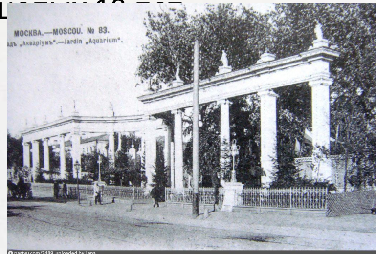
Первый в России киносеанс в парке «Аквариум» (Санкт - Петербург)