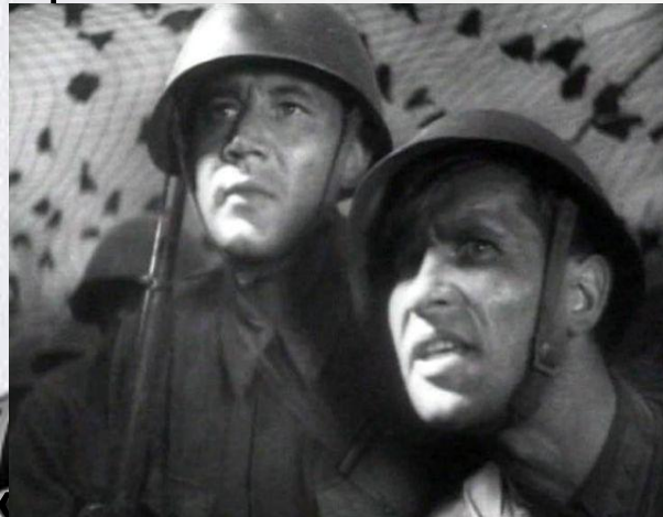
художественный фильм о дружбе защитников Ленинграда

Во время Великой Отечественной войны продолжает развиваться кинематограф. Создаются документальные киножурналы и на экраны страны выходят художественные