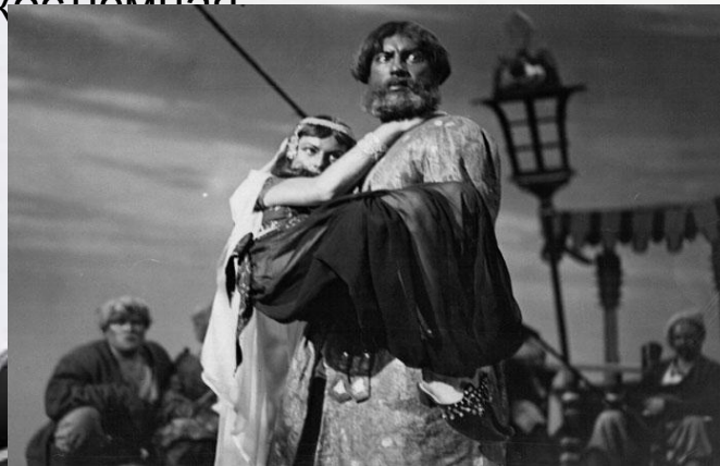
Первый немой русский фильм «Степан Разин»

В 1908 году режиссер и Александр Дранков поставил первый русский художественный фильм с актерами под названием «Понизовая вольница» («Степан Разин»). Картина была черно-белая, немая, короткометражная, костюмная.