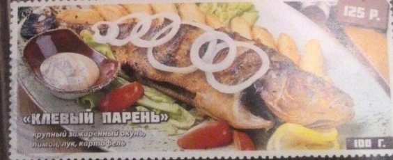
«КЛЕВЫЙ ПАРЕНЬ» крупный жаренный окунь, лимон, лук, картофель