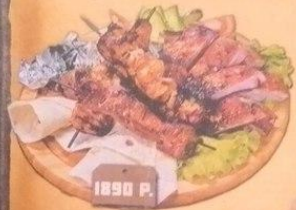
«ДУПЛЕТ» АССОРТИ ИЗ ШАШЛЫКОВ 770/350/110 Г.