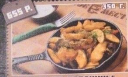
ЖАРКОЕ ИЗ БАРАНИНЫ!