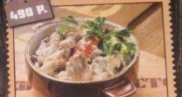
«ЛУЖАЙКА» свинина, куриное филе и телешина, томленые в соусе с грибами опятами