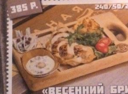
«ВЕСЕННИЙ БРИЗ» фаршированная грибами куриная грудка с картофельным пюре и домашней аджикой