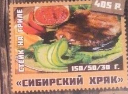
«СИБИРСКИЙ ХРЯК» 150/50/30 Г.