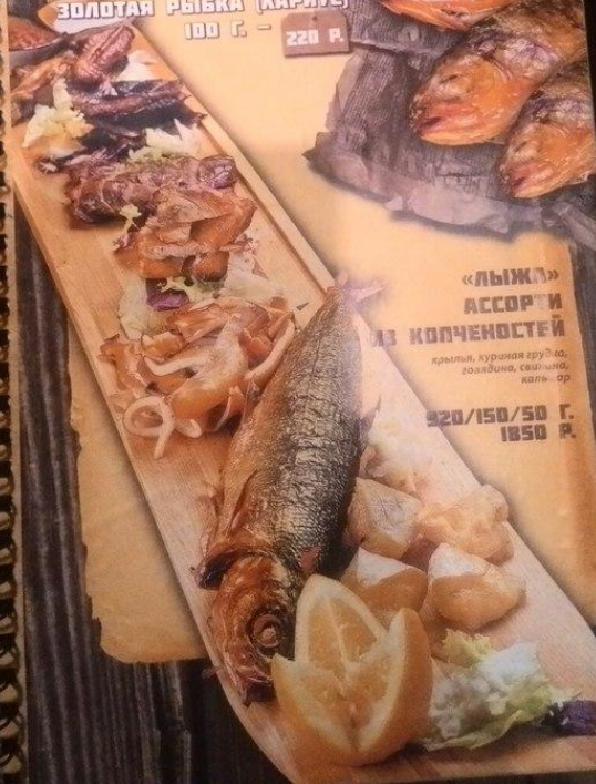
«ЛЫЖА» АССОРТИ ИЗ КОПЧЕНОСТЕЙ кряквя, куриная грудка, говядина, свиная, кальмар 320/150/50 Г. 1850 Р.