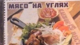
СВИНИНА - 100 Г.