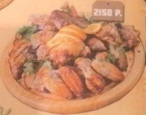
МЯСНОЙ ПИР 750/160/100 Г.