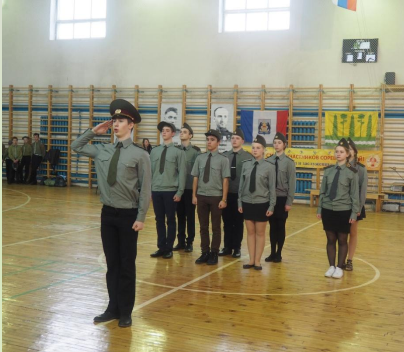
Военно-спортивная игра «К защите Родины готовы»