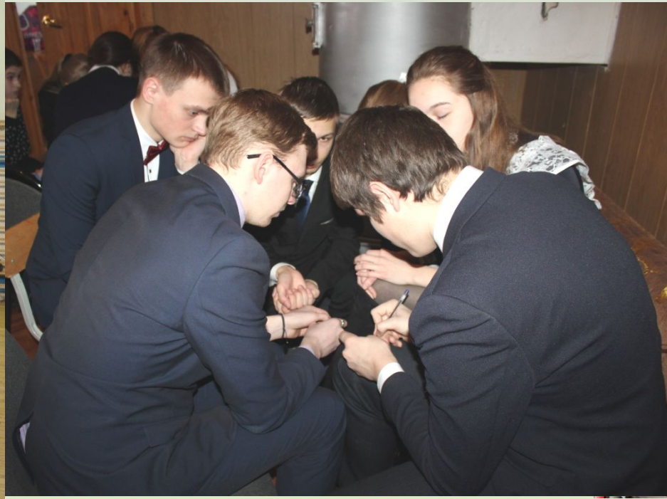
Что? Где? Когда?