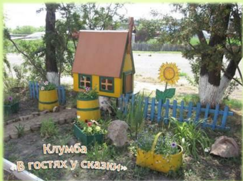
Клумба «В гостях у сказки»