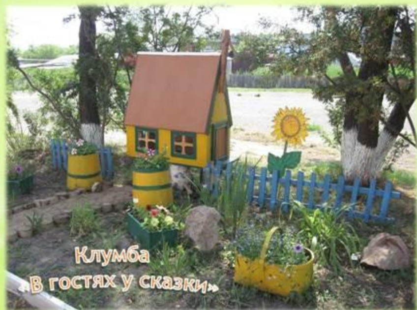
Клумба «В гостях у сказки»