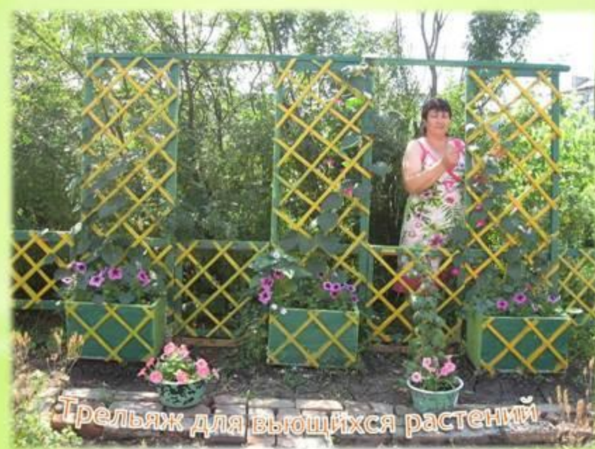
Трельяж для вьющихся растений