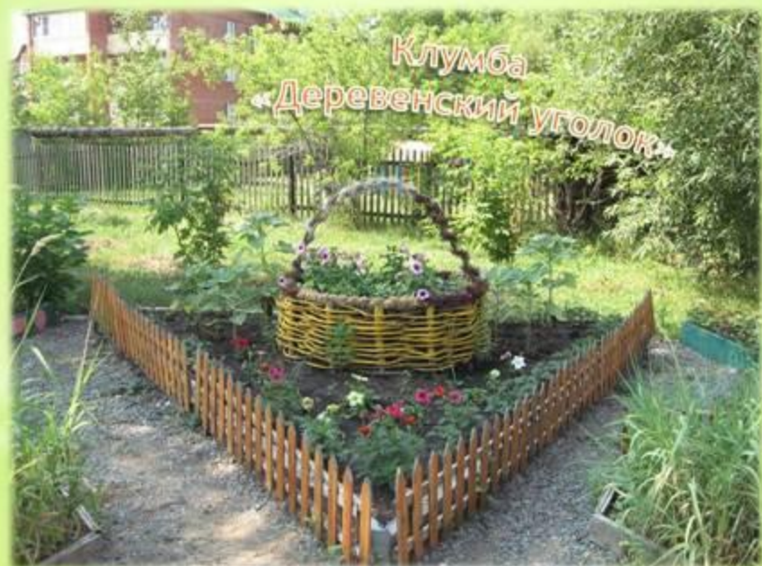
Клумба «Деревенский уголок»