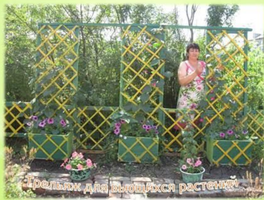
Трельяж для вьющихся растений