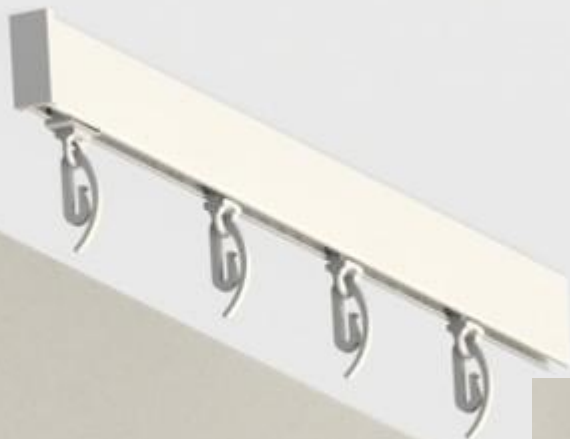
СТ - 412001