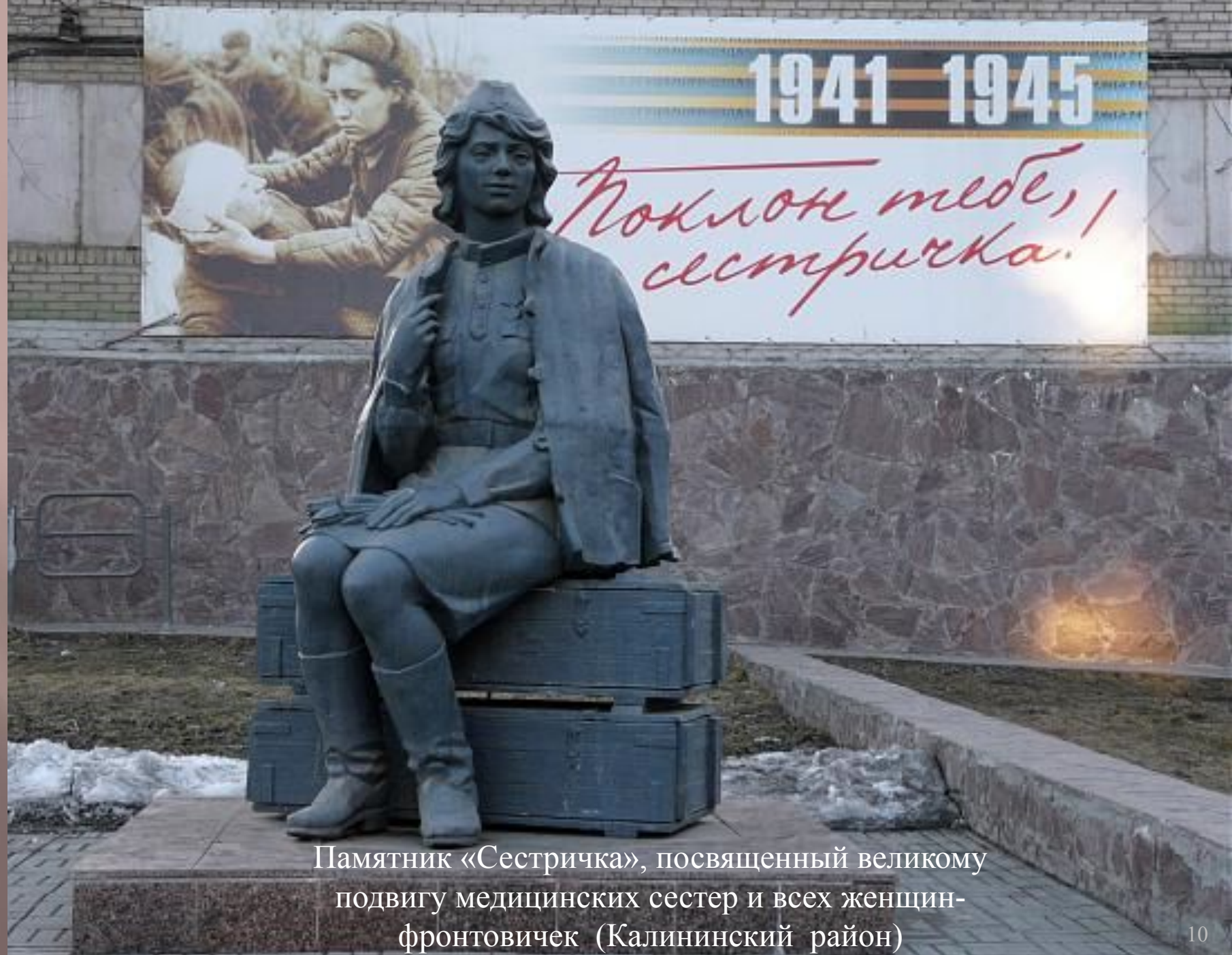
Памятник «Сестричка», посвященный великому подвигу медицинских сестер и всех женщин-фронтовичек (Калининский район)