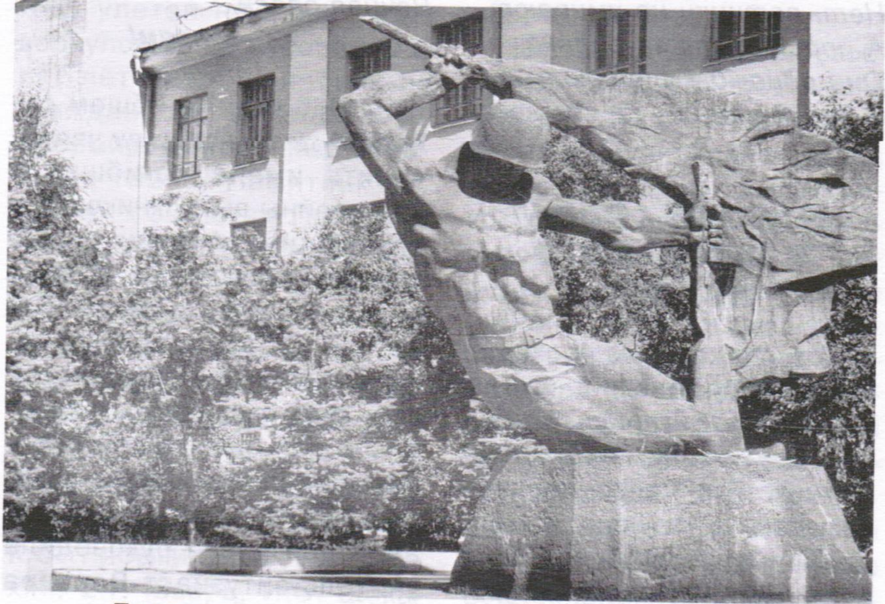
Памятник выпускникам челябинской школы №1, погибшим в период Великой Отечественной войны (Центральный район)