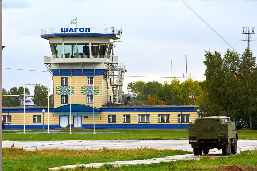
Авиабазы «Шагол» (в период ВОВ ЧВАСБ), фото от 4.04.2014 – экскурсия учащихся МБОУ СОШ № 137 в музей и на аэродром