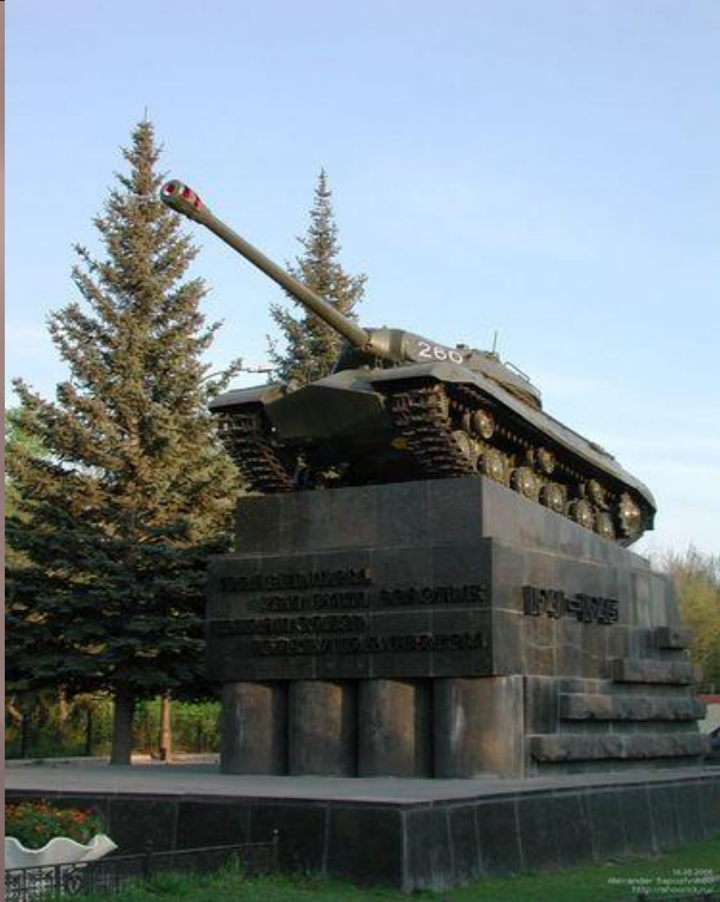
Танк ИС-3 труженикам тыла на Комсомольской площади (Район ЧТЗ)