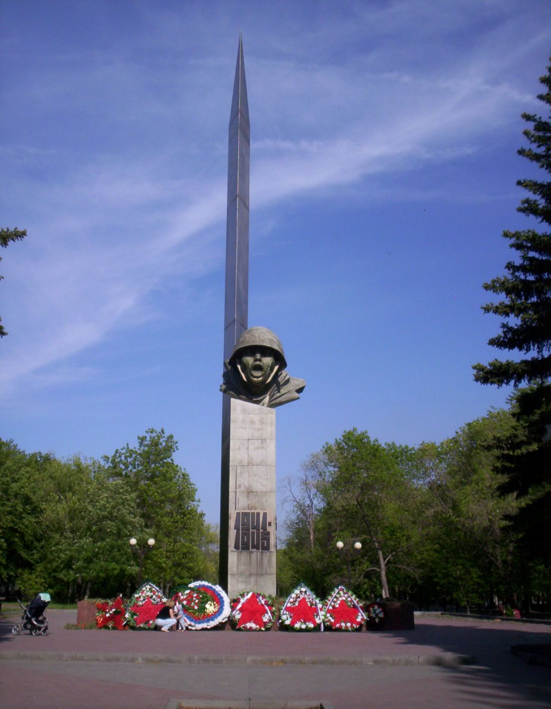
Сквер Победы (Металлургический район)