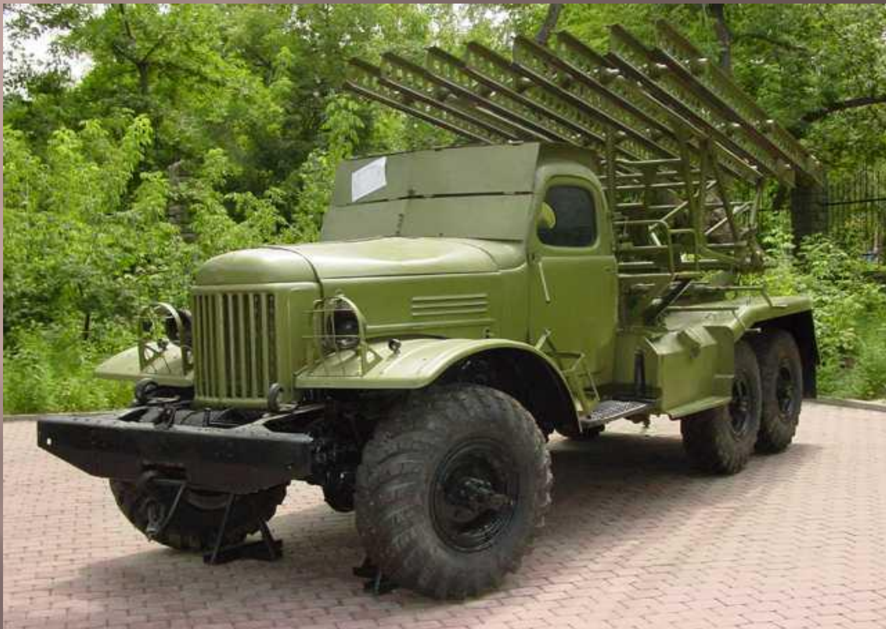
«Катюша» - памятник на ул. Доватора возле дома культуры завода им. Колющенко (Советский район)