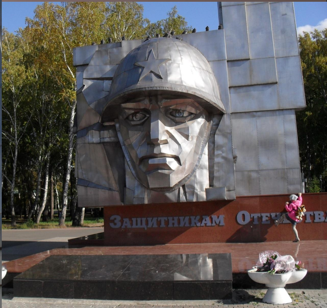
Монумент Славы в саду Победы (Район ЧТЗ)