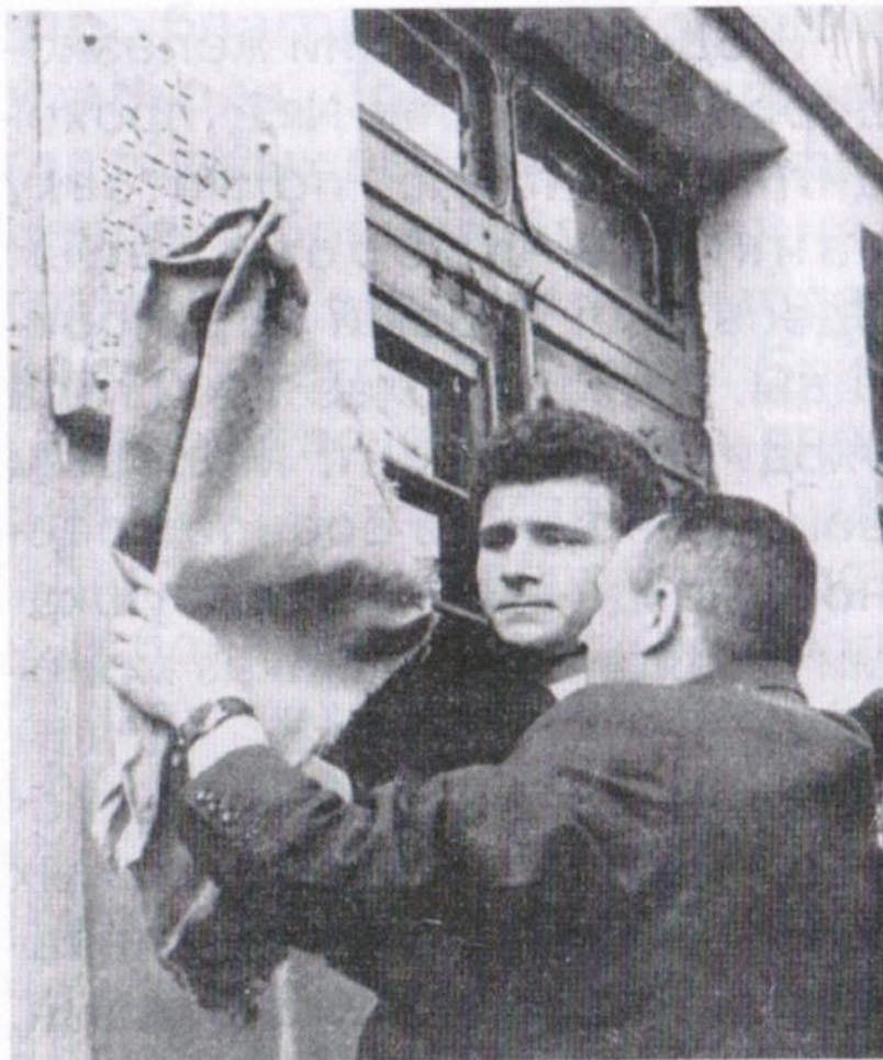
Открытие мемориальной доски на здании школы № 2 ЮУЖД, посвященной 96-й добровольной танковой бригаде имени Челябинского комсомола (Центральный район)