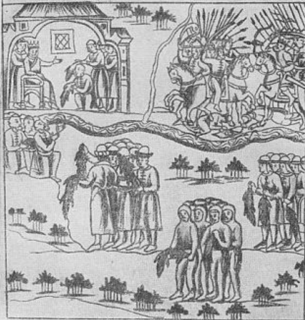
Кучум принимает дань в городе Сибири (рисунок из Кунгурской летописи XVII в.).

Въ августѣ Царь Романовъ Шко. оумалъ побѣднѣ Ингуитѣ рѣши събити въ Сибирѣ мѣстѣ Урѣмскѣ. Царю Романову. Романовичу. Писани Урѣмскѣ. Исполнѣнаго сего днѣ Золотомъ (Сибирѣ) мѣстѣ Мѣланинѣмъ. История. Побѣднѣмъ.