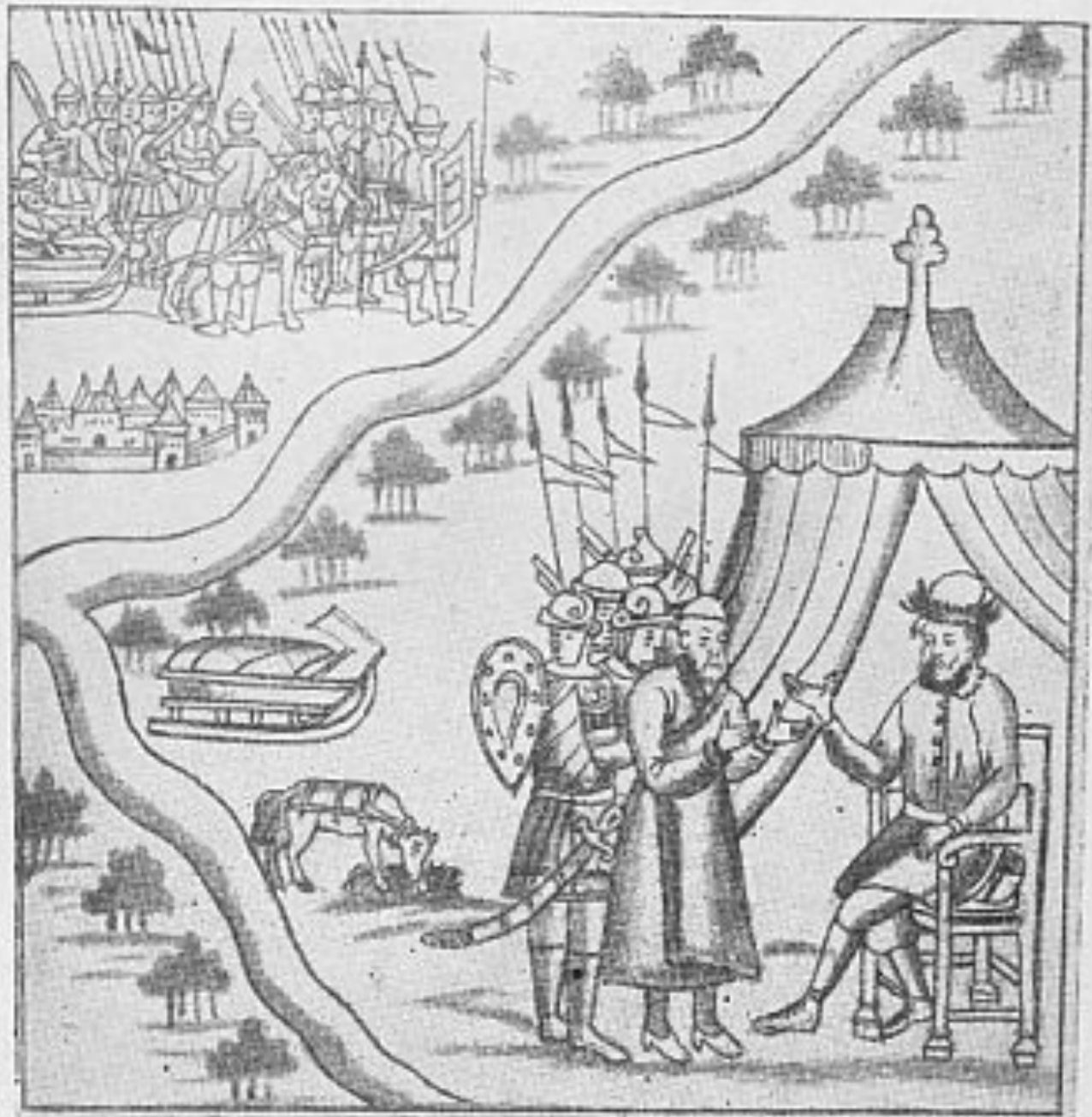
Прием Ермаком знатного татарина (из Кунгурской летописи ).