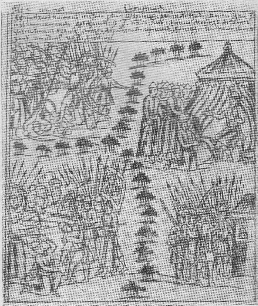
Ермак у реки Тагил (из Кунгурской летописи).