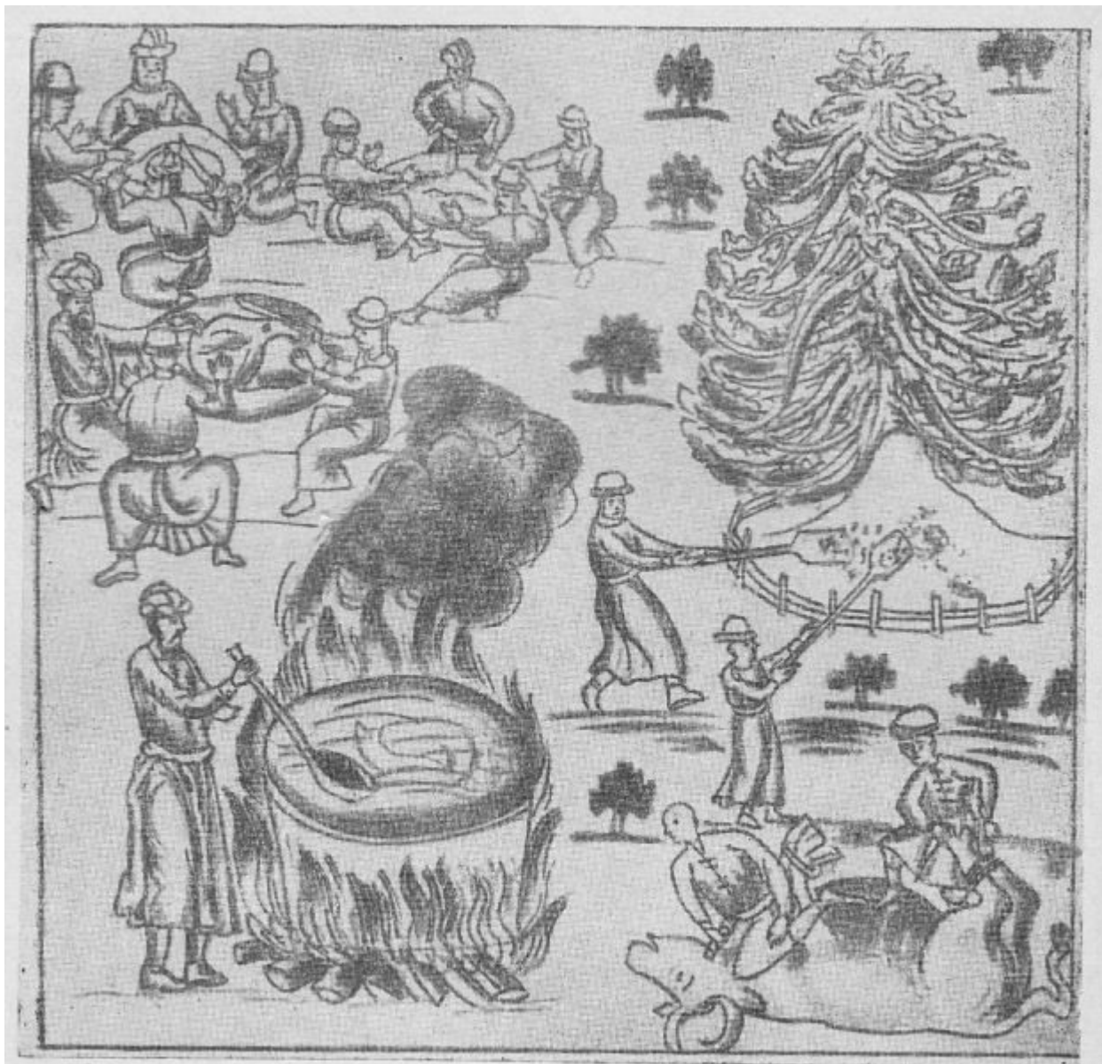
Погребальный пир по Ермаку (из Кунгурской летописи ).