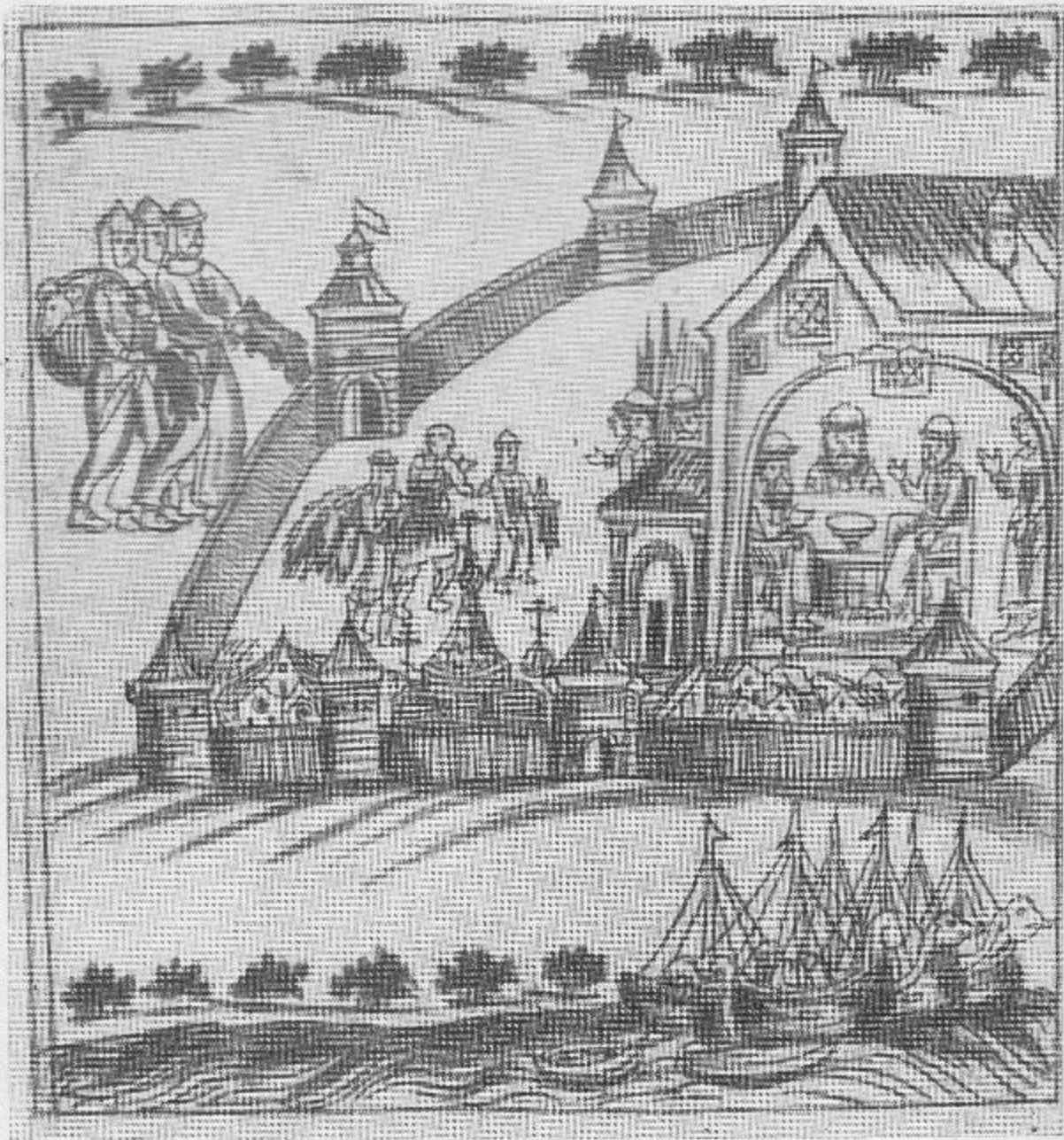
Тюмень (из Кунгурской летописи).