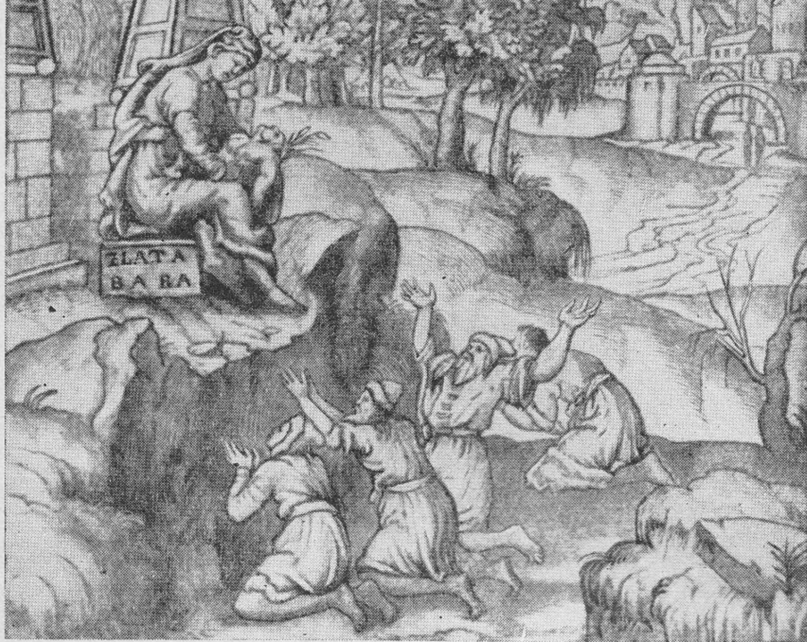
Золотая баба (рисунок XVI в.).