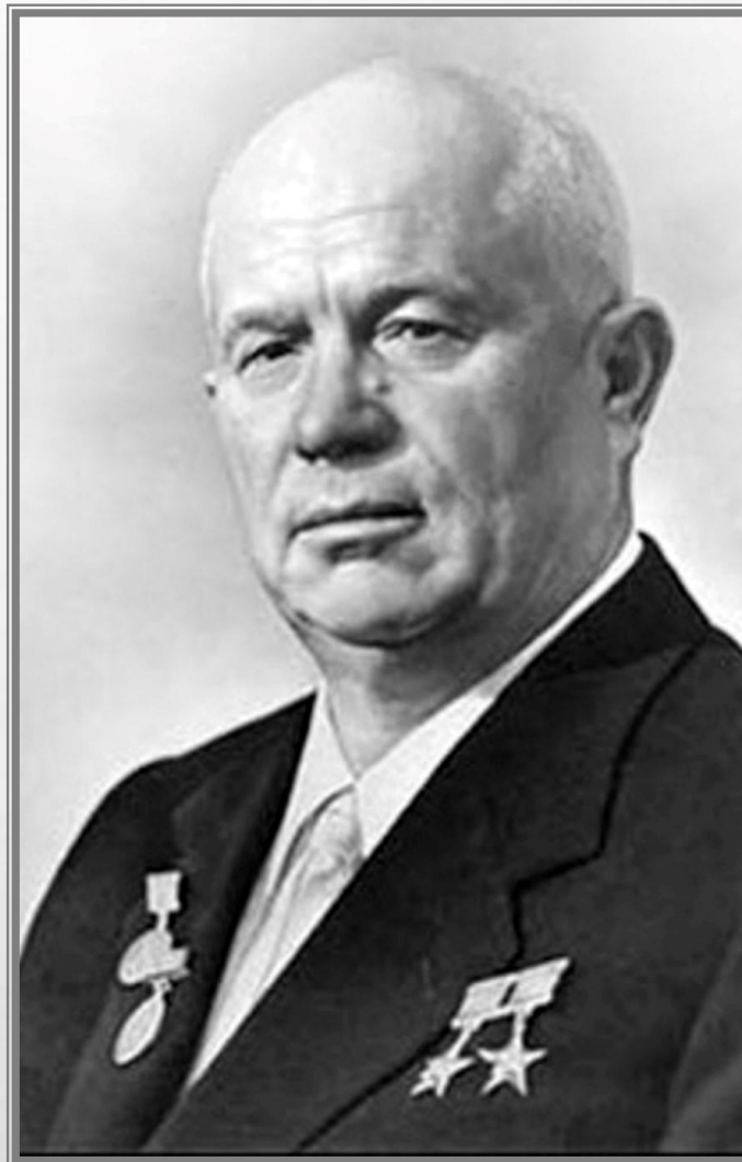
Микита Сергійович Хрущов

У 1977 РОЦІ, КОЛИ ВЖЕ ПІШОВ У ВІДСТАВКУ І МИКОЛА ПІДГОРНИЙ, ВОНИ ЗУСТРІЛИСЯ З БАТЬКОМ. "ПОМИЛИЛИСЯ МИ, ПЕТРЕ", - ГОВОРИВ ПІДГОРНИЙ, НА ЩО БАТЬКО РОЗВОДИВ РУКАМИ, МОВЛЯВ, "ЦЕ Ж ТИ МЕНІ ПОРАДИВ". ПЕРЕД СМЕРТЮ, В ОСТАННІ ТИЖНІ ЖИТТЯ, ВІН ЧАСТО ЗГАДУВАВ ПРО ЦЕ. Я БУВ БІЛЯ НЬОГО В ЛІКАРНІ В ОСТАННІ ДНІ І ВІН, ВЖЕ БУДУЧИ В МАРЕННІ, ПОВТОРЮВАВ: " НЕ ЧІПАЙТЕ МИКИТУ СЕРГІЙОВИЧА " ».