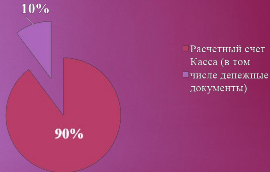
Структура денежных средств ООО «Эко Пласт» за 2020 год