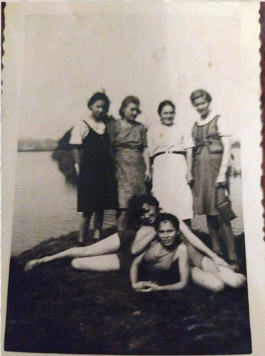
фото город Менден на реке фототради- ционные были уже 17 лет Нина Васильев- на Ана. Шу- мова. Ни- на. Ша- рина.