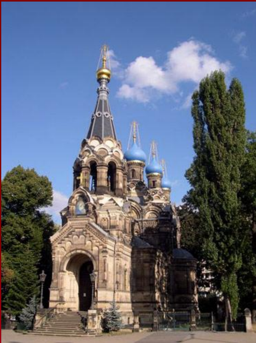
Русская церковь в Дрездене