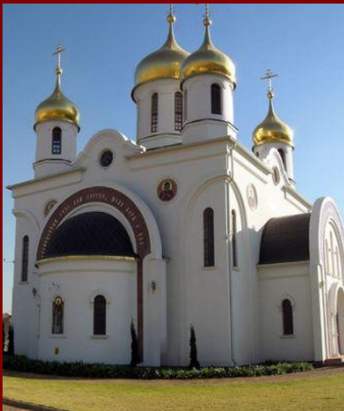
Православная церковь в городе Таллин