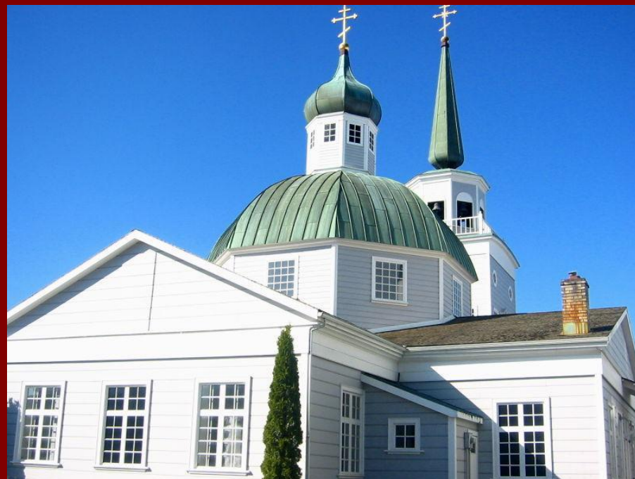
Русская Православная церковь в Ситке