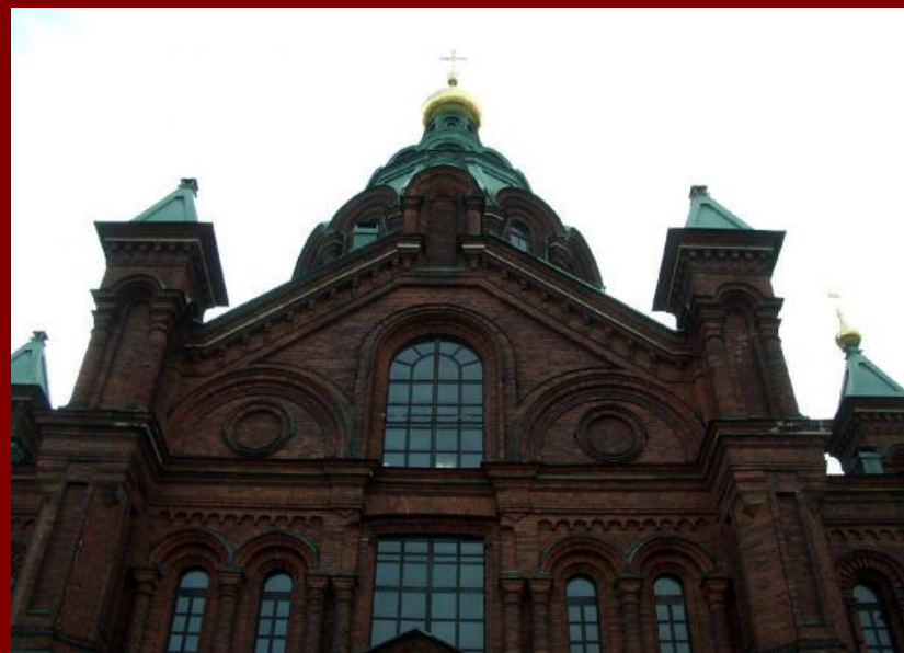
Православная церковь в Хельсинки