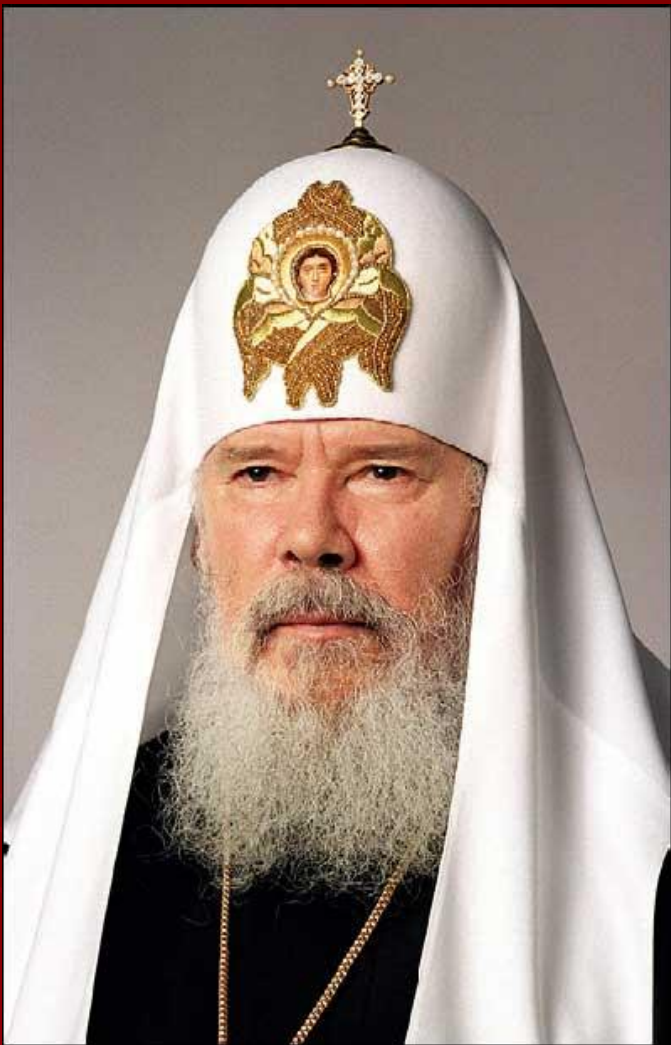
Алексий II (Алексей Михайлович Ридигер; 10 июня 1990 (интронизация) – 5 декабря 2008)