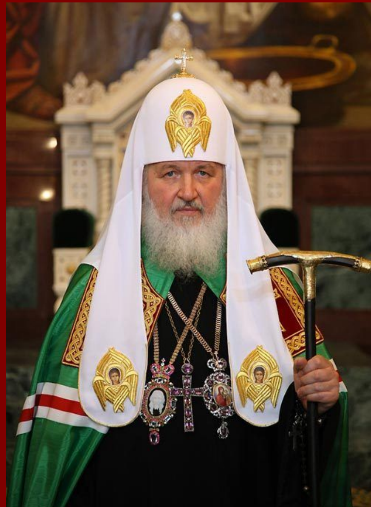
Кирилл (Владимир Михайлович Гундяев; 1 февраля 2009 г. (интронизация))