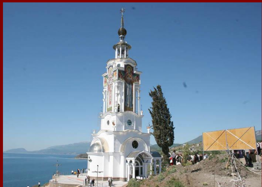
Православные церкви на Украине