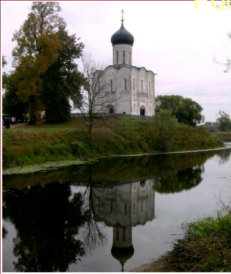
Церковь Покрова на Нерли, Боголюбovo Владимир