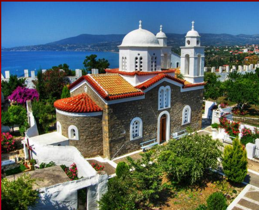
Православная церковь в Греции