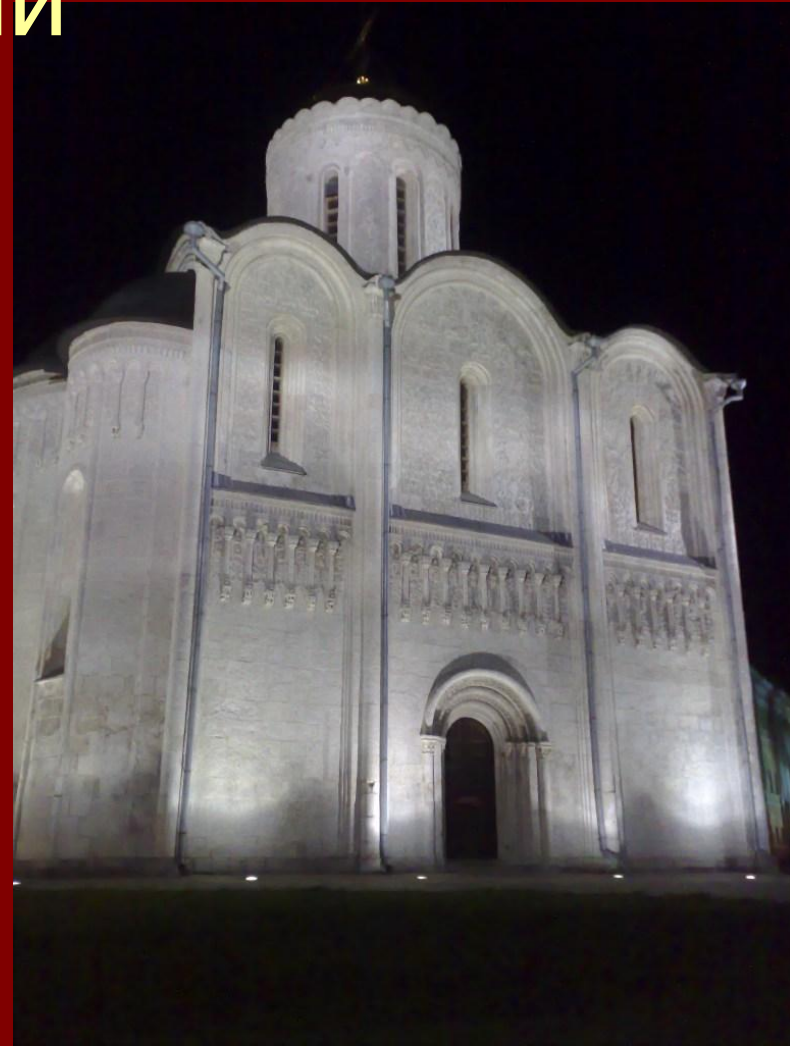
Дмитриевский собор, Владимир