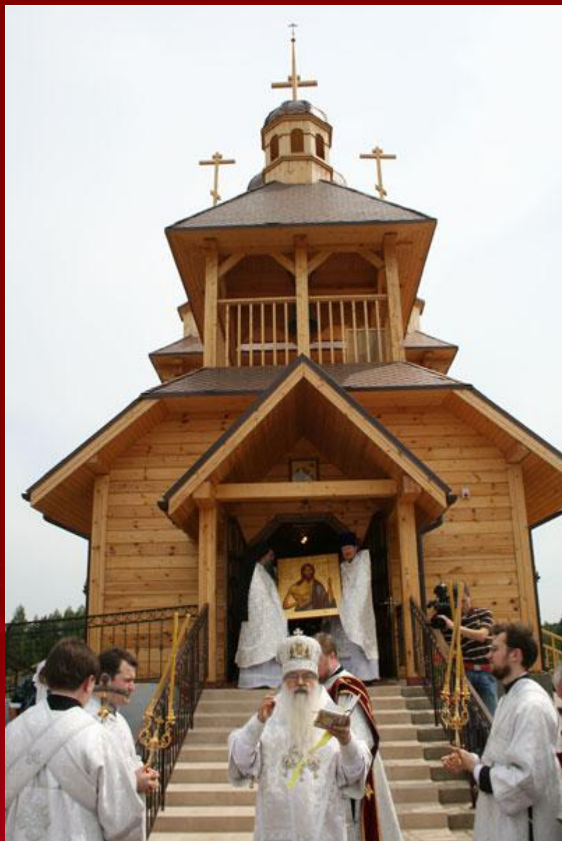
Православная церковь в Белоруссии