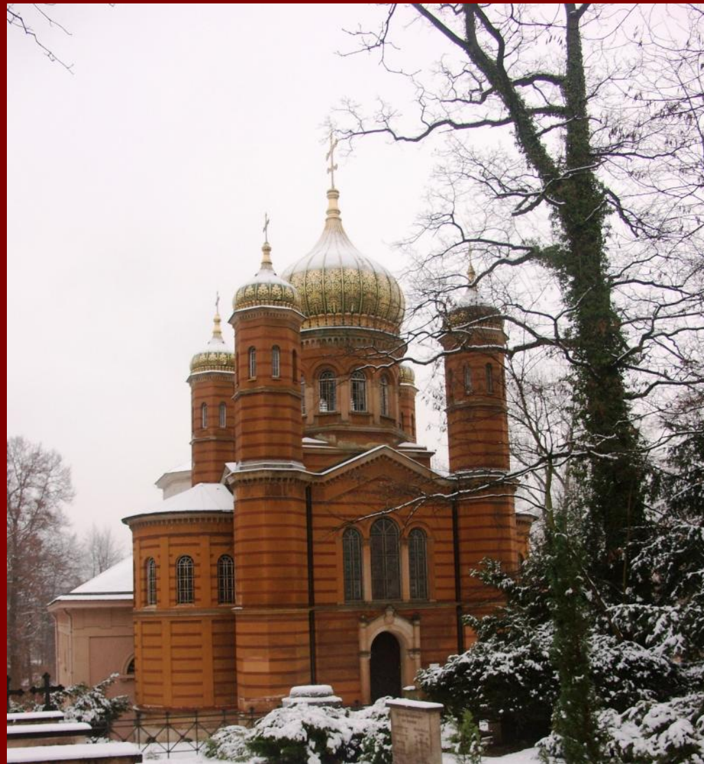
Православная церковь, Веймар