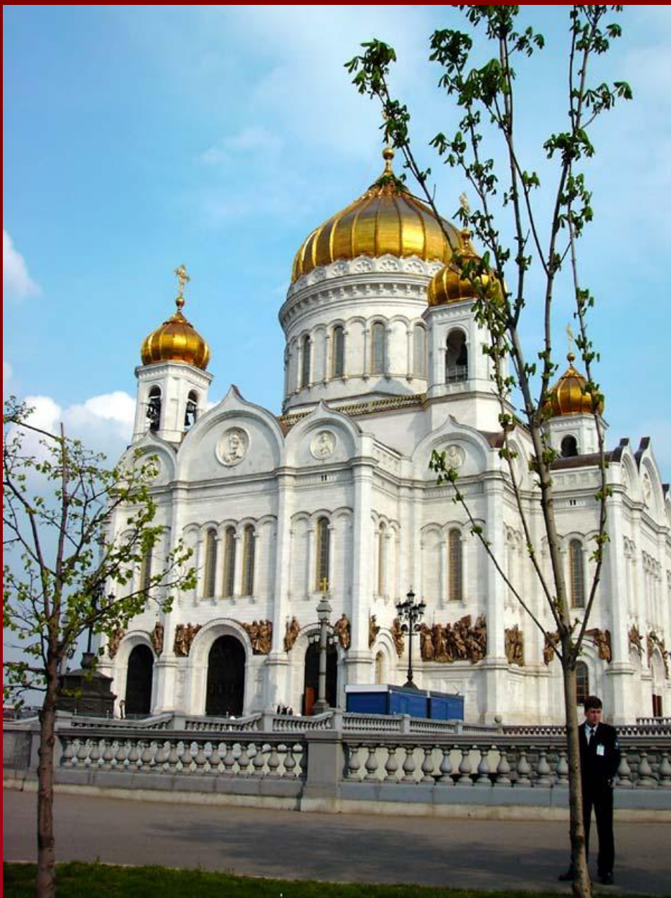
Русская Православная церковь в Америке