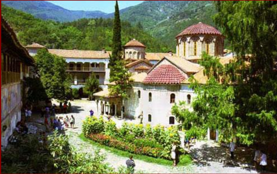
Болгарская Православная церковь