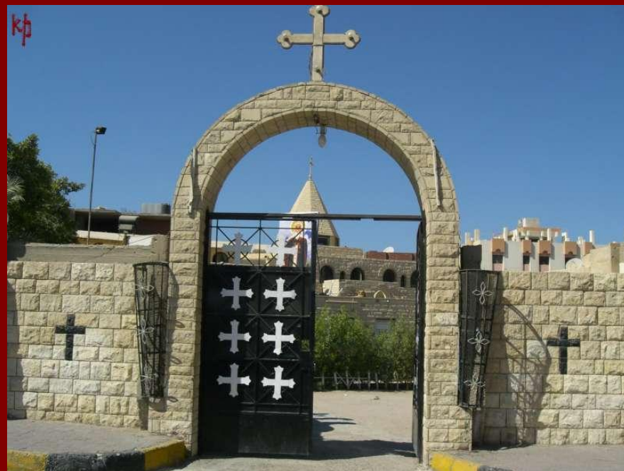
Православная церковь в Хургаде