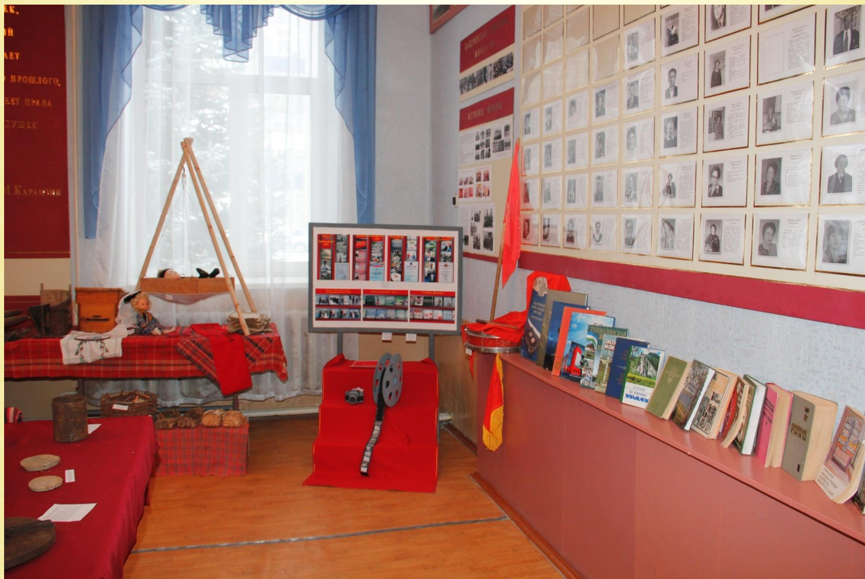
Музей в школе №1 с.Кандры