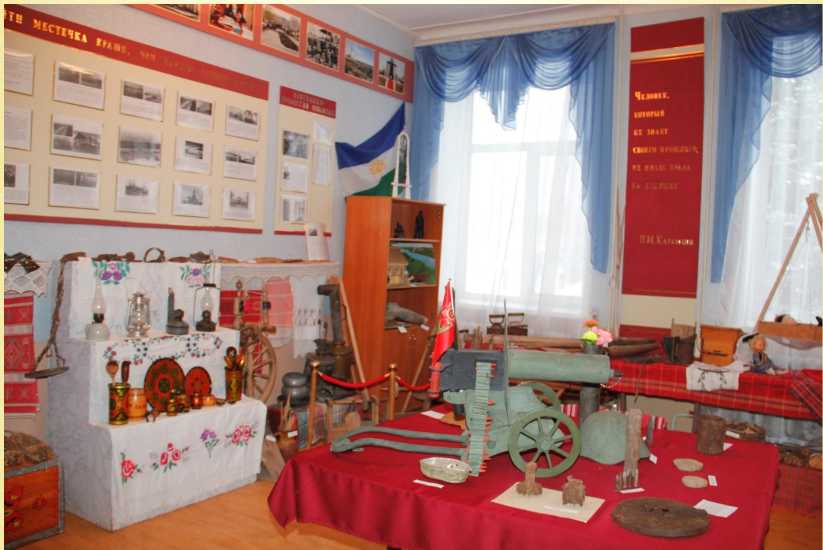
Музей в школе №1 с.Кандры