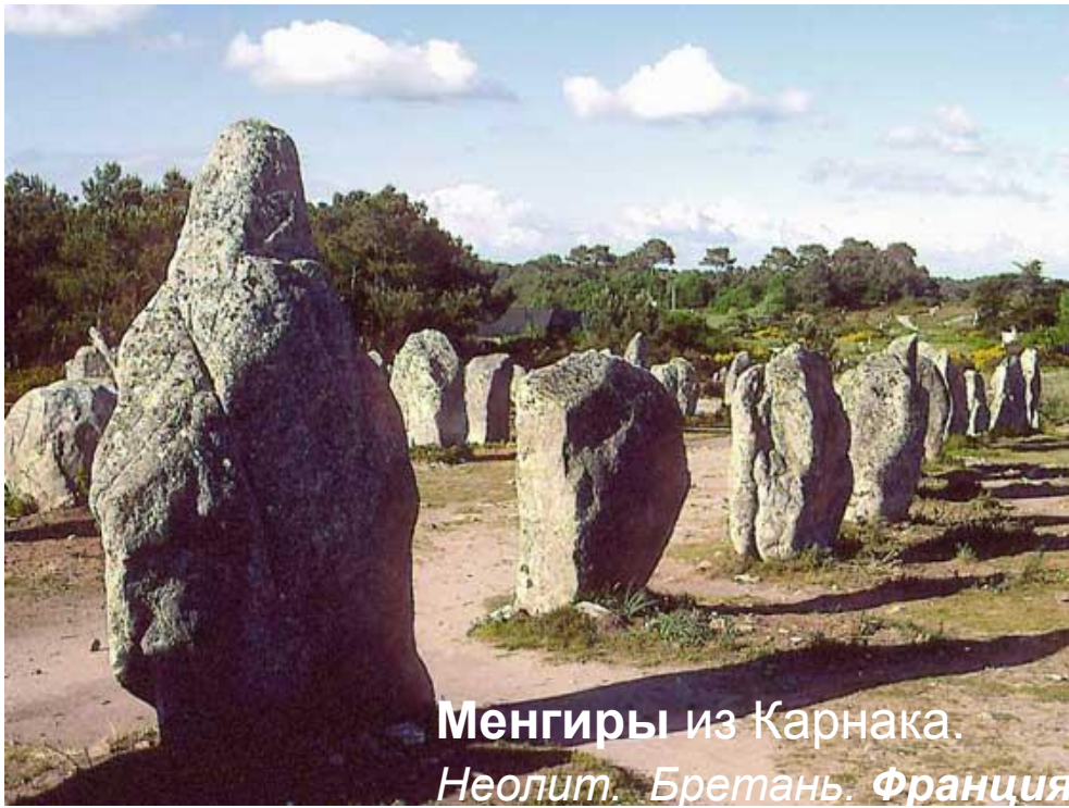
Менгиры из Карнака. Неолит. Бретань. Франция