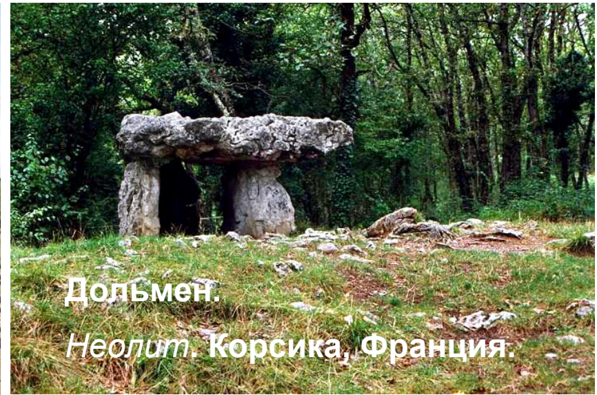
Дольмен. Неолит. Корсика, Франция.