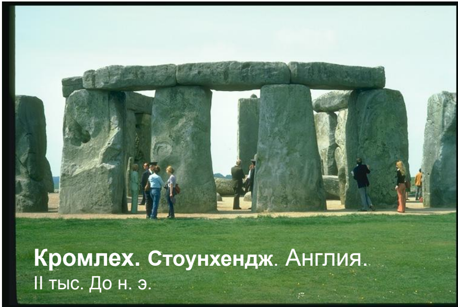
Кромлех. Стоунхендж. Англия. II тыс. До н. э.

Менгиры - вертикально стоящие камни, высотой более 2-х метров.