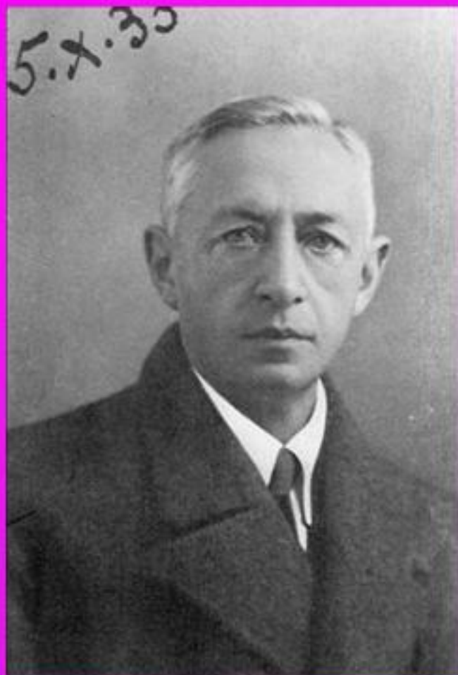
И.Бунин. 1933 г.