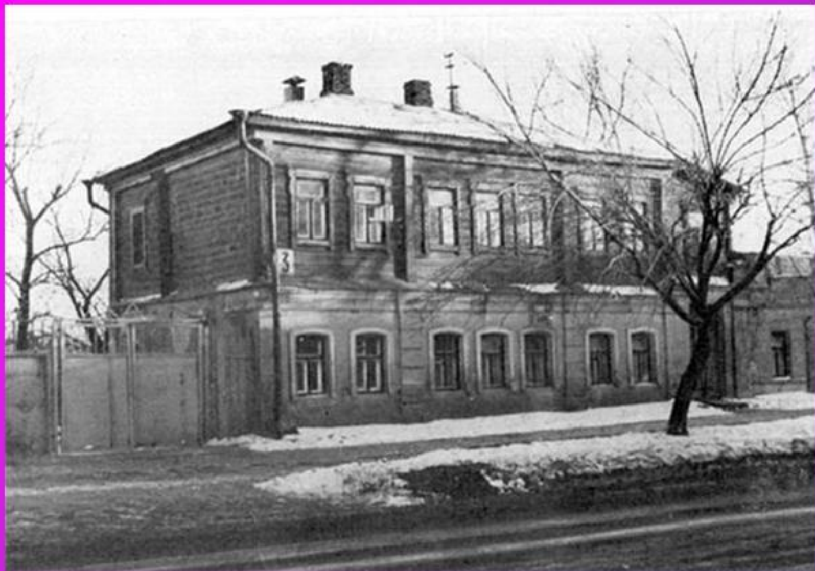
Воронеж. Дом, в котором родился И.А.Бунин. Детство и юность прошли в фамильном имении в Орловской губернии