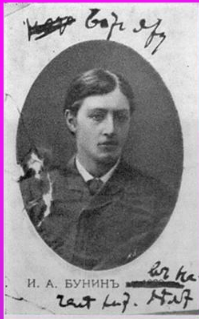
И.А.Бунин. 1889 г.

В 1886 г. И.Бунин уходит из гимназии, в дальнейшем занимается самообразованием под руководством старшего брата