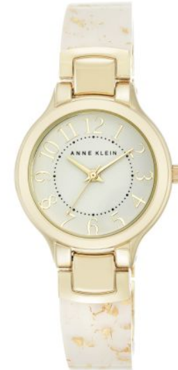
AK-2380WTGB PPЦ 8560р.