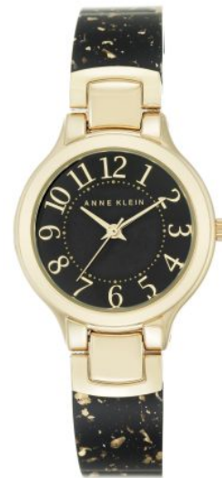
AK-2380RGLP PPЦ 8560р.