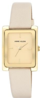
AK-2706CHIV PPЦ 8560р.