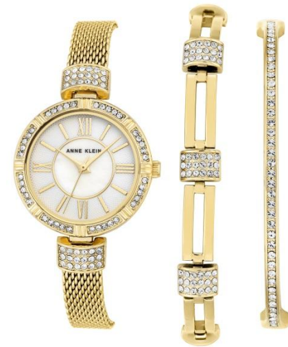
Ref. AK-2844GBST PPЦ 19 840р.