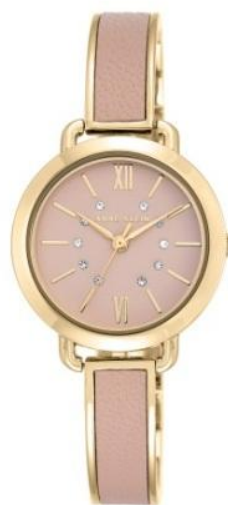
AK-2436LPGB PPЦ 8560р.