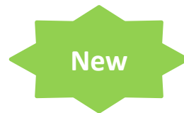
AK-2790CMWT PPЦ 8560р.