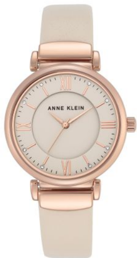
AK-2666RGIV PPЦ 8560р.