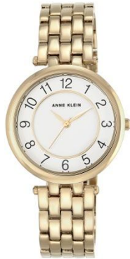
AK-2700WTGB PPЦ 8 560р.