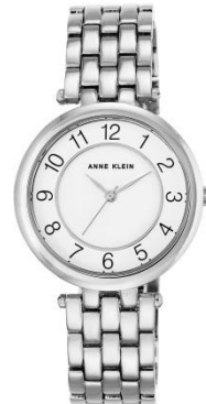
AK-2701WTSV PPЦ 8 080р.