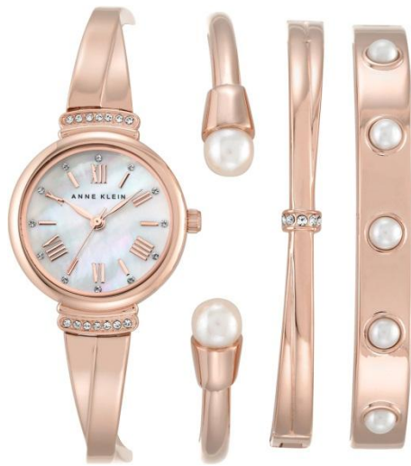
Ref. AK-2372RGST PPЦ 23 120р.