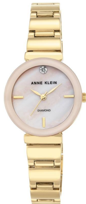
AK-2434PMGB PPЦ 9 920р.