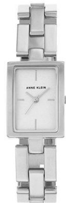
AK-2639SVSV PPЦ 11 760р.

Коллекция «Ring» включает в себя как сеты-наборы часов и браслетов, так и классические модели на металлическ их браслетах.