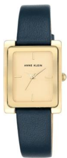
AK-2706CHBL PPЦ 8560р.

Часы из коллекции DAILY подойдут в качестве аксессуара на каждый день. Отлично дополняют образ любого стилевого направления в одежде.