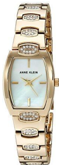
AK-2784MPGB PPЦ 12 560р.