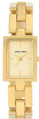
AK-2638CHGB PPЦ 12 560р.