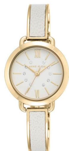
AK-2436WTGB PPЦ 8560р.