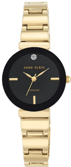
AK-2434BKGB PPЦ 9 920р.