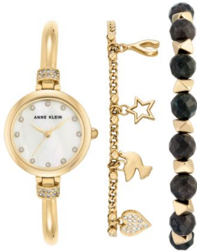
Ref. AK-2840LBDT PPЦ 19 840р.