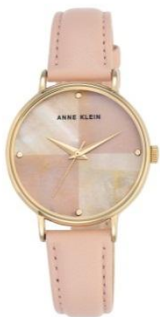
AK-2790PMPK PPЦ 8560р.