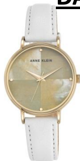
AK-2790CMWT PPЦ 8560р.