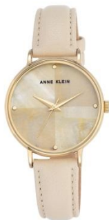
AK-2790IMIV PPЦ 8560р.