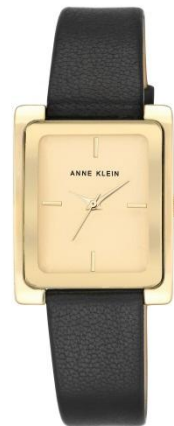
AK-2706CHBK PPЦ 8560р.