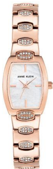
AK-2784MPRG PPЦ 12 560р.