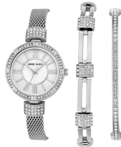
Ref. AK-2845SVST PPЦ 19 840р.