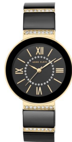
AK-2832WTGB PPЦ 16 480р.