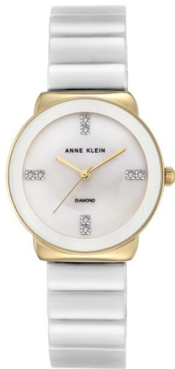
AK-2714WTGB PPЦ 16 480р.