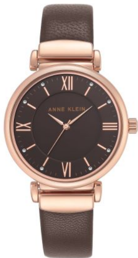
AK-2666RGBN PPЦ 8560р.