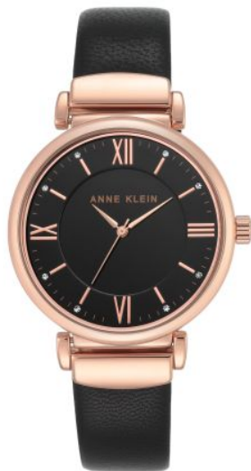
AK-2666CHGB PPЦ 8560р.