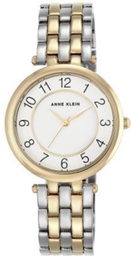
AK-2701WTTT PPЦ 8 320р.