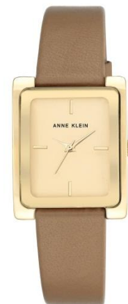
AK-2706CHDT PPЦ 8560р.