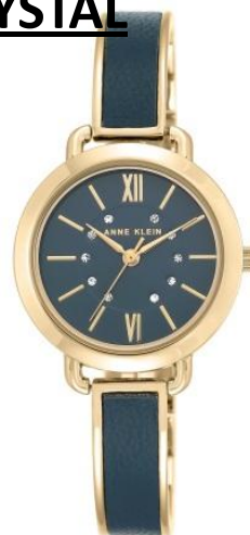
AK-2436BLGB PPЦ 8560р.