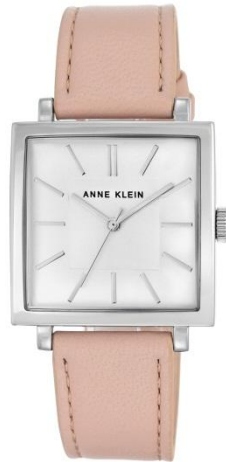
AK-2736SVLP PPЦ 8560р.