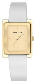
AK-2706CHWT PPЦ 8560р.