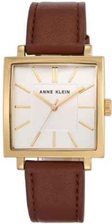
AK-2736SVHY PPЦ 8560р.