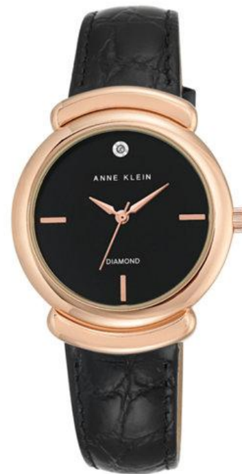
AK-2358RGBK PPЦ 8560р.