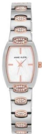
AK-2785MPRT PPЦ 12 160р.