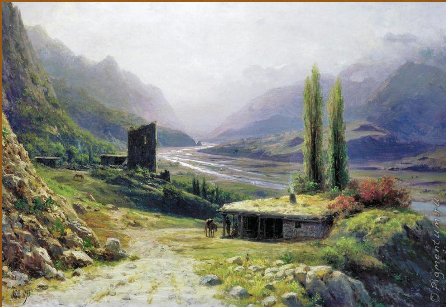
Русский художник КОНДРАТЕНКО ГАВРИИЛ ПАВЛОВИЧ Крымский пейзаж с саклей