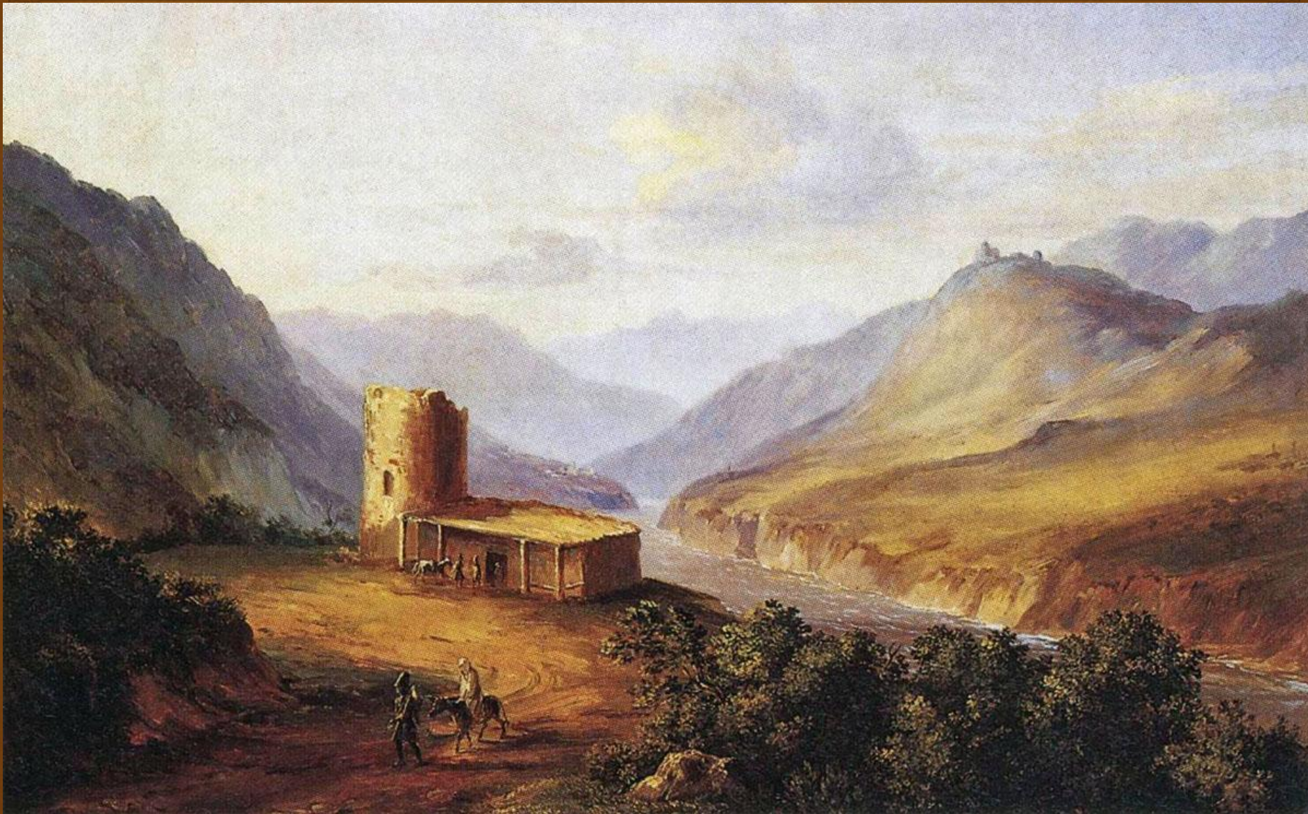
Кавказский вид с саклей. 1837 год Картина Михаила Юрьевича Лермонтова. Картон, масло.