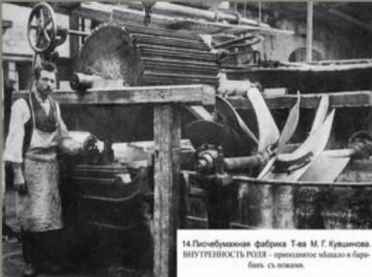
14. Писчебумажная фабрика Т-ва М. Г. Кутшанова. ВНУТРЕННОСТЬ РОССИИ – природный мшиало и бор- бать сь лжками.