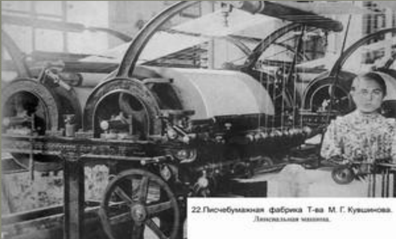
22. Писчебумажная фабрика Т-ва М. Г. Кушениова. Линовальная машина.