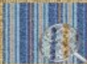
Определение лицевой и изнаночной стороны ткани