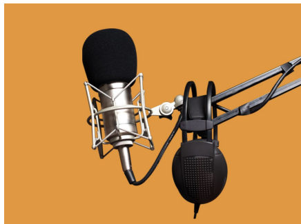
Продвижение через СМИ