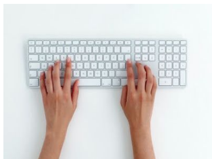
Удаленная редакция корпоративного медиа