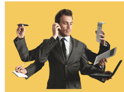
Информационное сопровождение бизнеса