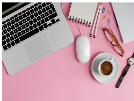
Удаленная пресс- служба 24/7