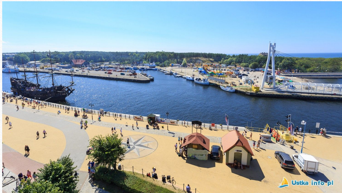
Promenada nadmorska w Ustce