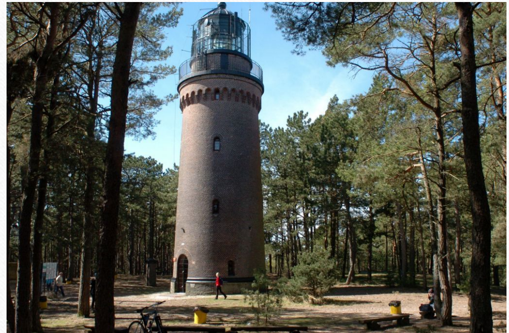
Latarnia morska w Czółpinie (koło Rowów)