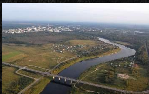
С каждым годом Кингисепп растёт и становится красивее

Население по переписи 1927 года - 22 019 человек