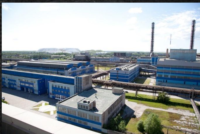
ПГ «Фосфорит» ООО «Еврохим»

Увеличение населения города и района На 57 080 человек (более, чем в 3 раза) за последние 90 лет связано с развитием промышленной и транспортной структур. В город и район приезжают новые люди, чтобы работать в порту и в ООО «Еврохим»