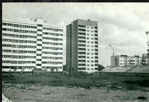
Первый 12 этажный дом Построен в 1978 году