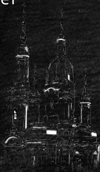
Фото из домашнего Архива и интернет

https://wiki2.org/ru/Кингисеппский_район