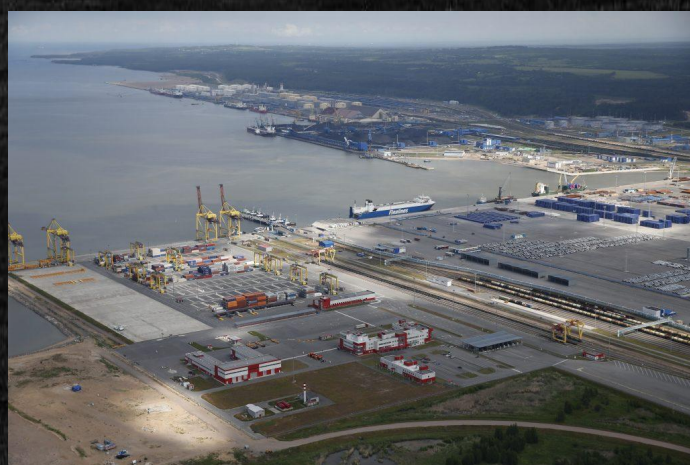
порт «Усть Луга»