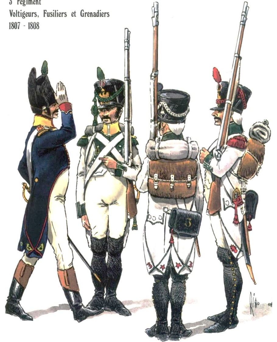
3 e régiment Voltigeurs, Fusiliers et Grenadiers 1807 - 1808

Más de 20.000 soldados franceses entraron en España en noviembre de 1807 con el objetivo de ayudar al ejército español para atacar Portugal