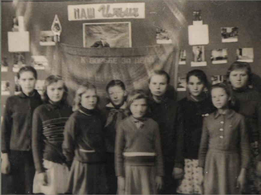
Пионерская организация школы, 1964г.