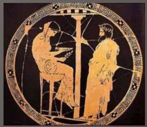
Пророчествующая пифия и оракул