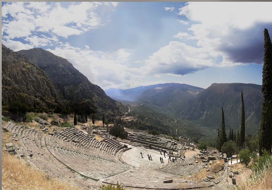
Амфитеатр, где проходили музыкальные и философские соревнования

Стадион для соревнований атлетов и гонок квадриг.