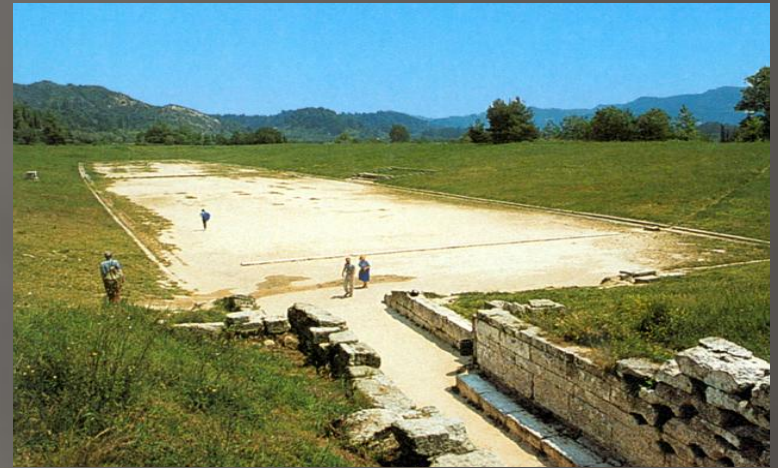
Стадион в Олимпии сегодня