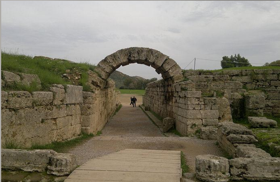
Сохранившийся Вход на стадион