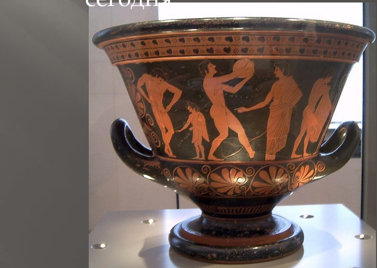
Разалины Палестры - школы обучения атлетов и Кратер с изображение