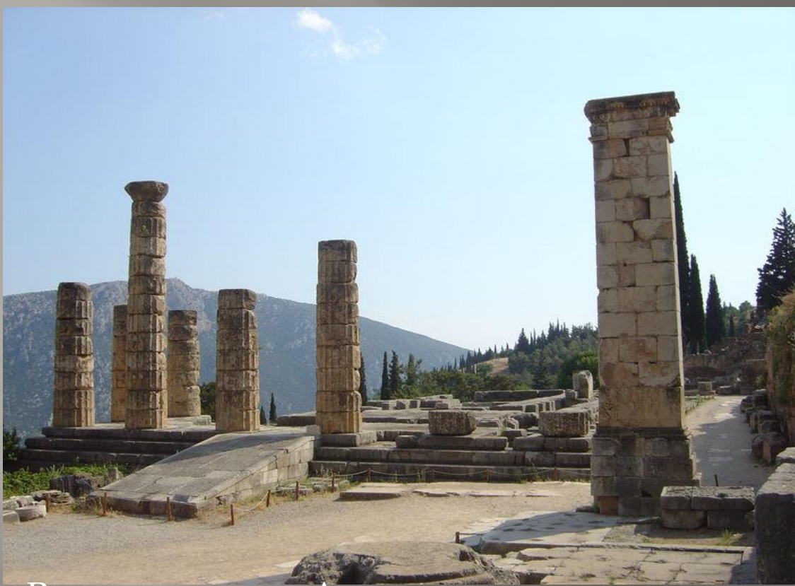
Развалины храма Аполлона в Дельфах