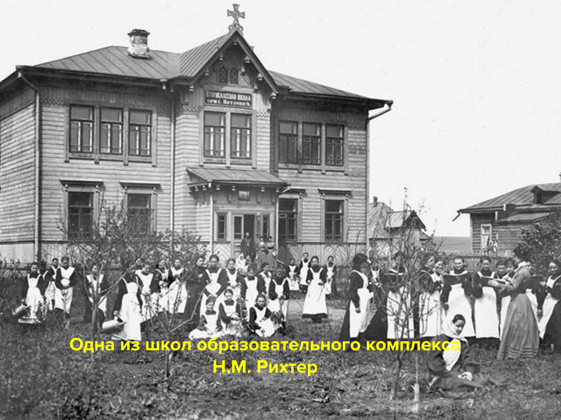
Одна из школ образовательного комплекса Н.М. Рихтер