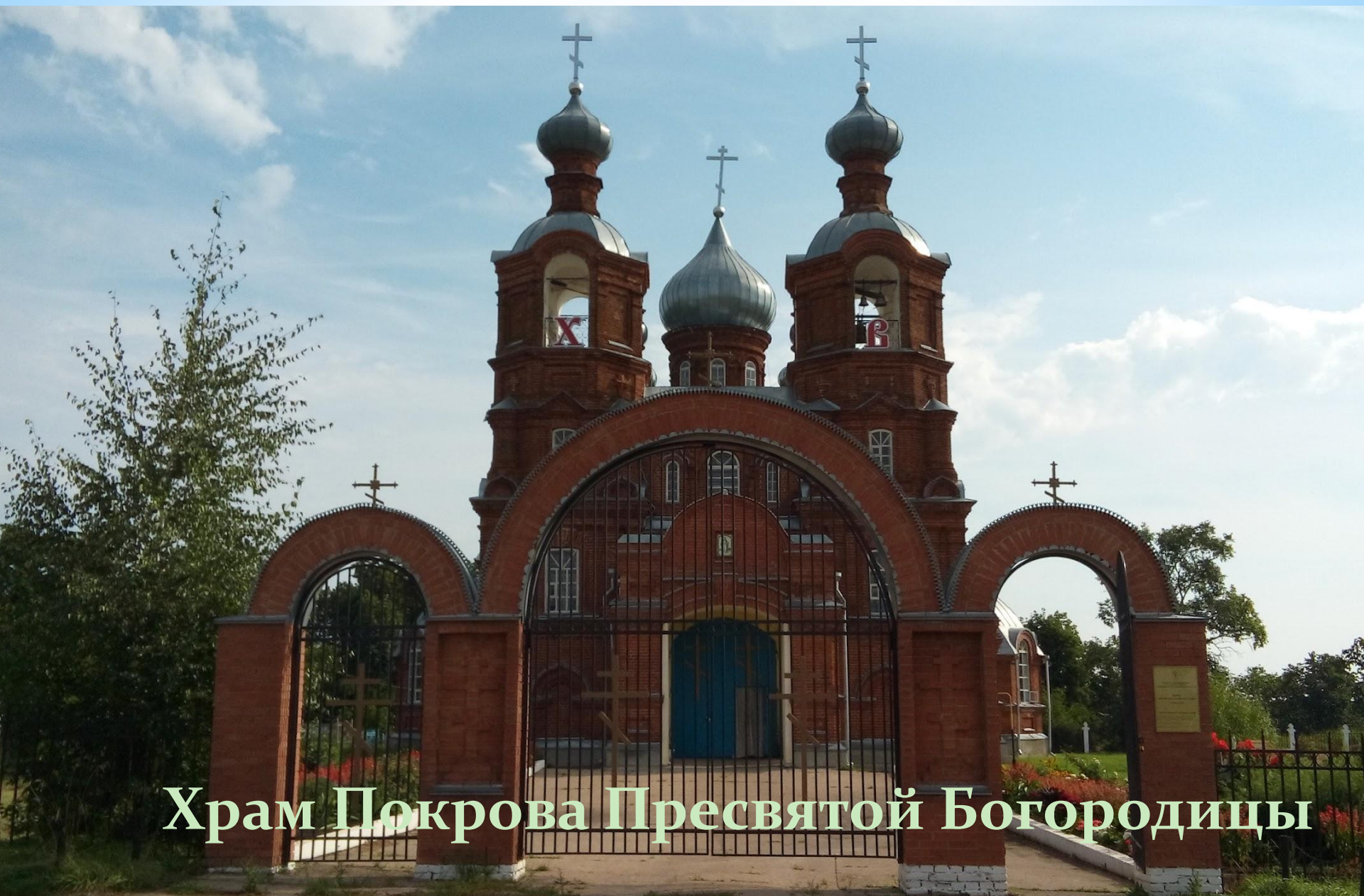
Храм Покрова Пресвятой Богородицы