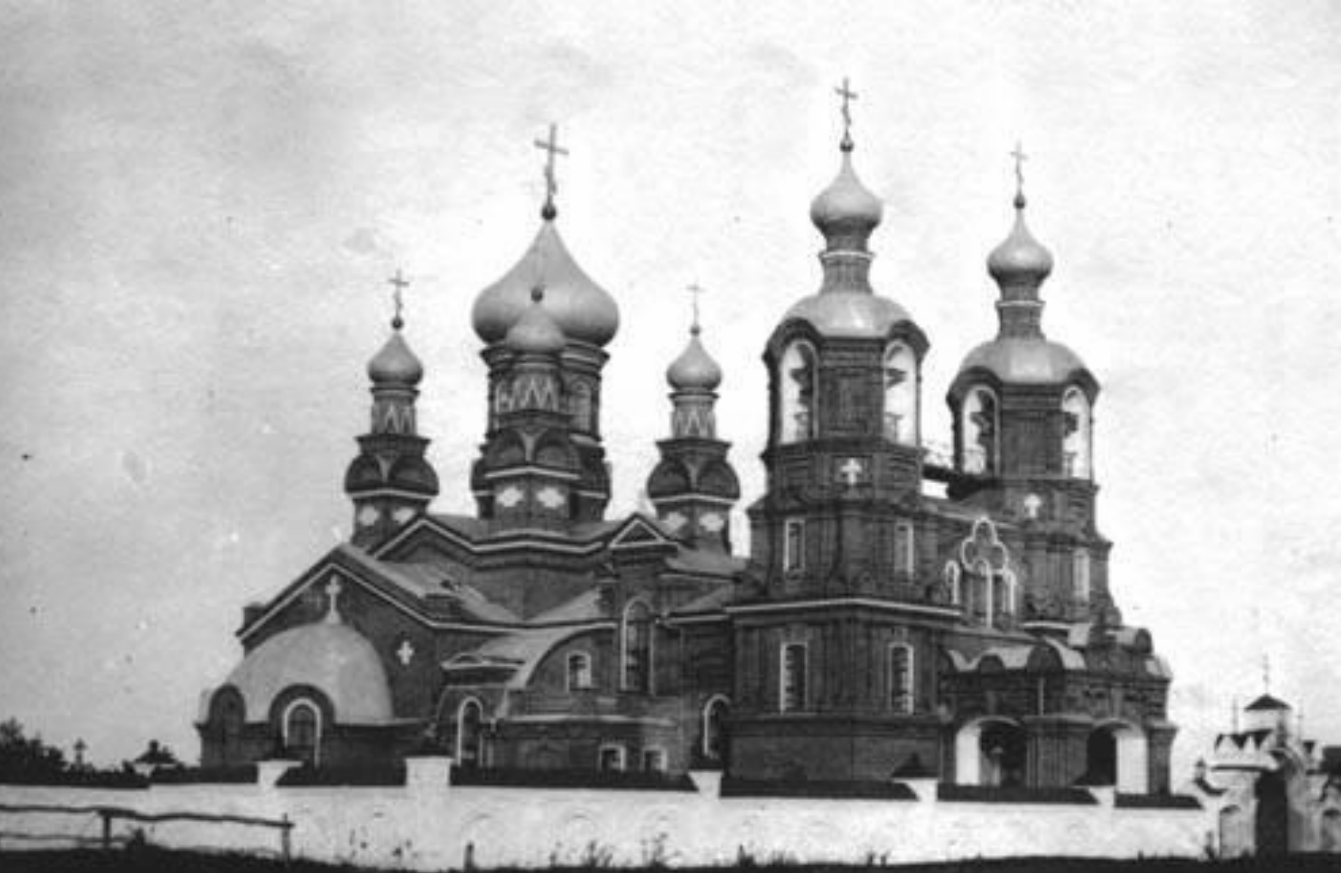
Первоначальный вид церкви 1898 г.