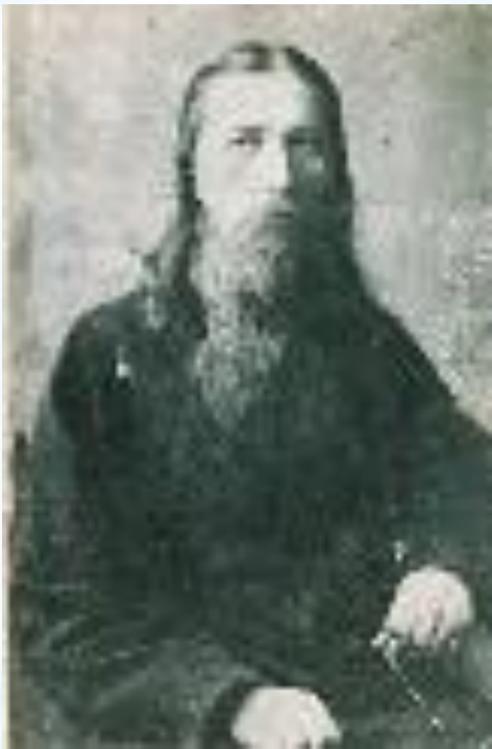
Блаженный старец Иоанн Оленевский