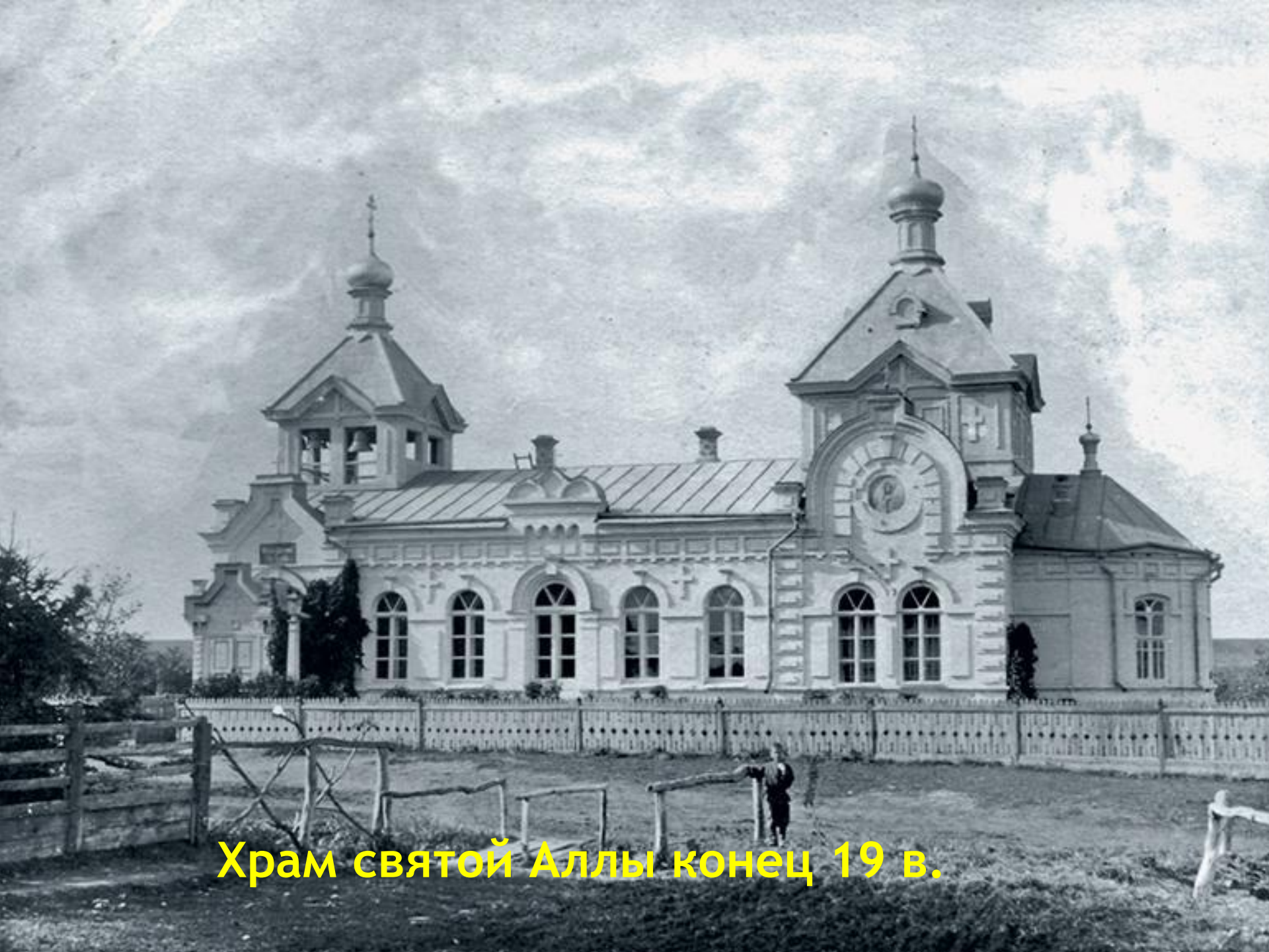
Храм святой Аллы конец 19 в.