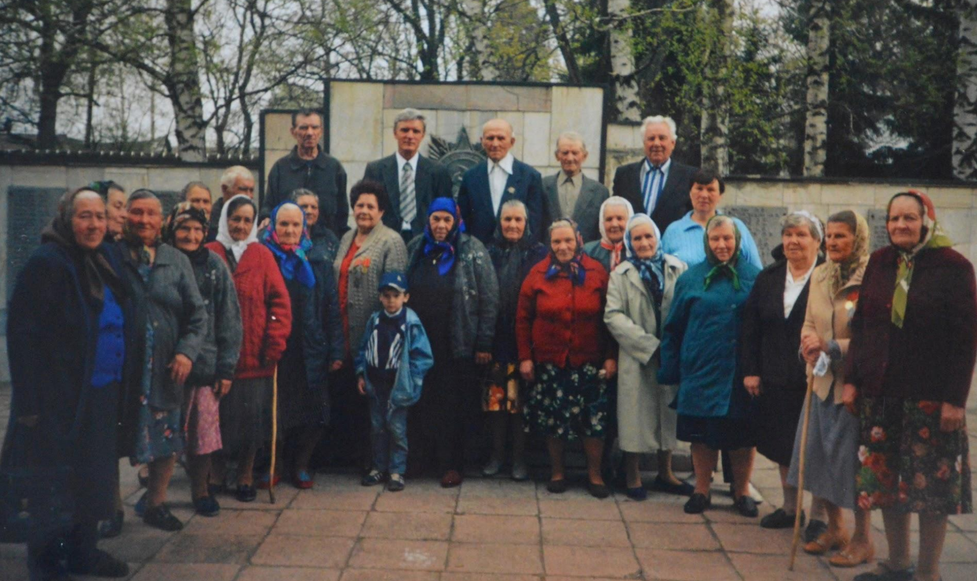
Ветераны ВОВ и труженики тыла 2005 г.