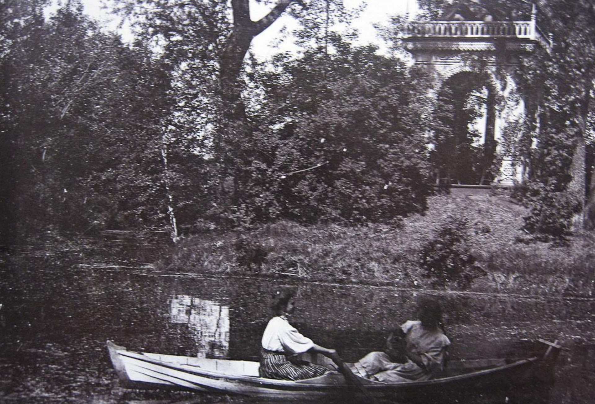
Фото 1910 года. Пруд на территории усадьбы Н.М. Рихтер.