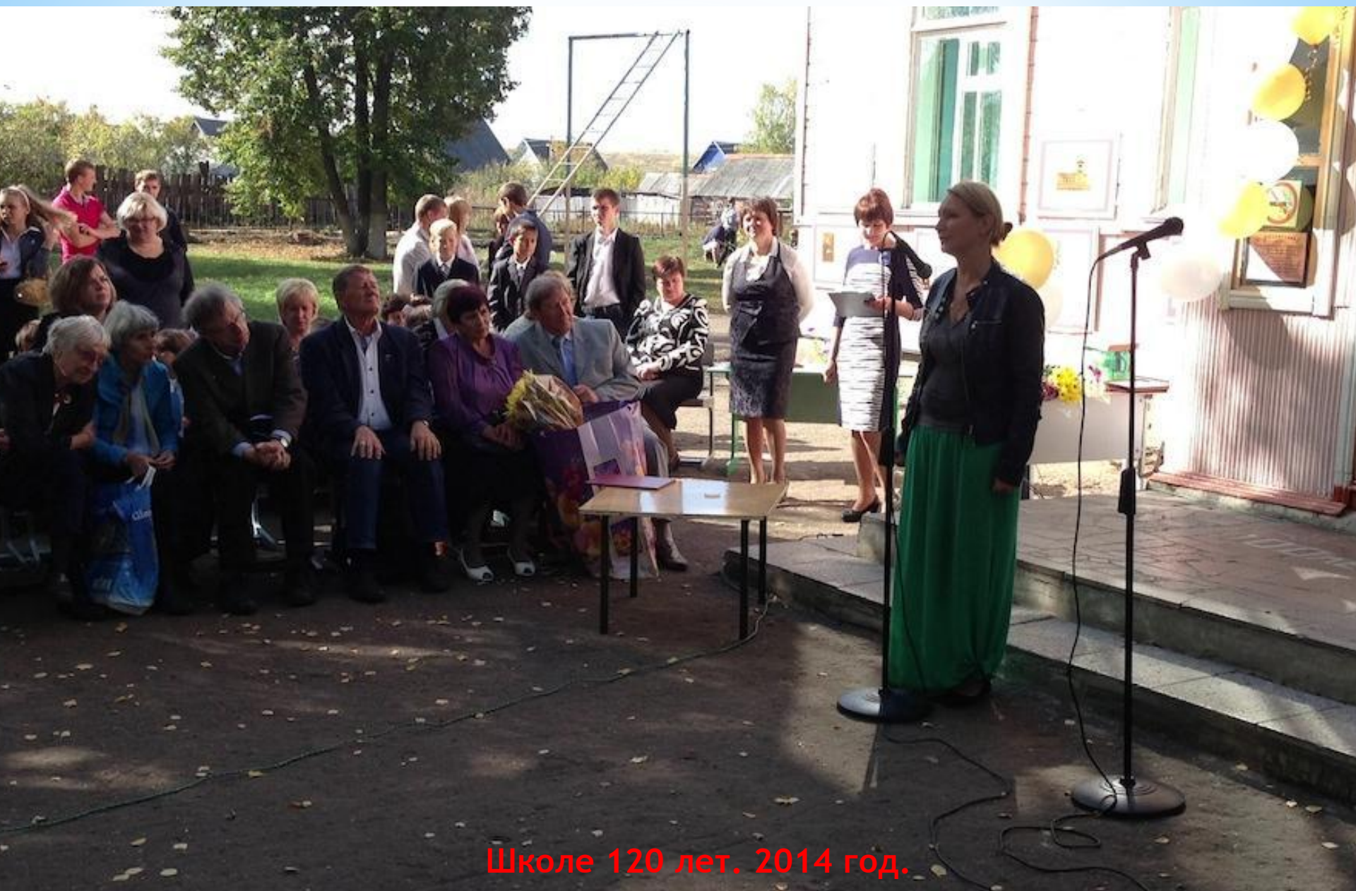
Школе 120 лет. 2014 год.