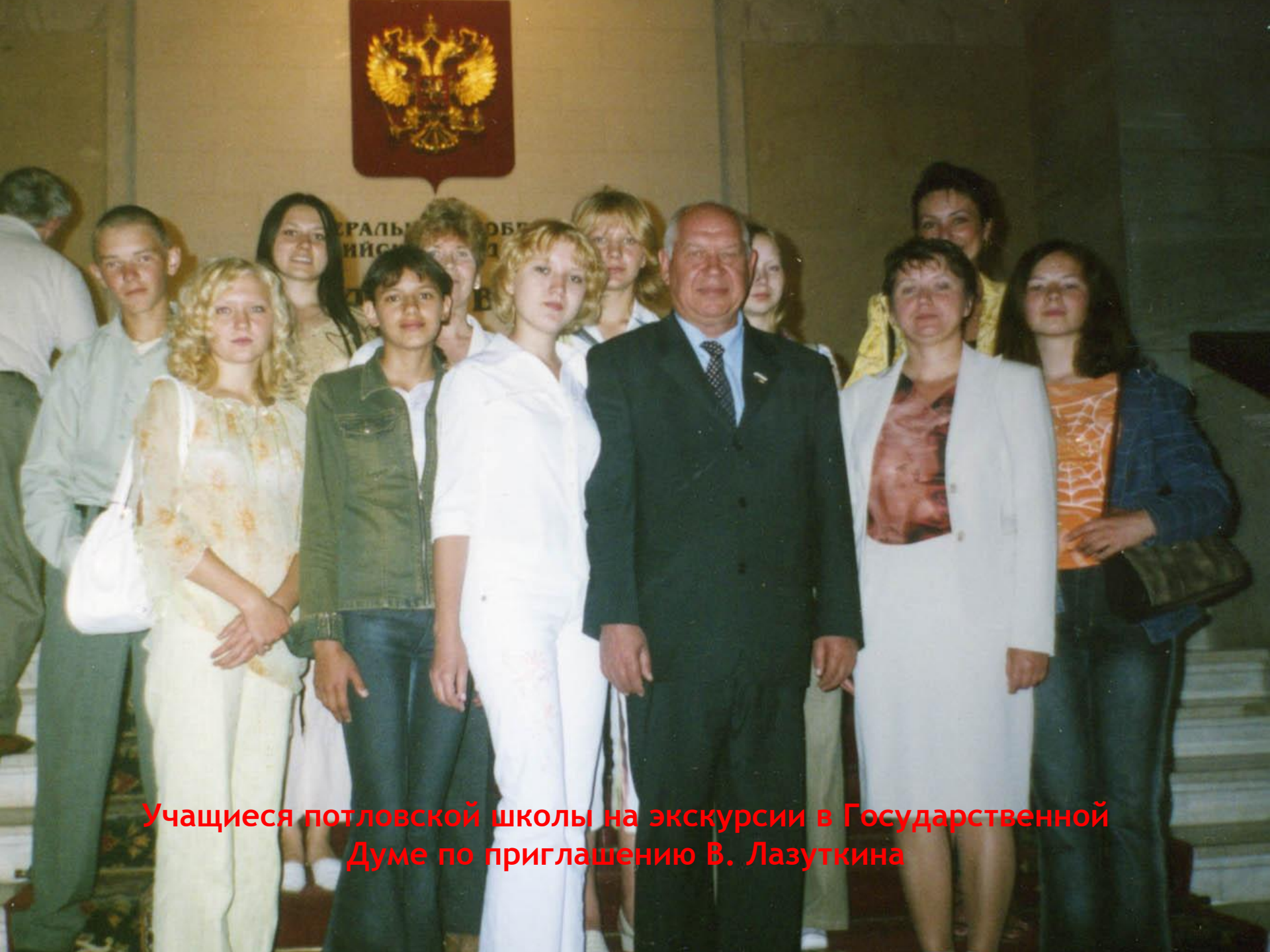
Учащиеся потловской школы на экскурсии в Государственной Думе по приглашению В. Лазуткина