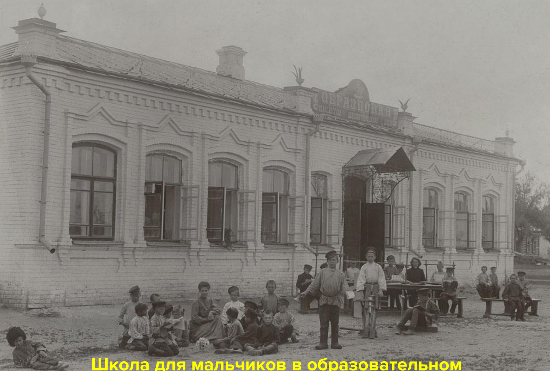
Школа для мальчиков в образовательном комплексе Н.М. Рихтер