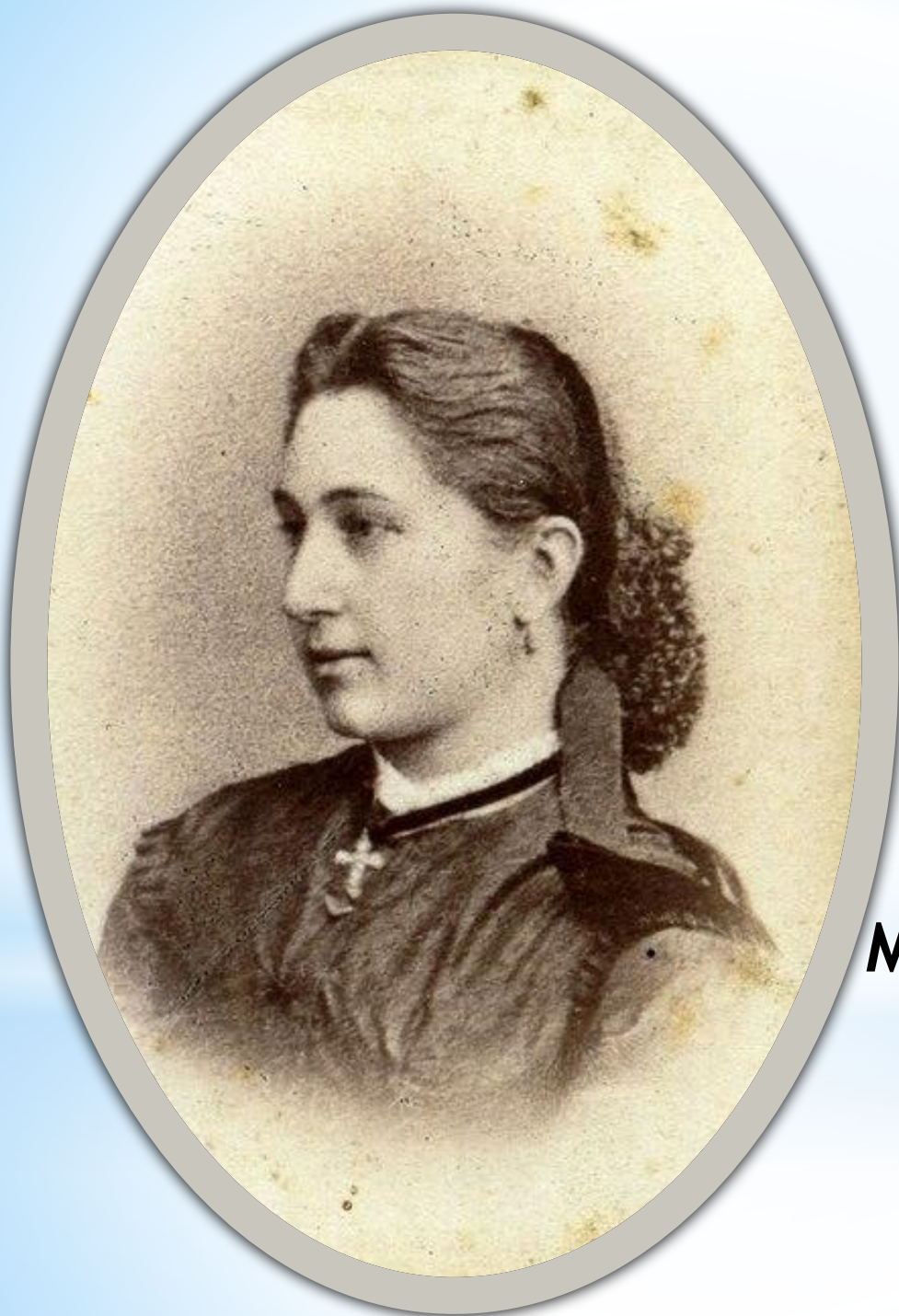
Надежда Михайловна Рихтер (1845 г. - 1929 г.)