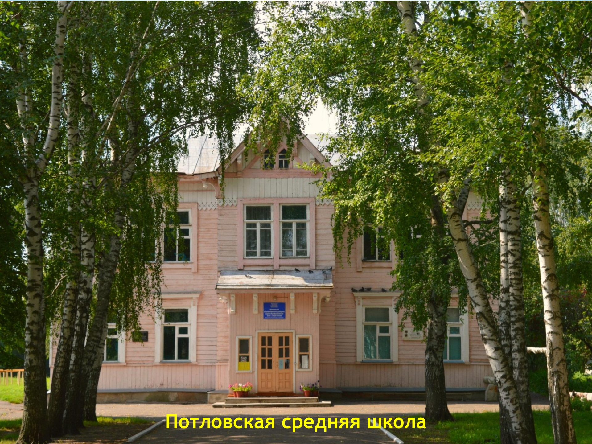
Потловская средняя школа