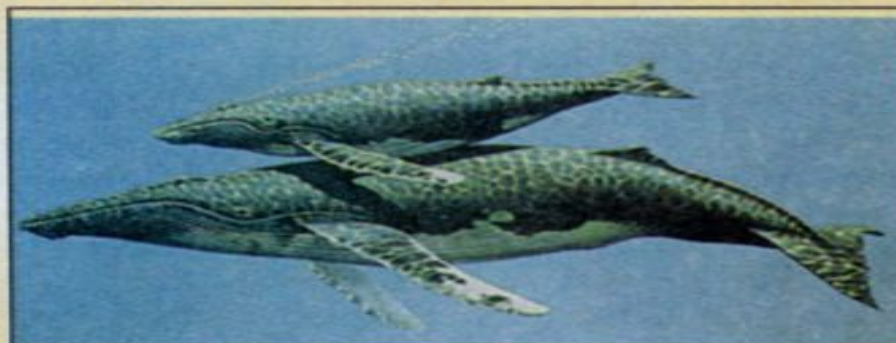
Кит с детёнышем