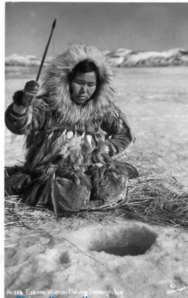
R-208 Eskimo Woman Fishing Through Ice