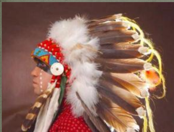
Головной убор вождя