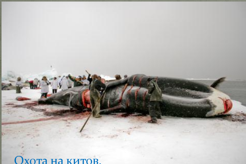
Охота на китов.

Поворотный гарпун- изобретение эскимосов