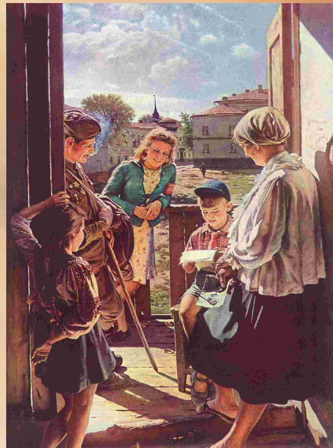
А.Лактионов. Письмо с фронта