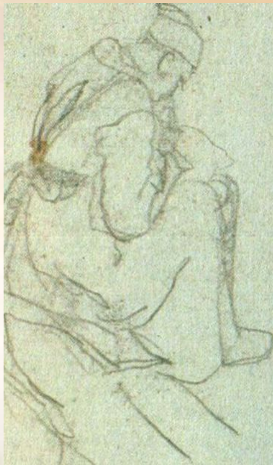
В.В Зимин. Письмо домой