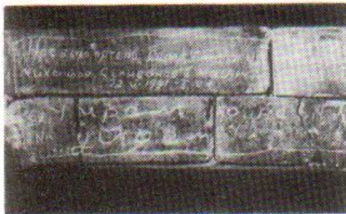
Надписи на кирпичах Брестской крепости