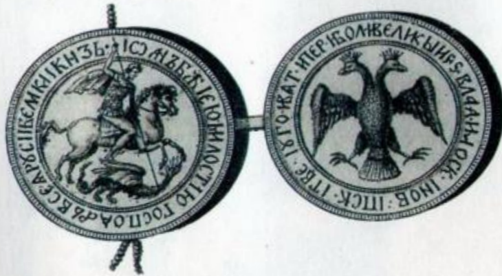
Печать Ивана Третьего (справа) и прорисовка её сторон

На одной стороне печати, вокруг изображения всадника, написано: «Великий князь Иоанн Божию милостью Господарь всея Руси». На другой стороне, вокруг изображения двуглавого орла, продолжается: «И великий князь Владимирский и Московский и Новгородский и Псковский и Тверской и Угорский и Вятский и Пермский и Болгарский». Это было почётное звание князя – его титул.