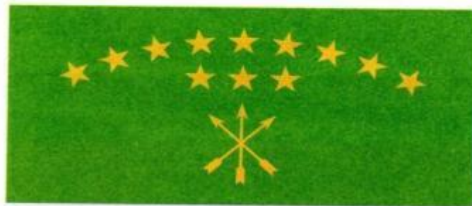
Флаг Республики Адыгея