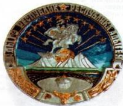
Герб Республики Адыгея