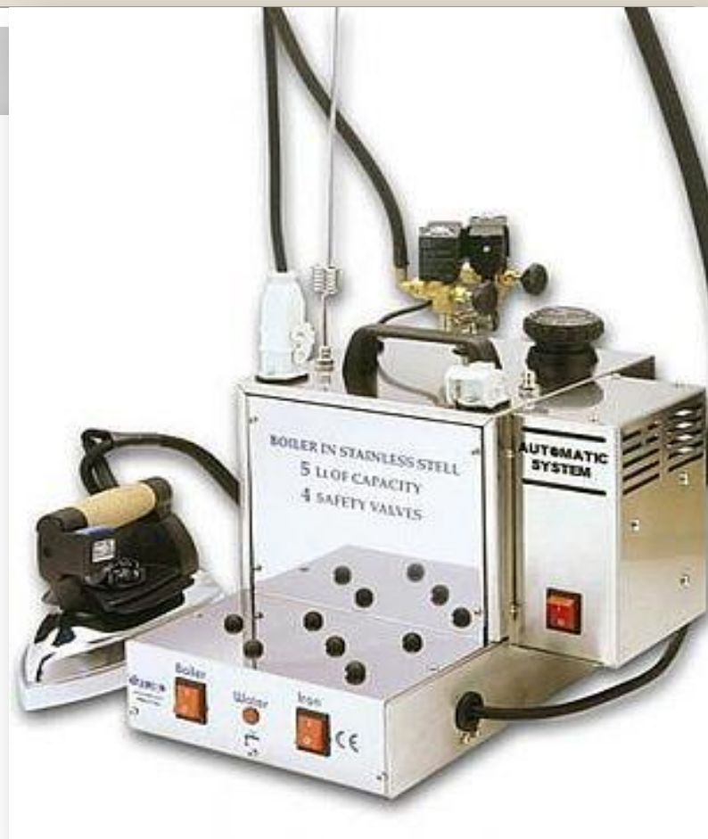
Гладильный стол консольного типа Утюг с парогенератором