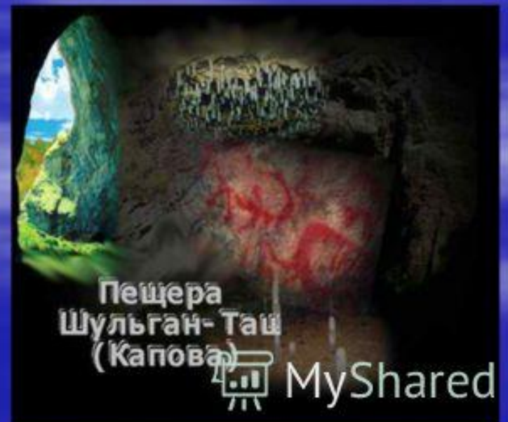
Пещера Шульган-Таш (Капова)