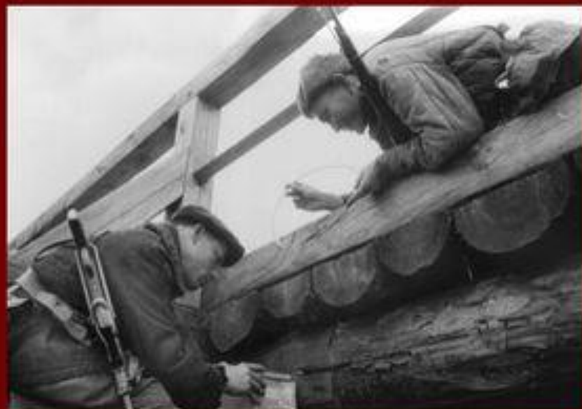
Медаль "Партизану Отечественной войны" Учреждена 2 февраля 1943 г.