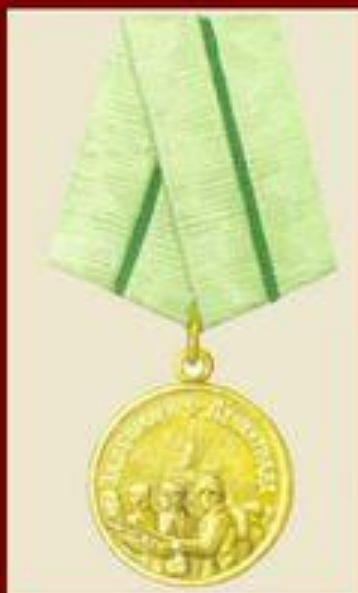
Медаль "За оборону Ленинграда" Учреждена в декабре 1942 года