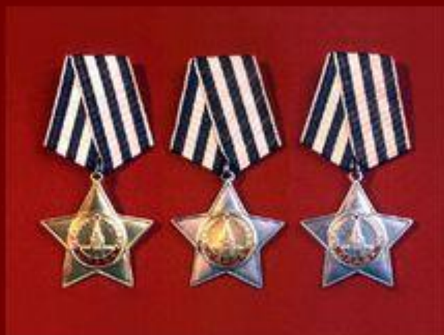
Орден Славы Учрежден 8 ноября 1943 г.