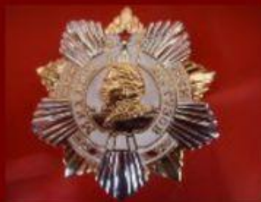
Орден Ушакова Учрежден 3 марта 1944 г.