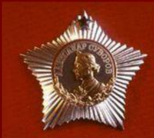
Орден Суворова Учрежден 29 июля 1942 г.