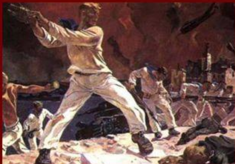
Медаль "За оборону Севастополя" Учреждена 22 декабря 1942 г.