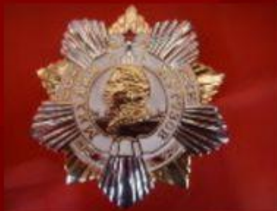
Орден Кутузова Учрежден 29 июля 1942 г.