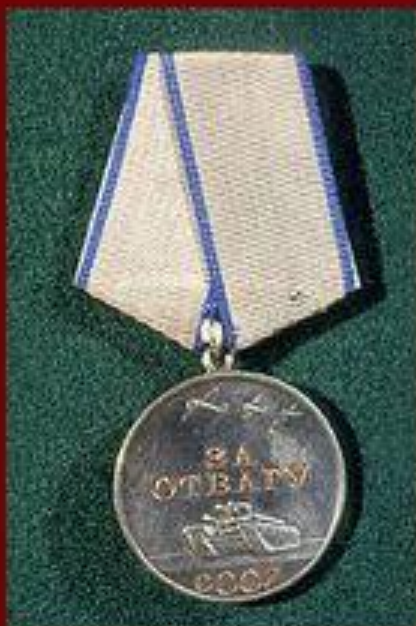
Медаль "За отвагу" Учреждена 17 октября 1938 года