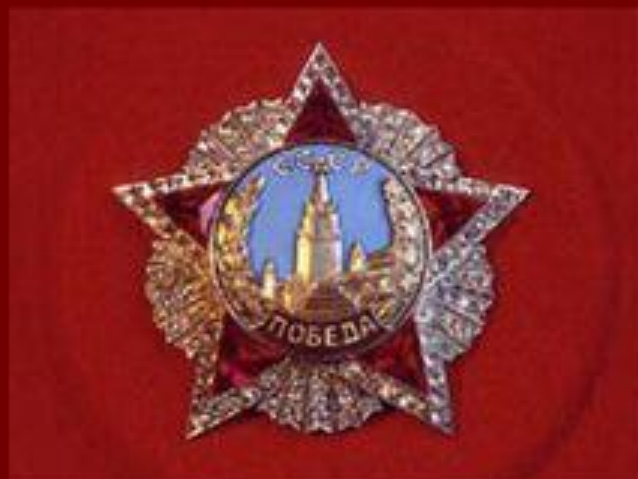
Орден "Победа" Учрежден 8 ноября 1943 г.