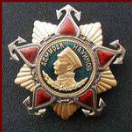
Орден Нахимова Учрежден 3 марта 1944 г.