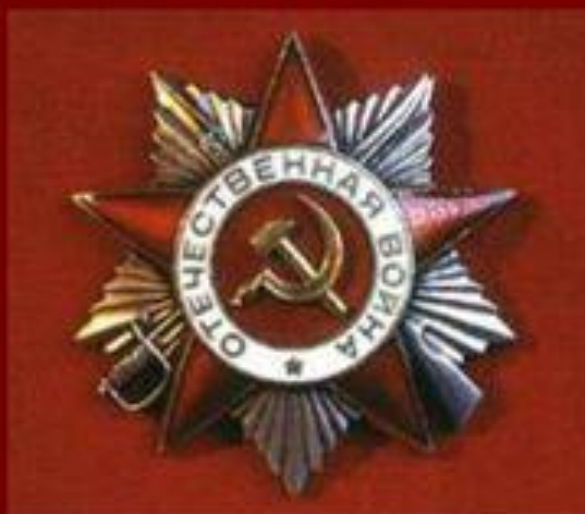
Орден Отечественной войны Учрежден 20 мая 1942 г.