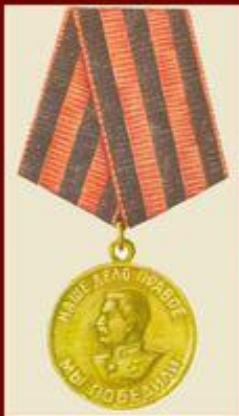
Медаль "За победу над Германией в Великой Отечественной войне 1941-1945 гг." Учреждена 9 мая 1945 г.