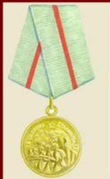
Медаль "За оборону Сталинграда" Учреждена 22 декабря 1942 г.