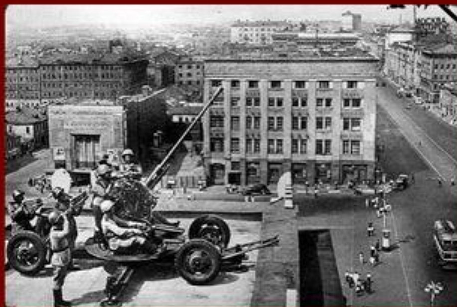
Медаль «За оборону Москвы» Учреждена 1 мая 1944 г.