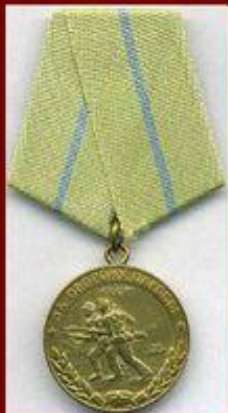
Медалью «За оборону Одессы» Учреждена 22 декабря 1942 г.