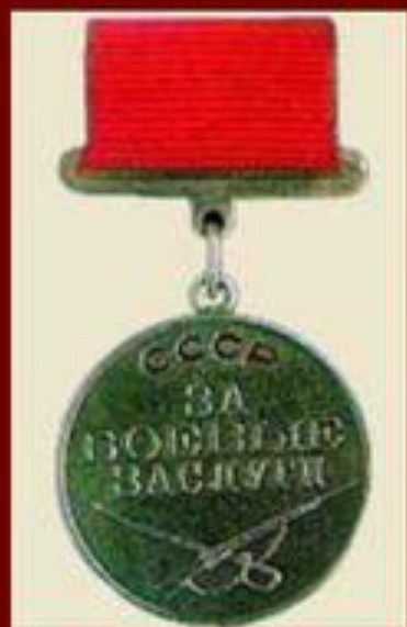
Медаль "За боевые заслуги" Учреждена 17 октября 1938 года.