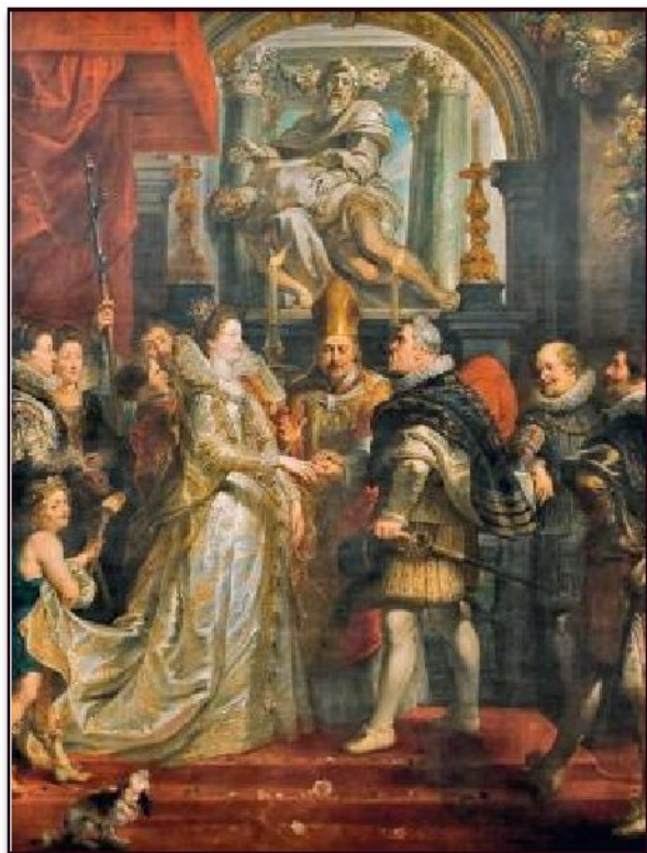
Питер Пауль Рубенс «Бракосочетание Марии Медичи с королем Франции Генрихом IV», 1622-1625

Начиная с 1620 г. Рубенс путешествовал по крупным европейским столицам. В 1621 г. фламандская регентша Изабелла Испанская сделала Рубенса своим советником по вопросу продления перемирия с Голландской республикой.