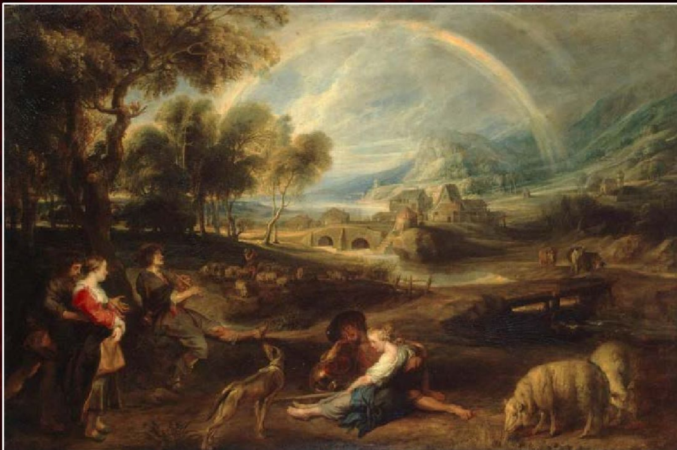
Питер Пауль Рубенс «Пейзаж с радугой», 1630