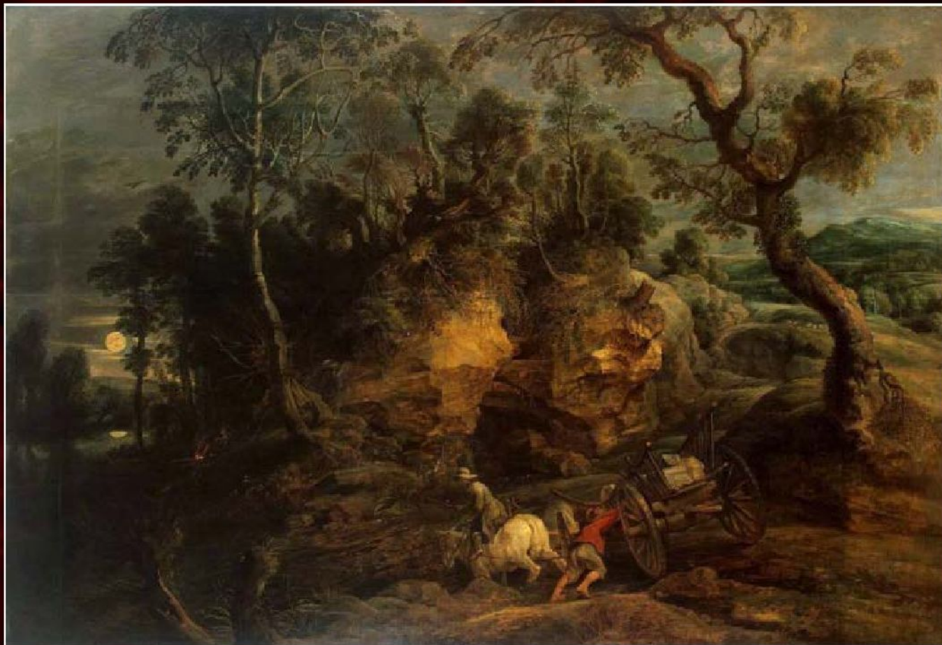
Питер Пауль Рубенс «Возчики камней», 1617