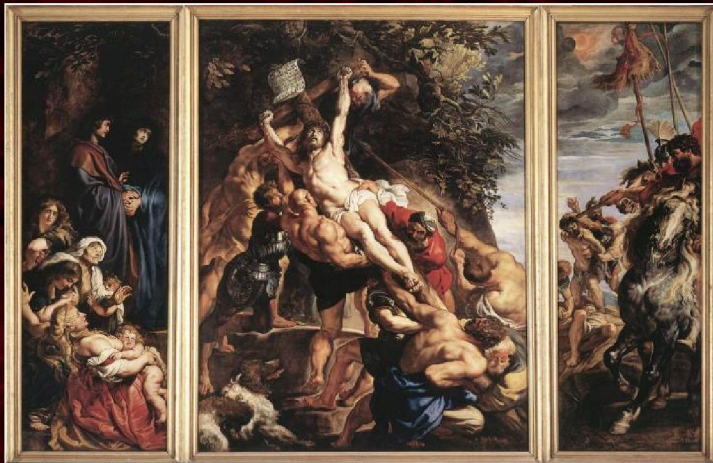
Питер Пауль Рубенс «Водружение креста», 1609-1610