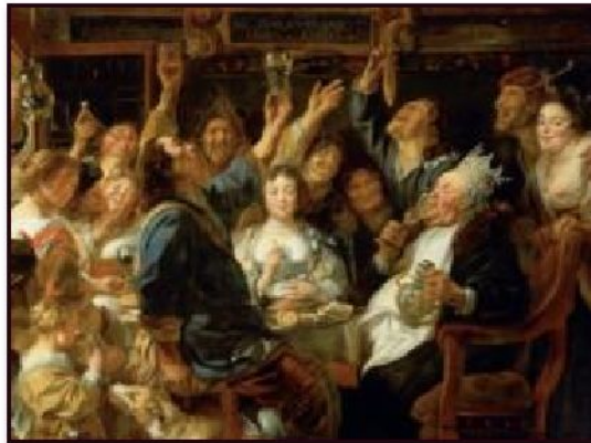
Якоб Йорданс «Бобовый король» (фрагмент), ок.1665

Во Фландрии продолжились традиции искусства Нидерландов. Но католическая церковь с подозрением относилась к сказочной пестроте старонидерландского искусства. Художники, которые по своему пытались истолковать библейские сюжеты, рисковали быть обвинёнными в ереси.