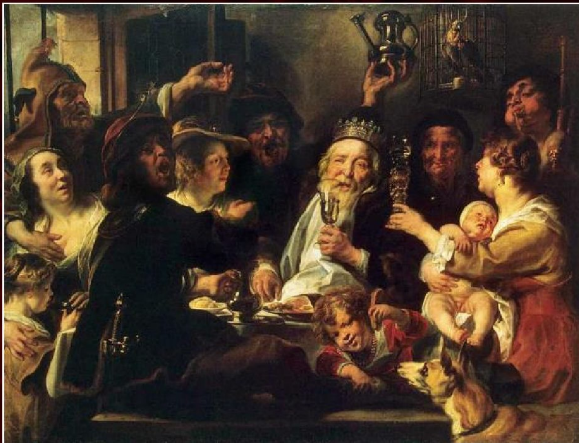
Якоб Йорданс «Бобовый король», ок.1638