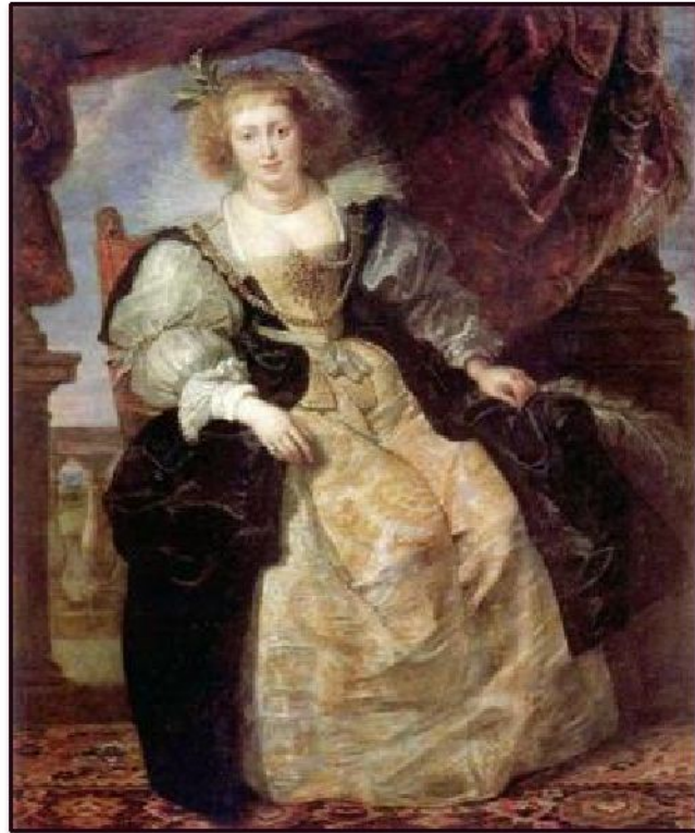
Питер Пауль Рубенс «Елена Фоурмен в свадебном платье», 1630-1631

После смерти первой жены Рубенс женился на Елене Фоурмен в 1630г. Елена стала неизменной моделью картин Рубенса 1630-х гг.