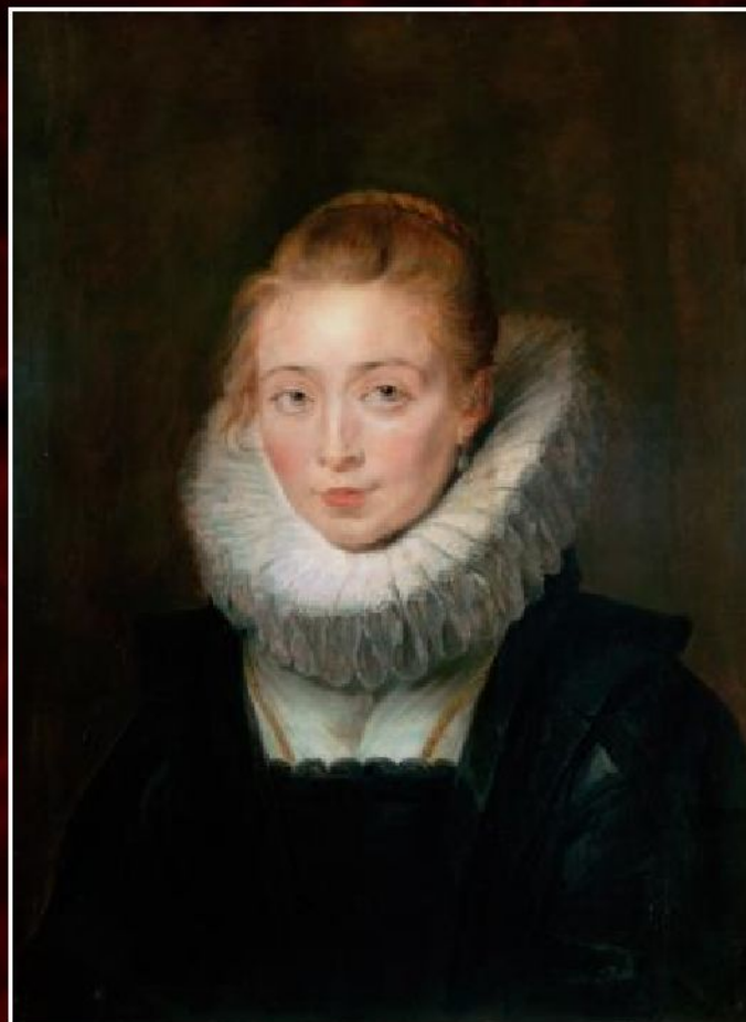
Питер Пауль Рубенс «Портрет камеристки инфанты Изабеллы», ок.1623-1626