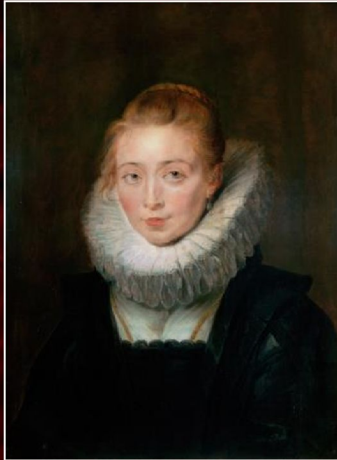
Питер Пауль Рубенс «Портрет камеристки инфанты Изабеллы», ок.1623-1626