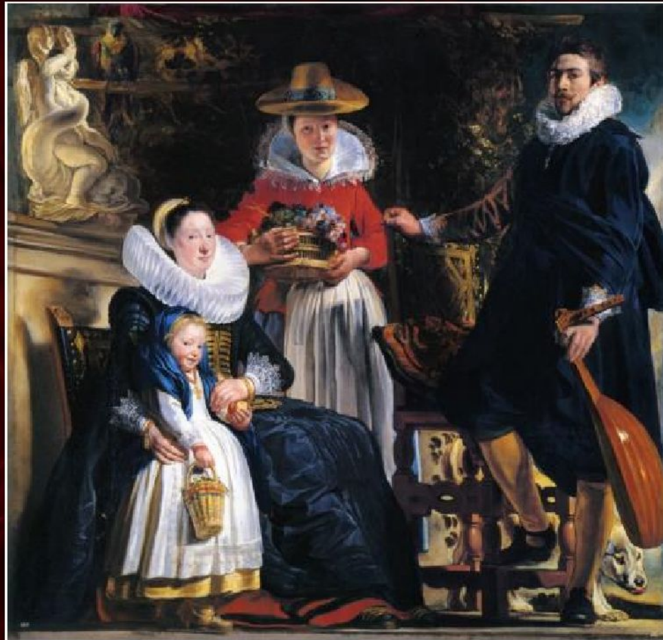
Якоб Йорданс «Семейный портрет», 1621-1622