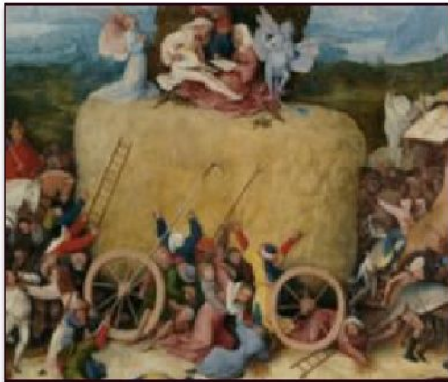
Иероним Босх «Воз сена» (фрагмент), 1500-1502