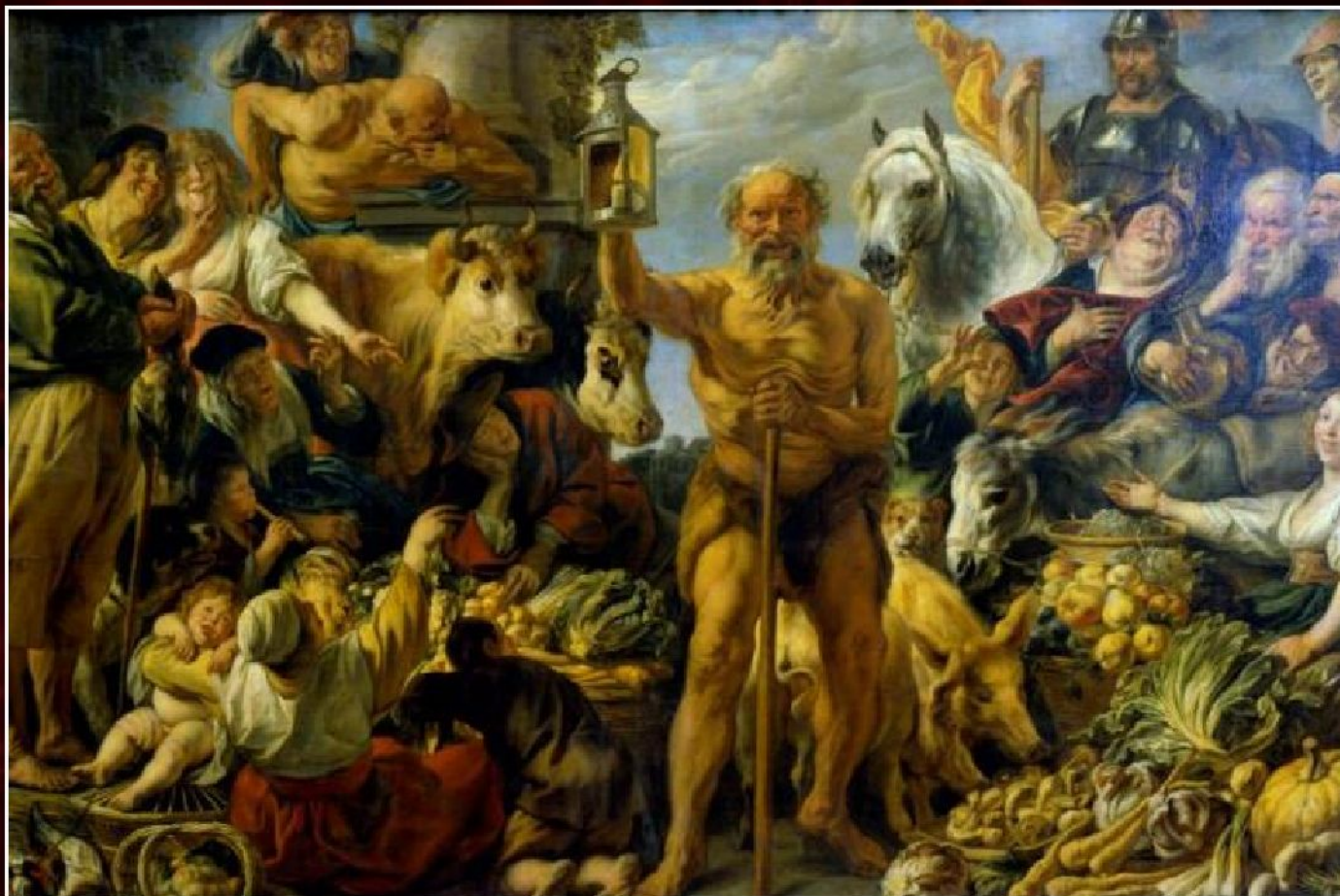
Якоб Йорданс «Диоген», ок.1643