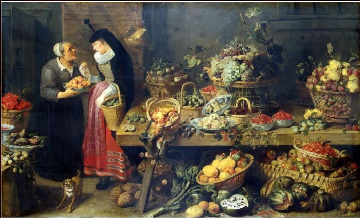
Франс Снейдерс «Фруктовая лавка», 1618-1621