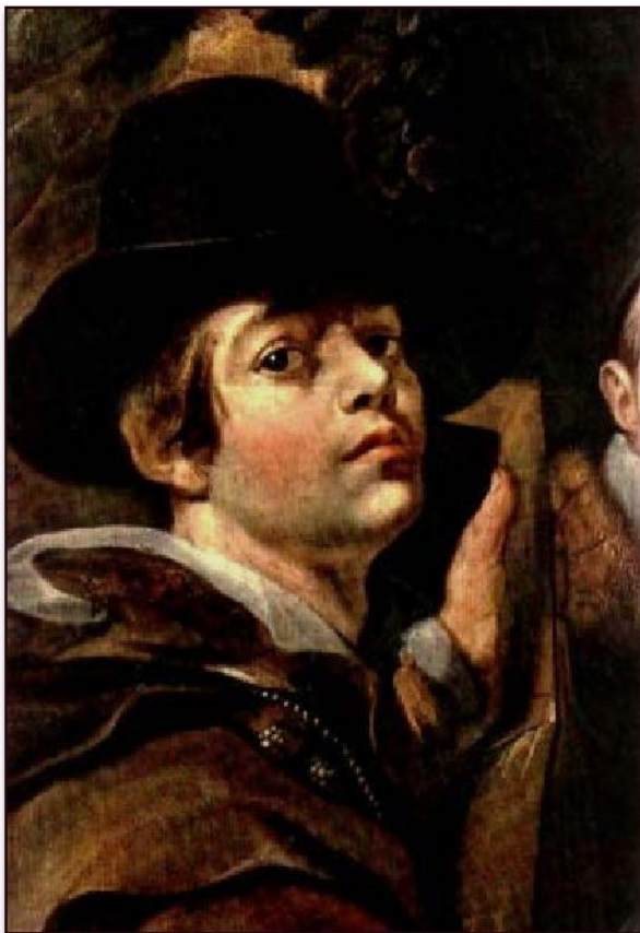
Якоб Йорданс «Семейный портрет» (фрагмент с автопортретом), 1615