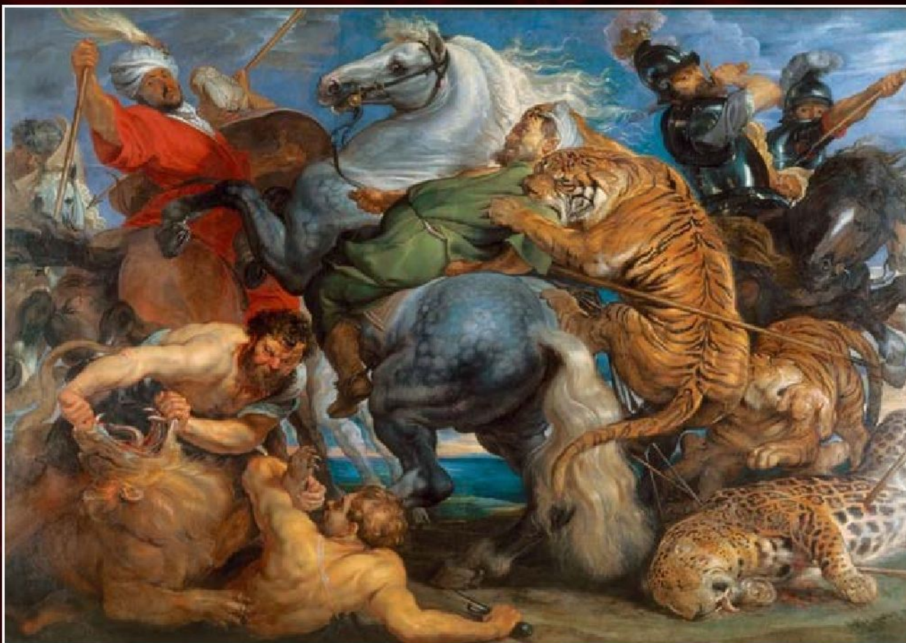
Питер Пауль Рубенс «Охота на тигров и львов», 1615-1618