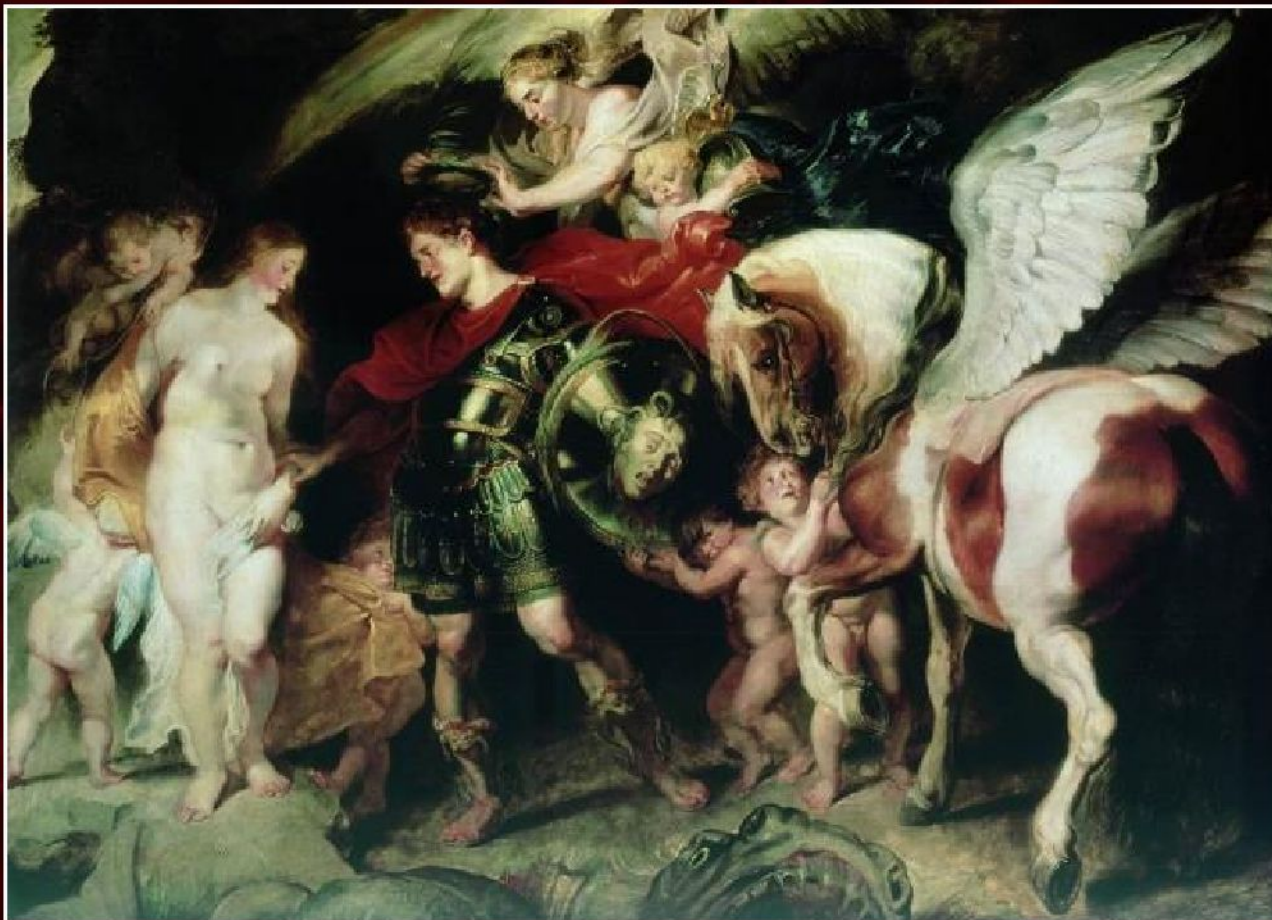
Питер Пауль Рубенс «Персей и Андромеда», 1620-1621