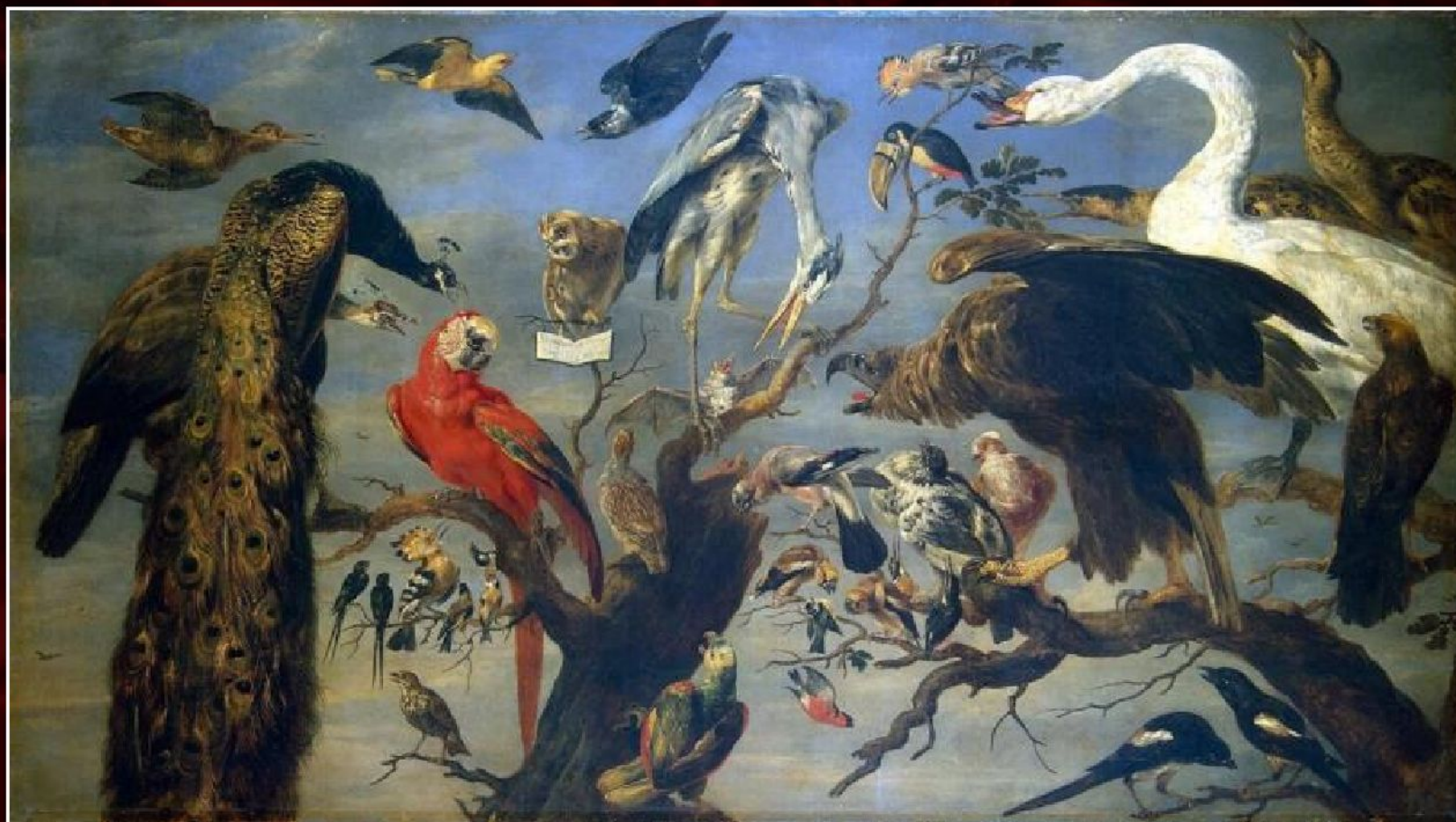
Франс Снейдерс «Птичий концерт», 1630-1640