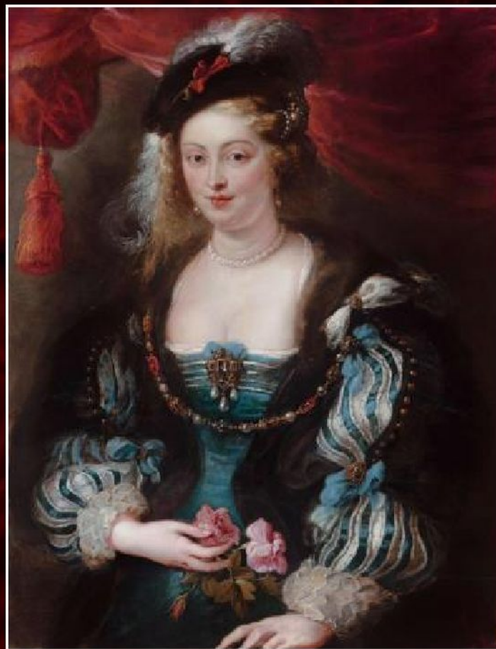
Питер Пауль Рубенс «Портрет Елены Фоурмен», ок.1636