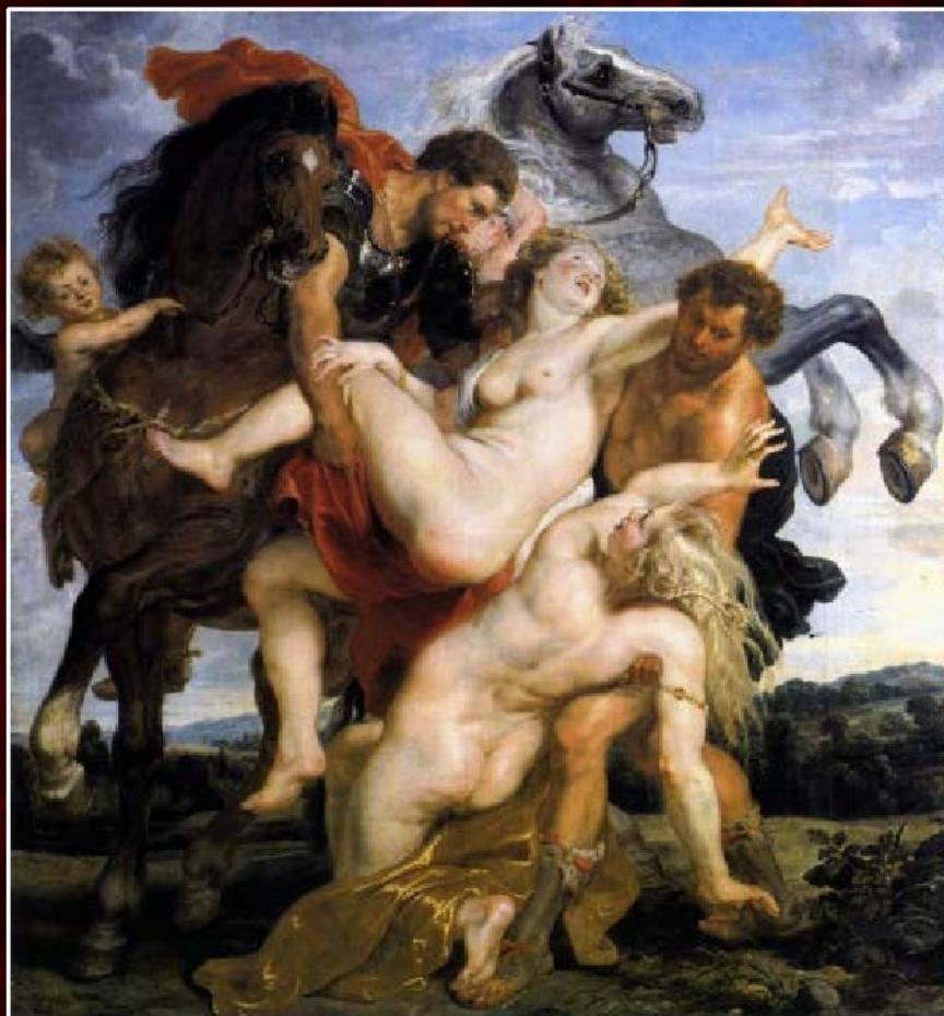
Питер Пауль Рубенс «Похищение дочерей Левкиппа», 1618