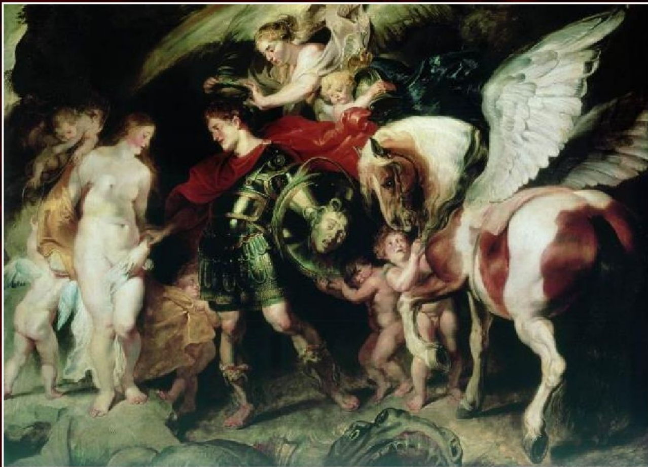
Питер Пауль Рубенс «Персей и Андромеда», 1620-1621