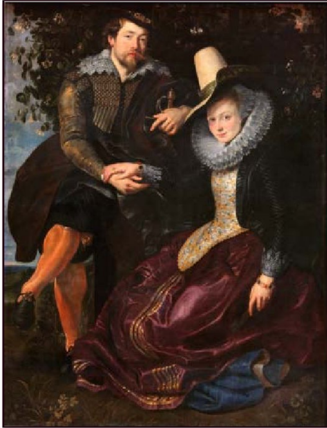
Питер Пауль Рубенс «Автопортрет с Изабеллой Брант» (Жимолостная беседка), 1609