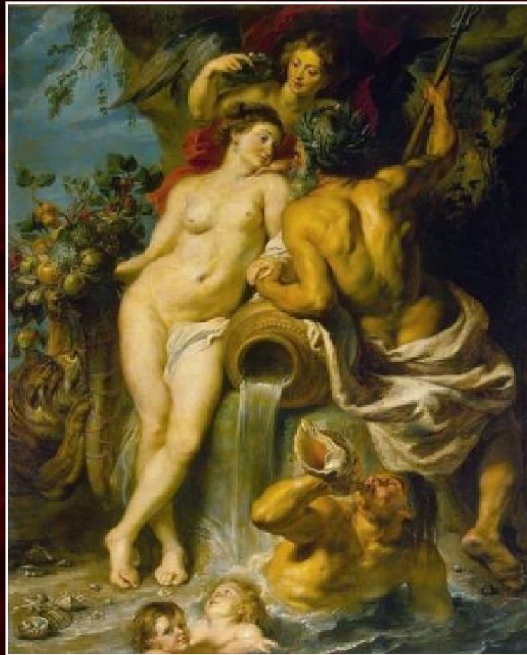
Питер Пауль Рубенс «Союз Земли и Воды», 1618