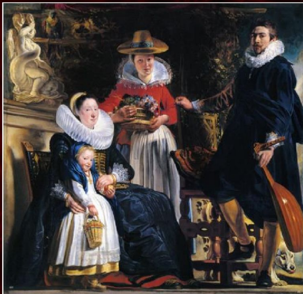
Якоб Йорданс «Семейный портрет», 1621-1622