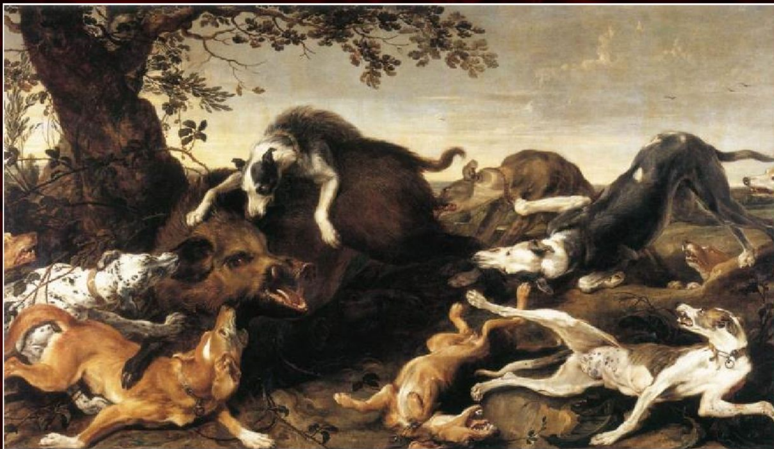
Франс Снейдерс «Охота на кабана», 1625-1630