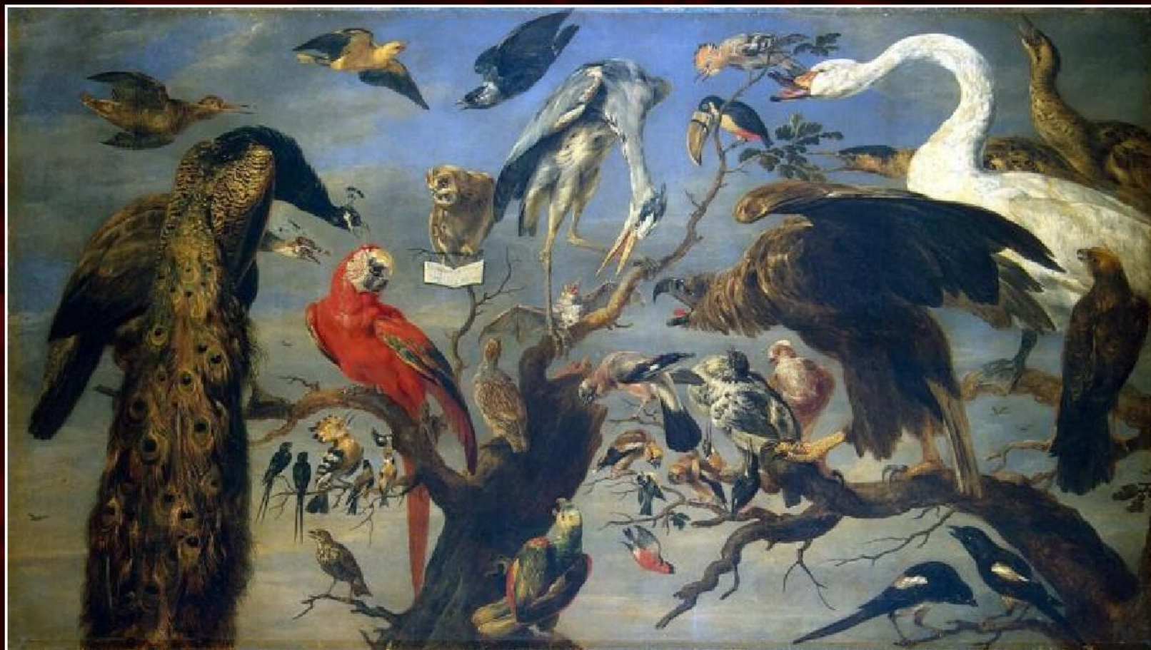
Франс Снейдерс «Птичий концерт», 1630-1640