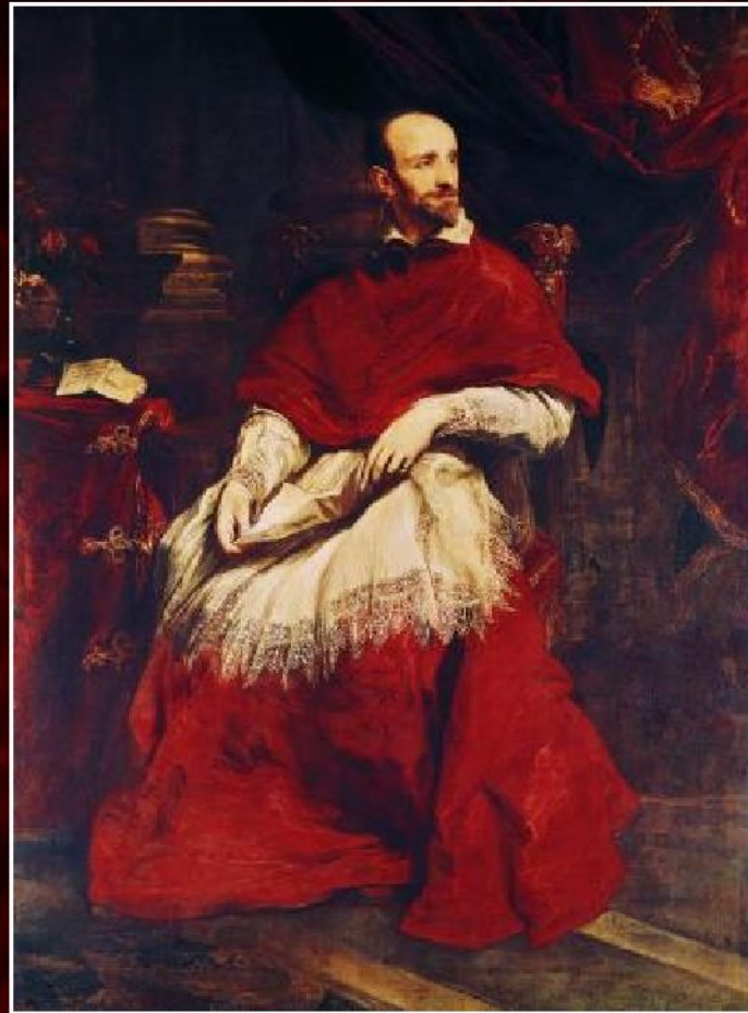
Антонис ван Дейк «Портрет кардинала Гвидо Бентивольо», 1622-1623