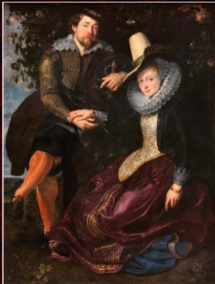
Питер Пауль Рубенс «Автопортрет с Изабеллой Брант» (Жимолостная беседка), 1609