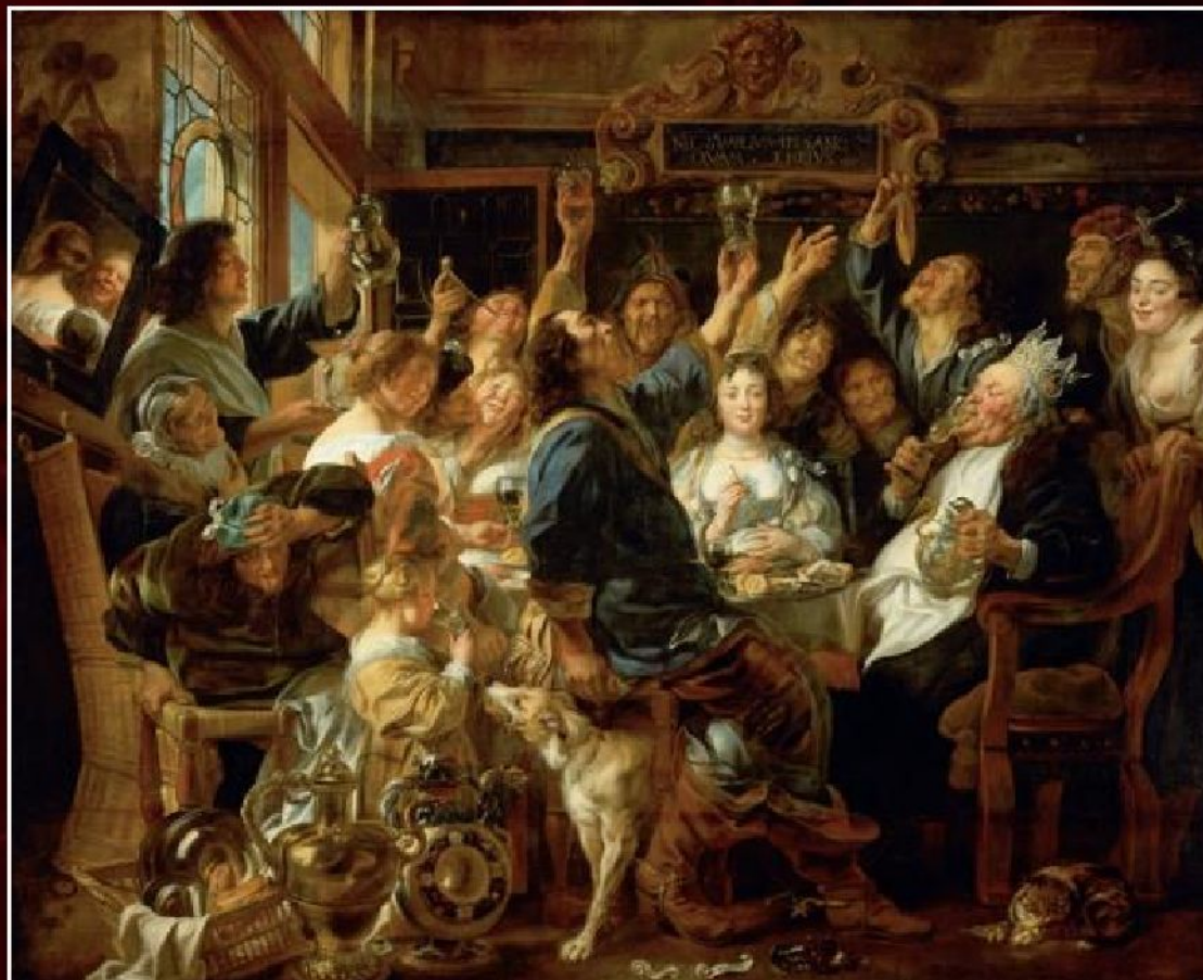
Якоб Йорданс «Бобовый король», ок.1655