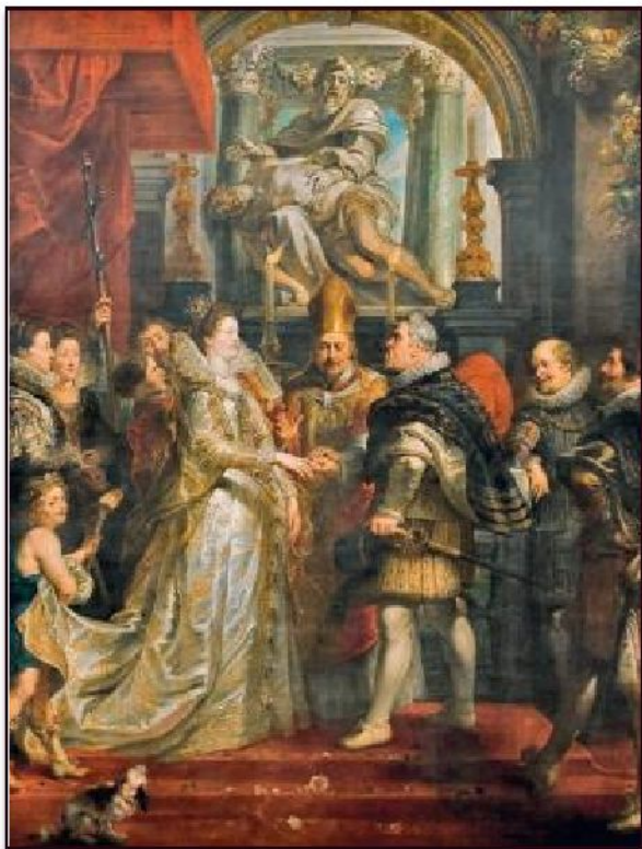
Питер Пауль Рубенс «Бракосочетание Марии Медичи с королем Франции Генрихом IV», 1622-1625

Начиная с 1620 г. Рубенс путешествовал по крупным европейским столицам. В 1621 г. фламандская регентша Изабелла Испанская сделала Рубенса своим советником по вопросу продления перемирия с Голландской республикой.