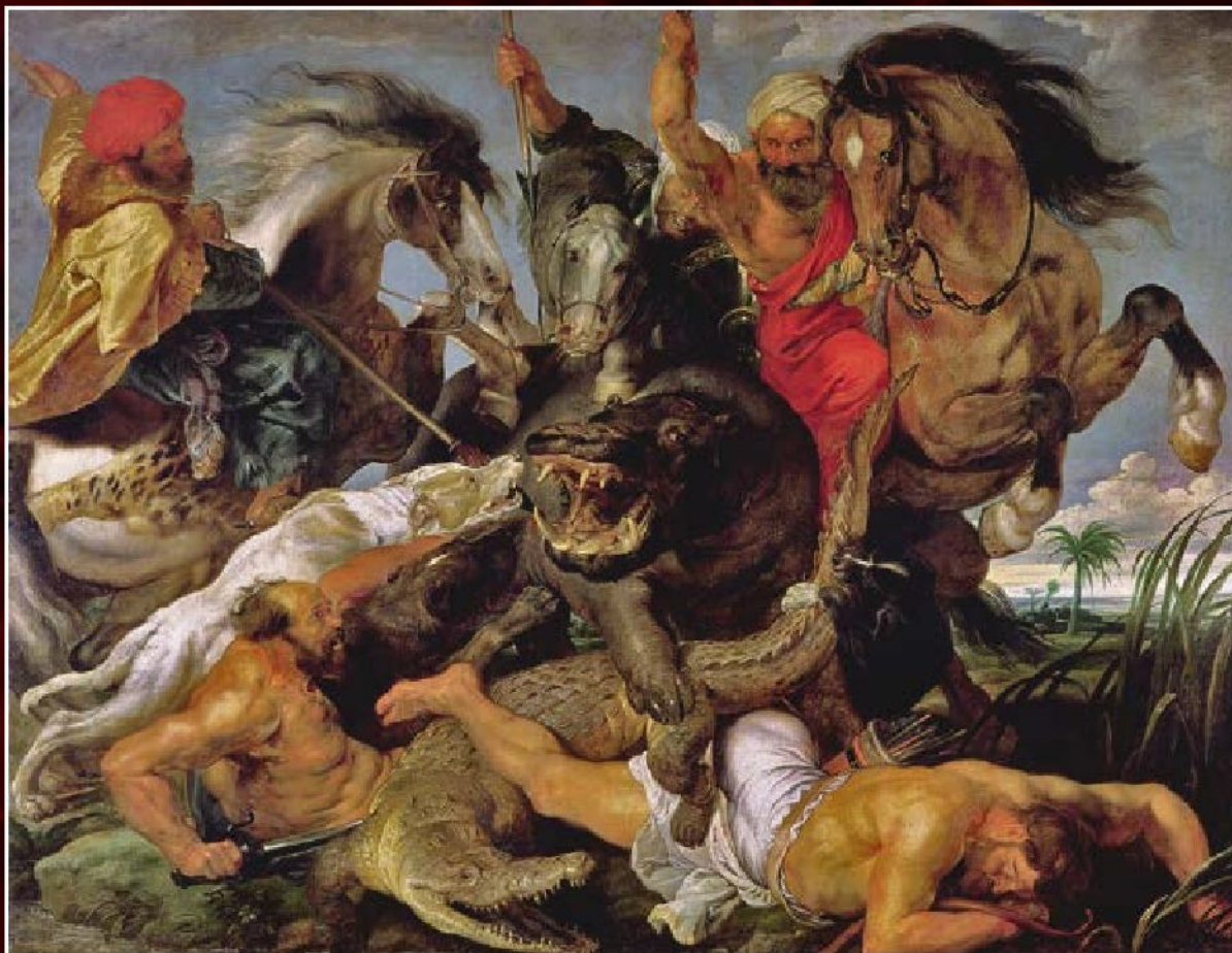
Питер Пауль Рубенс «Охота на гиппопотама», 1615-1618