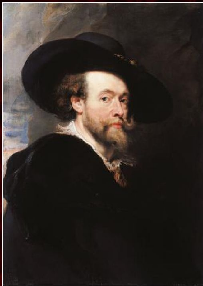
Питер Пауль Рубенс «Автопортрет», ок. 1623