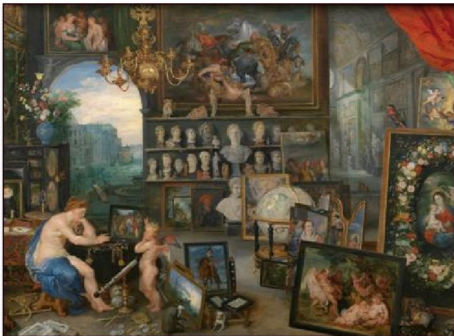
Ян Брейгель Старший и Питер Пауль Рубенс «Аллегория Зрения» (фрагмент), 1618

Развитию искусства способствовал широкий художественный рынок, связанный с возникновением нового общественного класса – буржуазии.