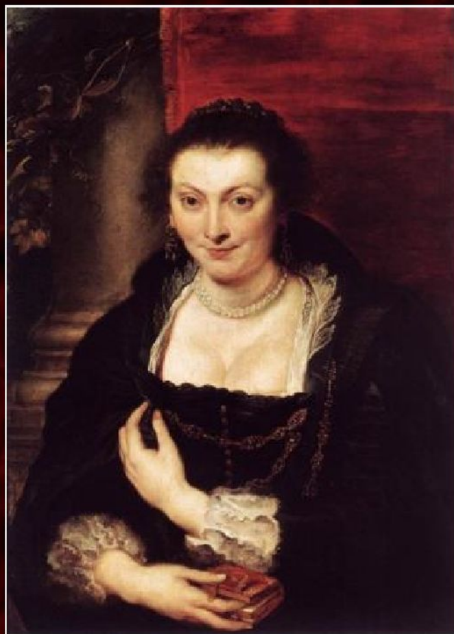
Питер Пауль Рубенс «Портрет Изабеллы Брант», ок.1625