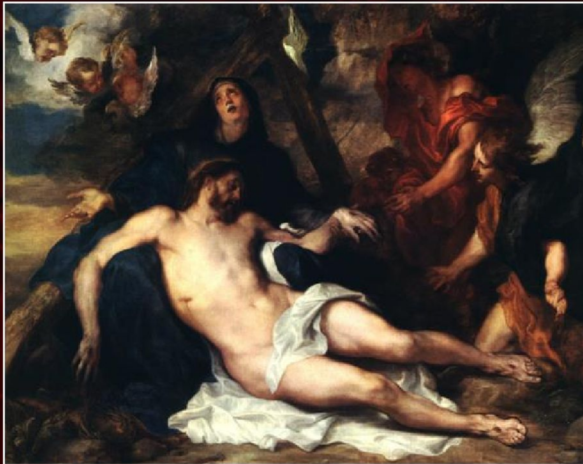
Антонис ван Дейк «Снятие со креста», 1634