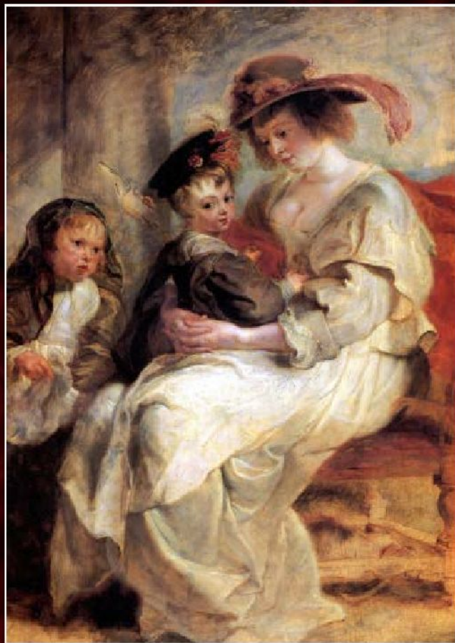
Питер Пауль Рубенс «Портрет Елены Фоурмен с двумя детьми», ок.1636