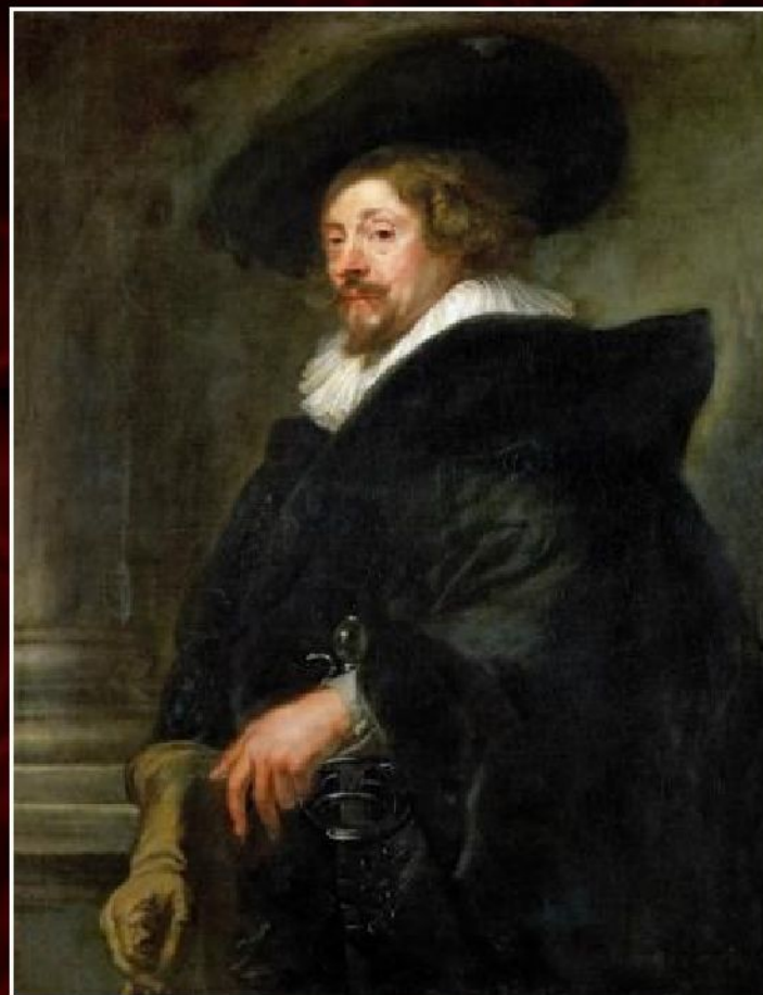
Питер Пауль Рубенс «Автопортрет», 1639