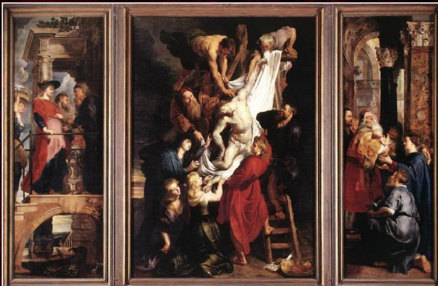
Питер Пауль Рубенс «Снятие с креста», 1610-1614