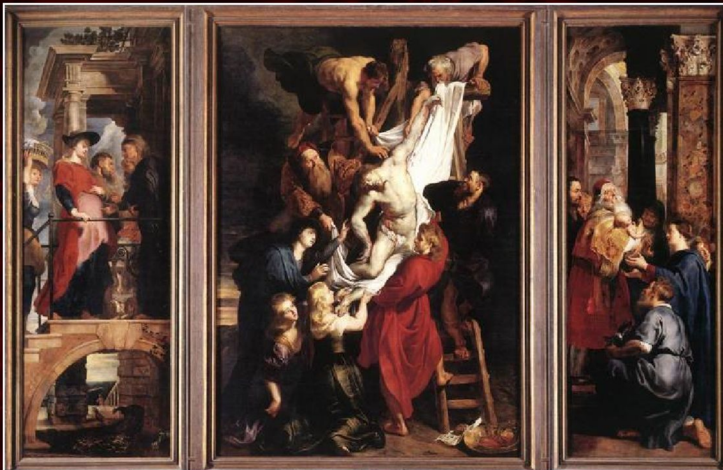
Питер Пауль Рубенс «Снятие с креста», 1610-1614