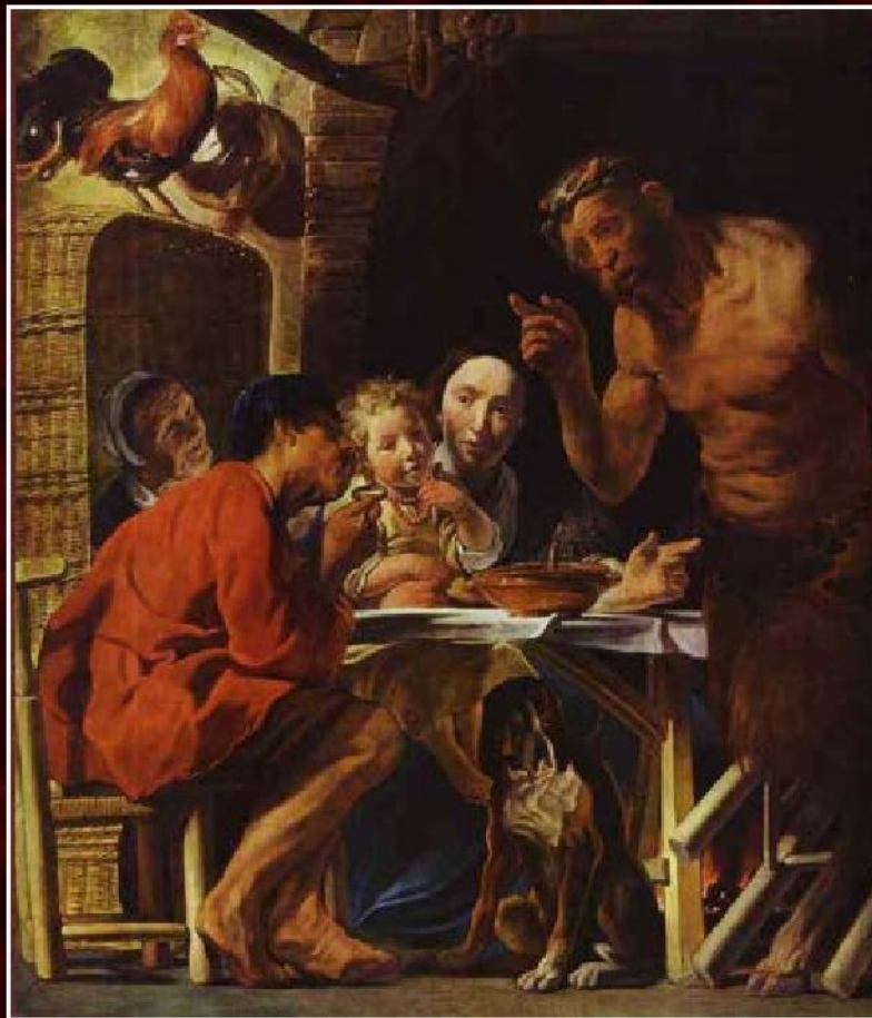
Якоб Йорданс «Сатир в гостях у крестьянина», ок.1625