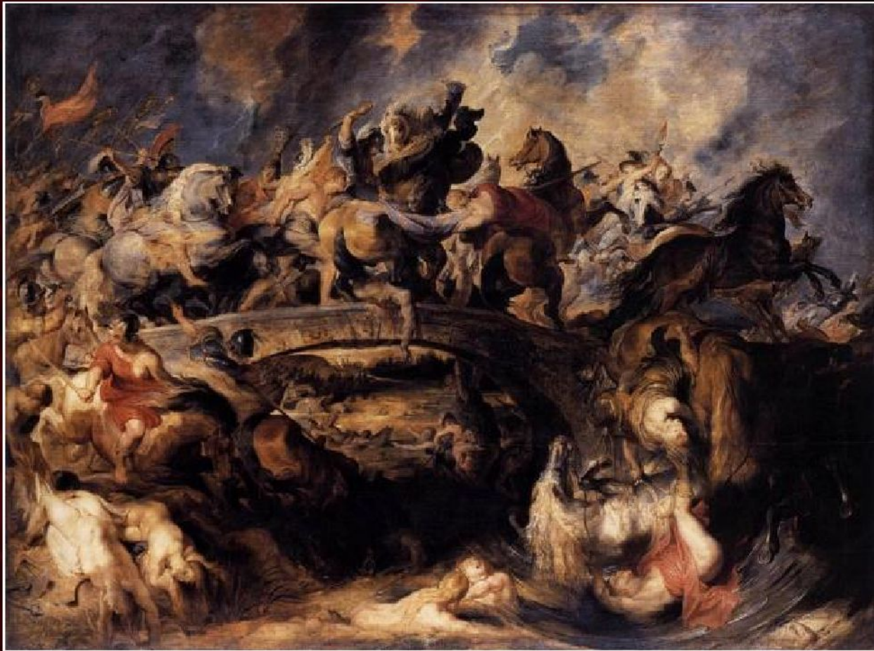
Питер Пауль Рубенс «Битва греков с амазонками», 1618