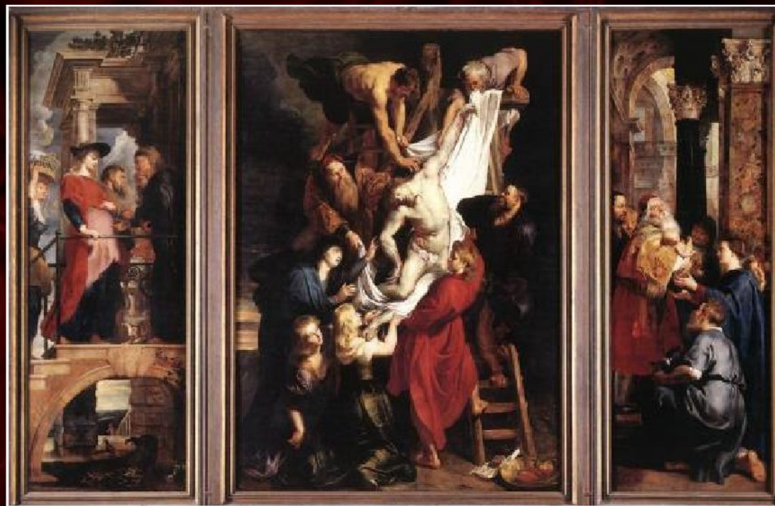
Питер Пауль Рубенс «Снятие со креста», 1610-1614

Выполнить в рабочей тетради описание одного из известнейших произведений художника Питера Пауля Рубенса.