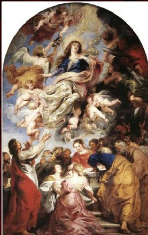
Питер Пауль Рубенс «Успение Пресвятой Богородицы», 1626