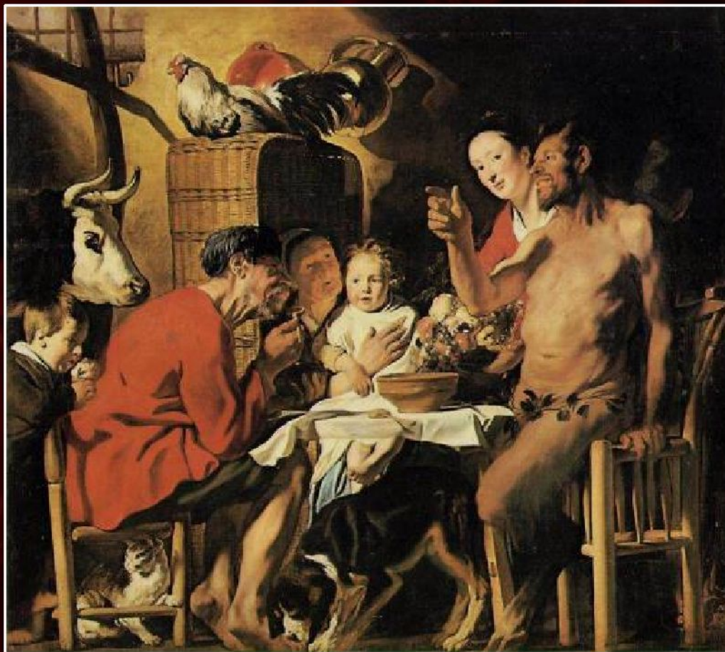
Якоб Йорданс «Сатир в гостях у крестьянина», ок.1622