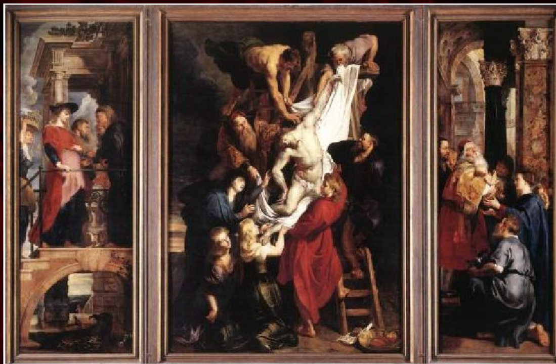
Питер Пауль Рубенс «Снятие со креста», 1610-1614

Выполнить в рабочей тетради описание одного из известнейших произведений художника Питера Пауля Рубенса.