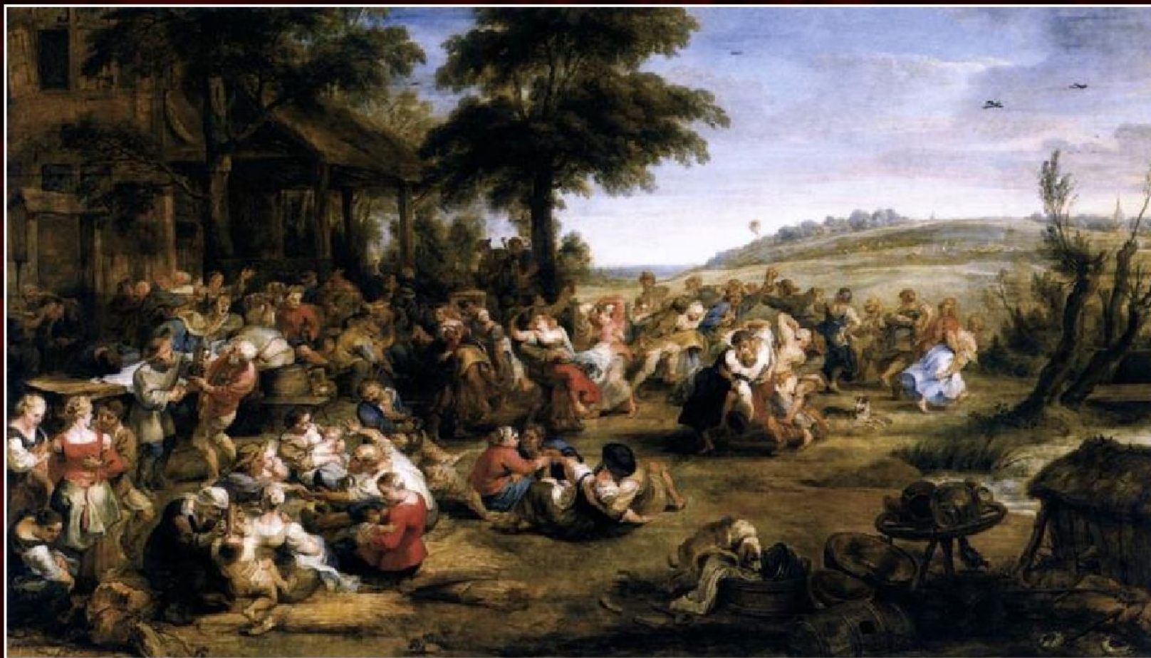
Питер Пауль Рубенс «Кермесса», 1630