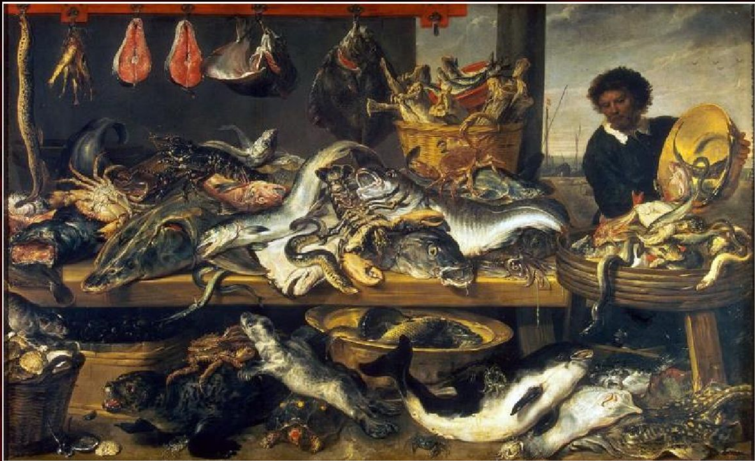
Франс Снейдерс «Торговец рыбой», ок.1620