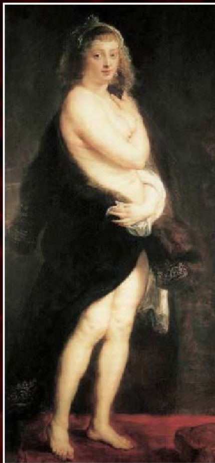
Питер Пауль Рубенс «Шубка», 1638