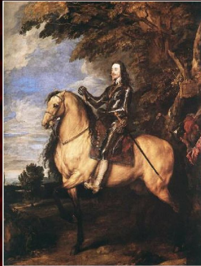
Антонис ван Дейк «Портрет Карла I», 1635