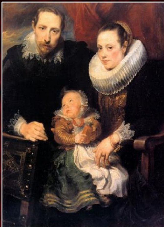
Антонис ван Дейк «Семейный портрет», 1621