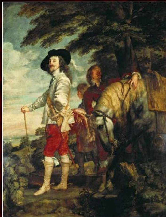
Антонис ван Дейк «Портрет Карла I на охоте», 1635