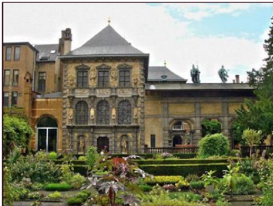
Дом Рубенса в Антверпене

В 1609 г. был назначен придворным живописцем. Художник пользовался покровительством великих герцогов, правивших Нидерландами. После женитьбы на Изабелле Брант Рубенс расширил свой антверпенский дом, превратив его в дворец-мастерскую.