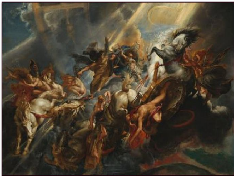
Питер Пауль Рубенс «Падение Фазтона», 1604

Отец будущего художника, антверпенский юрист Ян Рубенс, был протестантом и вывез семью за границу, спасаясь от преследований испанцев.