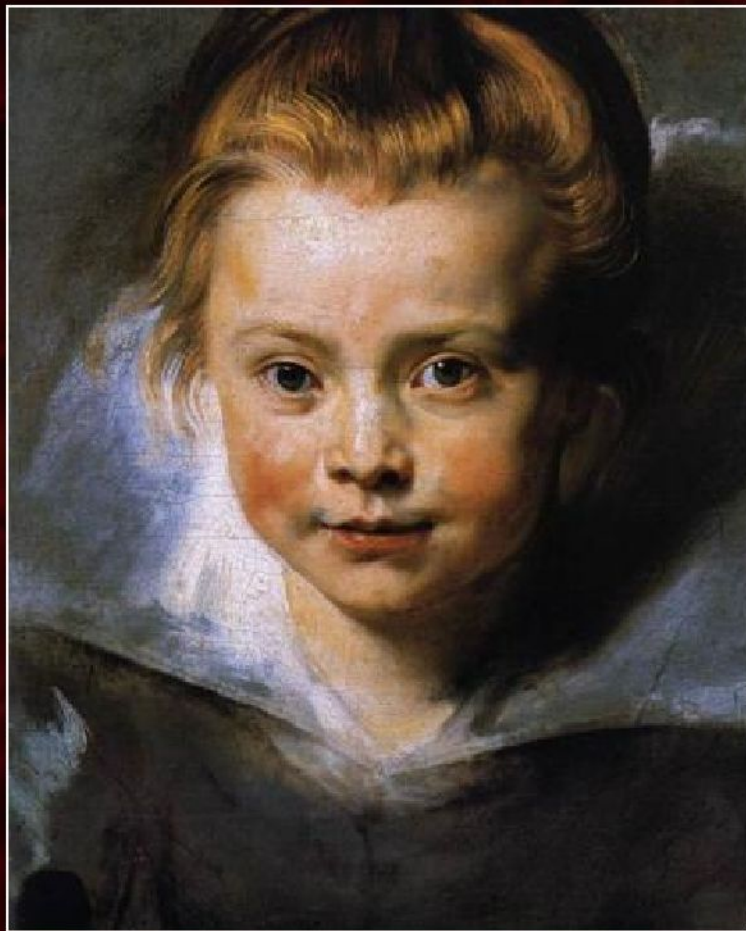
Питер Пауль Рубенс «Портрет юной девочки» (Портрет дочери Клары Серена Рубенс), ок. 1615