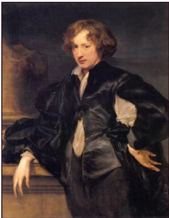
Антонис ван Дейк «Автопортрет», 1622-1623