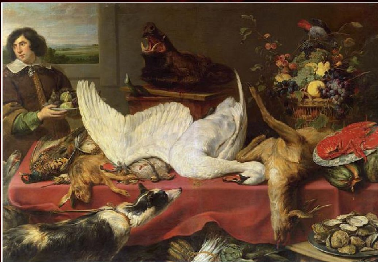
Франс Снейдерс «Натюрморт с лебедем», 1640-е