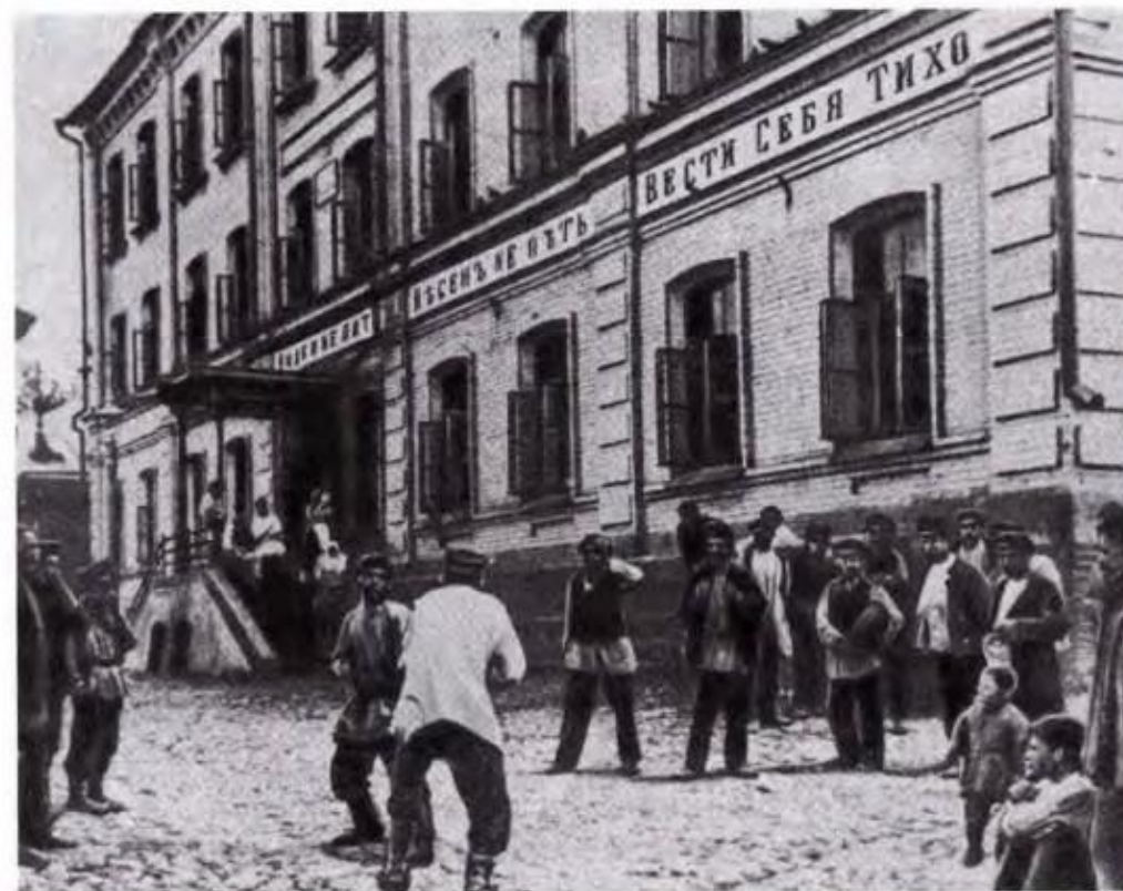
У трактира на рабочей окраине