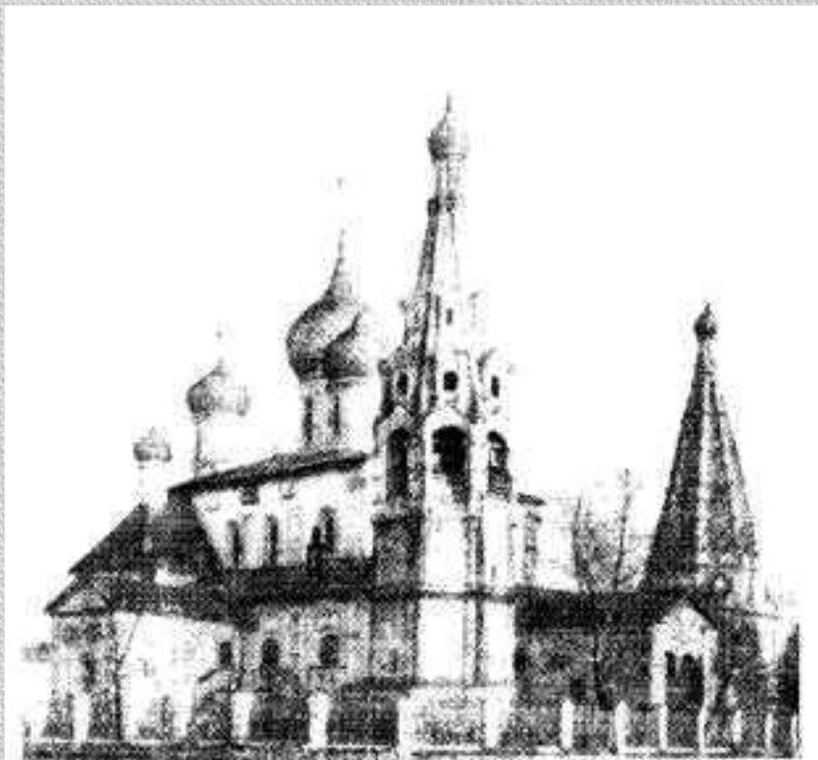
Церковь Ильи Пророка. Ярославль. 1647—1650 гг.

4. Главным направлением в развитии культуры 17 века было?