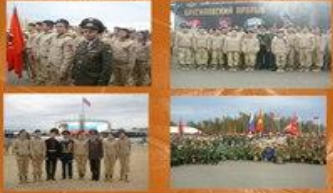
Участие юнармейцев МО «Донской» в праздновании 100-летия Великой Победы «Братская дружба» Московская обл. Галайцы

Мы – юнармейцы великой страны. Мы – юнармейцы великой державы! Прошлым своим гордиться должны, Мир укреплять – нам дано это право