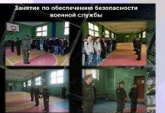
Занятия по обеспечению безопасности военной службы