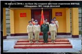
16 августа 2016 г. на базе ЗО создано местное отделение ВВПОД «Юнармия» МО город Донской