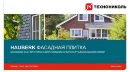
Таблица подбора комплектующих 2021 https://yadi.sk/i/v22gyXTn3E8wKw

Презентация по продукту 2021 https://yadi.sk/d/26wwZEyJ59IXwQ